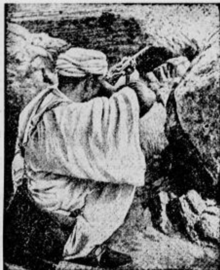
Marokanec strelja iz zasede na Amerikance