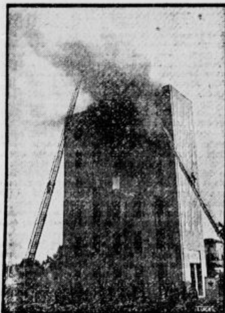
Duce prisostvuje v Rimu vaji gasilskih čet.

Ze delj časa je v Bolgariji predpis, da država izplačuje v gotovini le zneske do 100.000 levov, kar je več od tega zneska plačujejo z nakazili. V bodoče bo bolgarska državna blagajna zasebnikom in tvežkam v gotovini tudi nakazili izplačala le znesek do 200.000 levov, od presežkov pa bo polovico izplačevala v 3 odstotnih državnih bonih.