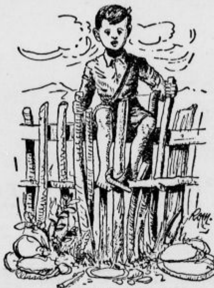
... je žogel svoje pesmice.

Vetrnjak je imel z dečkom blazno veselje in ga je tudi razodeval na blazen način, ker se je z otrokom igral, kot bi bil lutka. Vihtel ga je kot žogo iz ene roke v drugo, dvigal ga visoko nad glavo in ga zopet naglo spuščal, ga