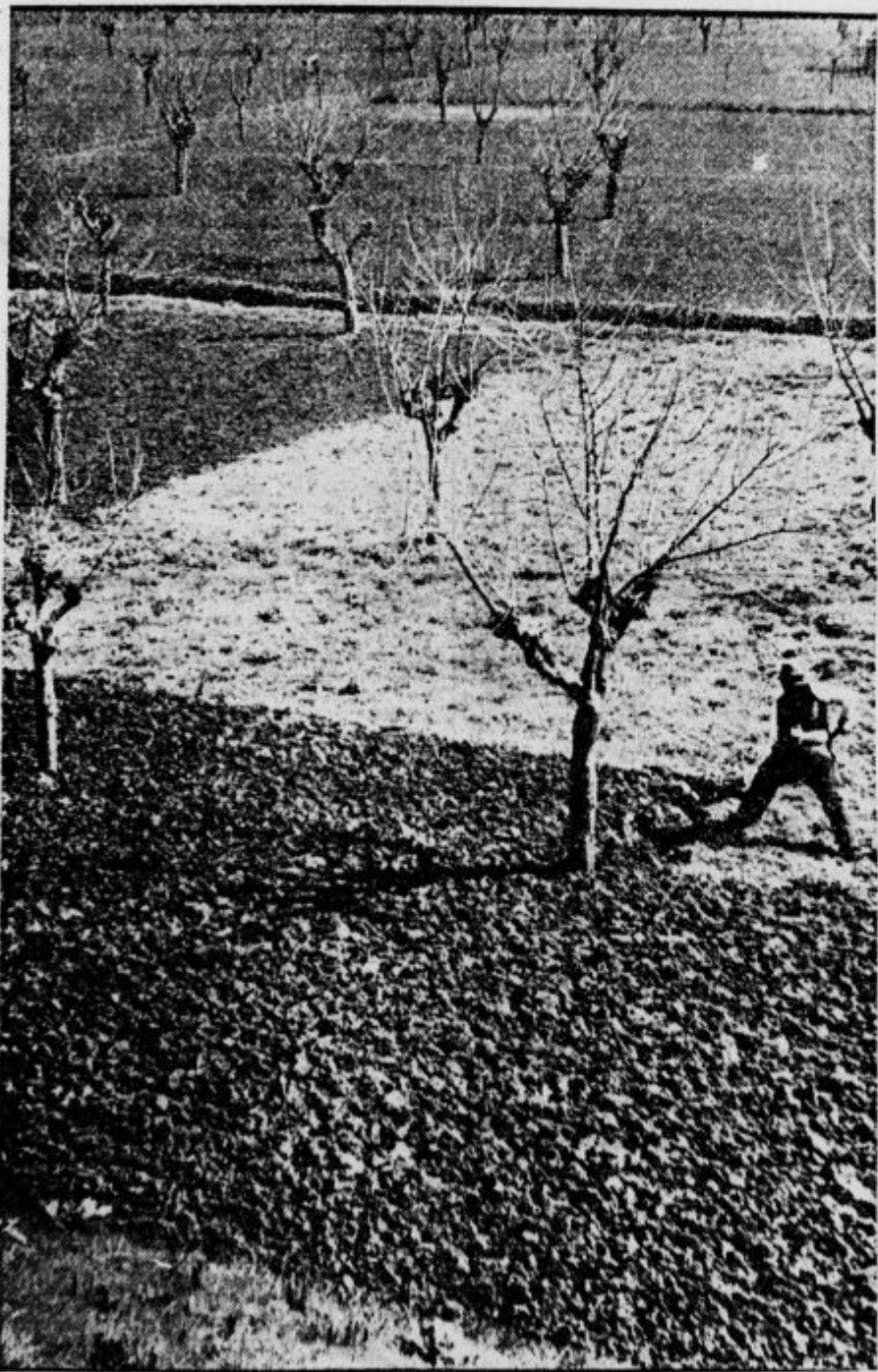
Zimsko delo v sadovnjaku, če ni snega!