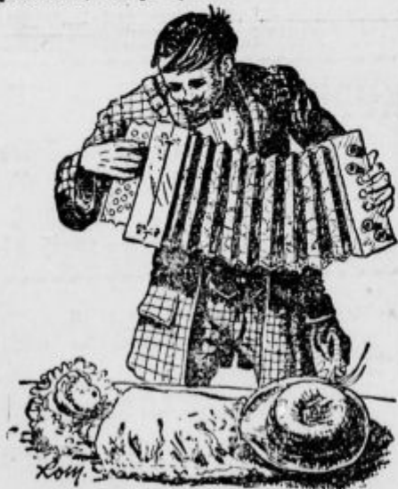
»Dobro je nastavlil...«

»Danes ponoči je bila tu mama in me je poljubila. Zakaj je zopet odšla?« »Pomiri se, Janezek,« ga je tolažila usmiljena sestra. »Samo sanjalo se ti je. Prihodnji teden pride mama in te vzame s seboj domov.«