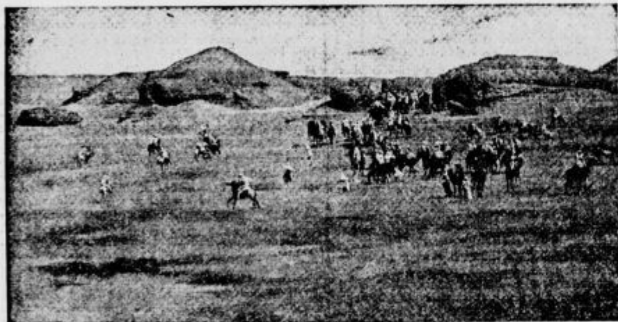
Marokanci napadajo v puščavi ameriško-angliško vojsko

Ob najsevernejši afriški točki so Francozi zgradili veliko vojno pristanišče Bizerto. V notranjosti leži mestec Kairnan, sveto domačinom in sedaj važno kot križišče karavanskih cest. Tunis in Bizerta z večjim ozemljem sta sedaj pod oblastjo italijansko-nemške vojske.