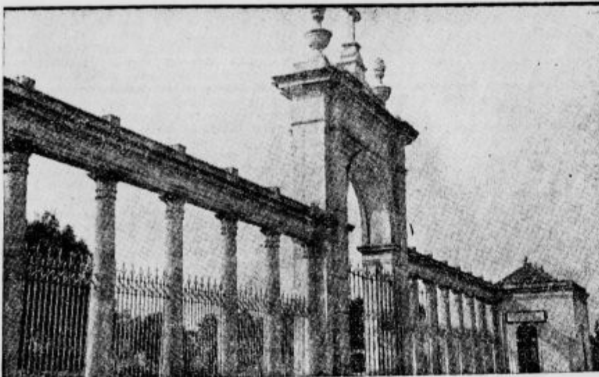
Vsa globel, kjer se je Marija prikazala, bo obzidana. Ob vhodu so velike in lepe kolone.