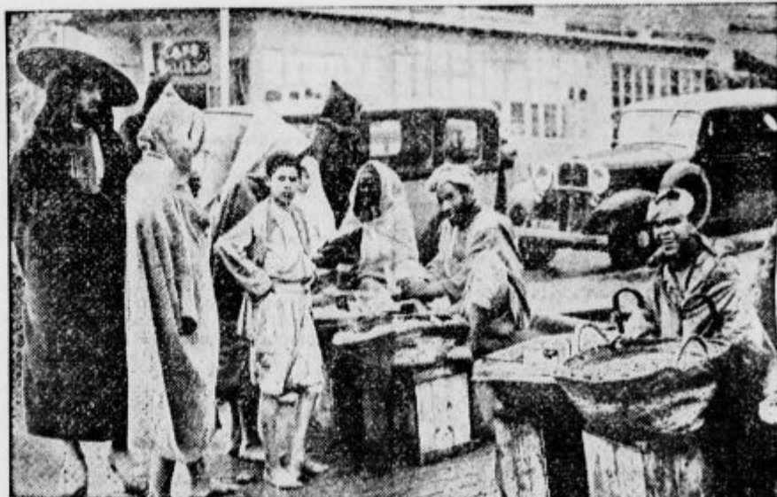
Na marokanskem trgu pozimi