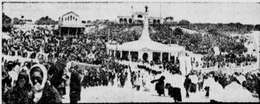
Slike iz Fatime: Procesije prihajajo ter polnijo ogromni prostor

Lurd in Fatima nas vabita k molitvi in pokori. Vrzimo od sebe grešno navlako in vrtno se k Bogu z otroško zaupnostjo in ljubeznijo! Hodimo vztrajno po poti, po katerem nas vodi Srce nebeške Matere!