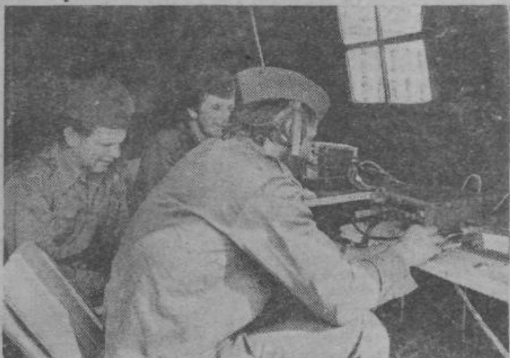
Dobre zveze so omogočale učinkovito usklajevanje akcije v Ljubljani. Na sliki je del enote za vojno-upravne zveze naše občinske skupščine

Krajevne skupnosti so izvajale načrtovane naloge po svojih operativnih načrtih v skladu z občinskim izvedbenim načrtom ter ukrepe civilne zaščite v povezavi z ozidi in hišnimi sveti. Enote in štabi CZ v KS so opravljali naloge po svojih načrtih in v skladu z ukazi občinskega štaba CZ. Omogočili so organiziran nastop in delovanje enot CZ, ki so prišle na pomoč pri reševanju ljudi in materialnih dobrin ter zagotovili potrebno število markirantov. Organizirale so občane za evakuacijo v hipna naselja