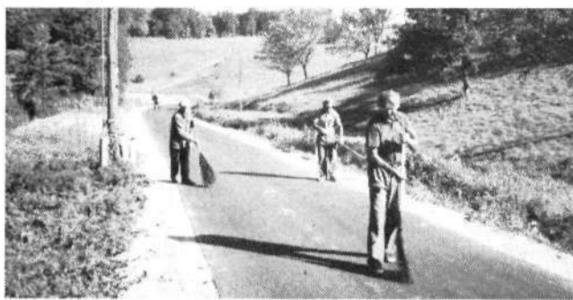
Zadnja dela domačinov pred uradno otvoritvijo.