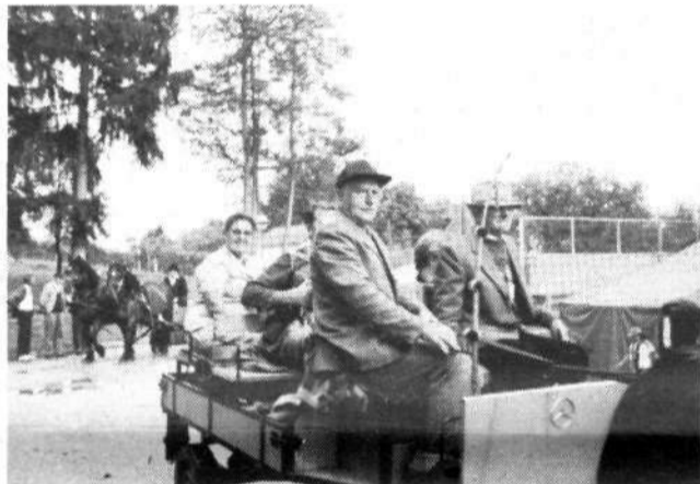
Namesto pohoda od hrama do hrama, ki ga je preprečil dež, so si Bizeljanci (med njimi je veliko konjarjev) omislili sprehod z zapravljičkami.