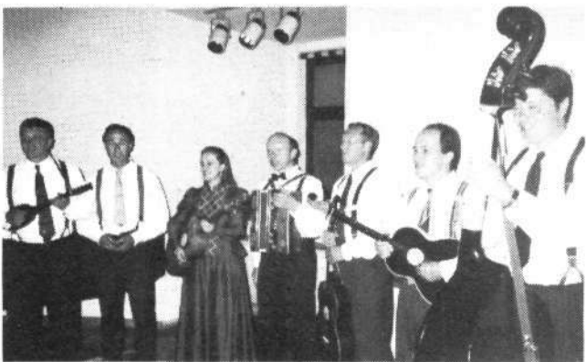
Otvoritev razstave o skavtih in gozdovnikih so s svojim nastopom popestrili Prifarski muzikantje s Kostelskega.