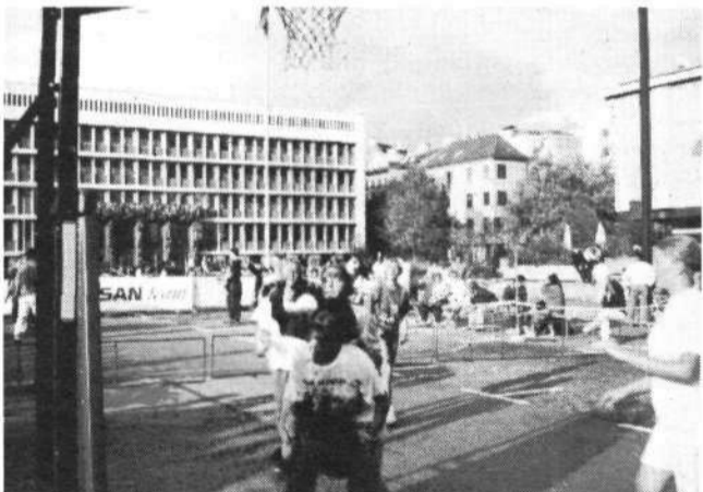
Na turnirju pred slovenskim parlamentom so nastopile tudi ženske ekipe.

Družabno srečanje nastopajočih, gostov in obiskovalcev se bo začelo že ob 12. pri osnovni šoli, za dobro razpoloženje pa bo igral in prepeval ansambel Ptujskih 5. (dama)