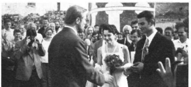
Mladoporočencema ki sta se v soboto poročila v nekdanji samostanski cerkvi, je SKD čestitala in podarila zibko z željo, da bo večkrat polna.