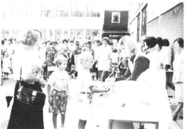
V dvorišču osnovne šole so se zbrali mladi nadobudneži, skupaj s svojimi starši. Majica v razrednih barvah za vsakega prvošolca.

Prvi dan šole, ko so nas vsi opozarjali na to, da lahko v prometu ogrozimo naše najmlajše državljane, je že mimo. Nevarnost je ostala, saj se otroci prav vsak dan — skozi vse leto odpravljajo iz šole — v šolo s polnimi glavami različnih misli, ki nikakor niso namenjene prometu! Pazite nanje vi!