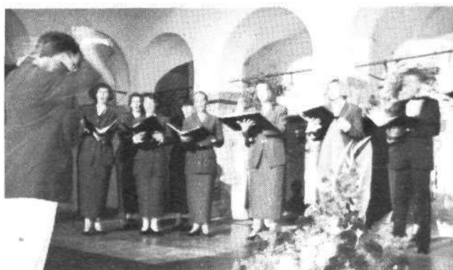
Komorni zbor Ave