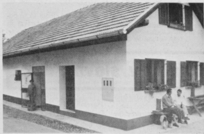
V novem diskontu so na prodaj brezalkoholne in alkoholne pijače. (M. Ozmeč)