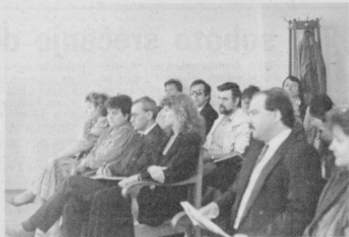
V sodni dvorani je bila precejšnja gneča.