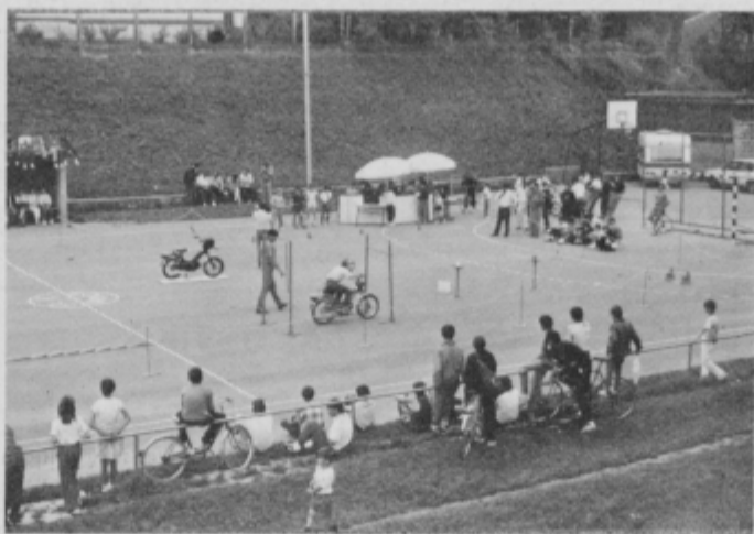
Spretnostna vožnja v Mestni grabi.