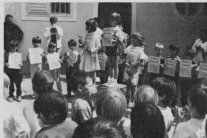
Najboljši malčki v ekipni konkurenci posameznih enot VVZ Ptuj...