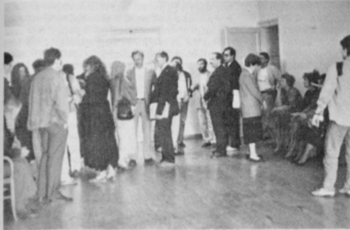
Razporeženje pred sojenjem.

javnega obveščanja sta izvedela, da zato, ker korektnije pišeta o Perutnini, čeprav sta podpisala sporno izjavo za javnost. Pri pomnimo še, da večina obtoženih o Perutnini nikoli ni pisala. Obema neobtoženima je težje bi-