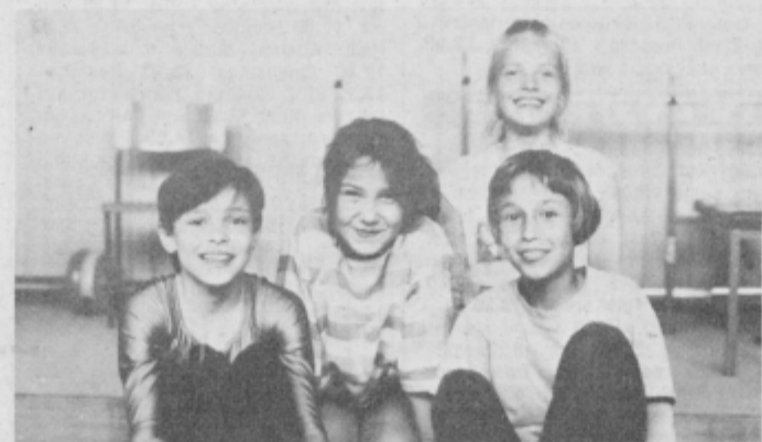
»Najboljše smo,« pravijo dekleta.