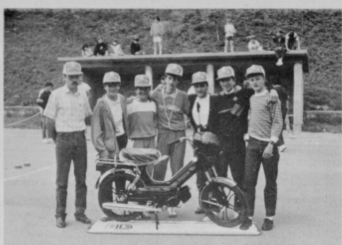
Zmagovalna ekipa OŠ Središče ob Dravi.