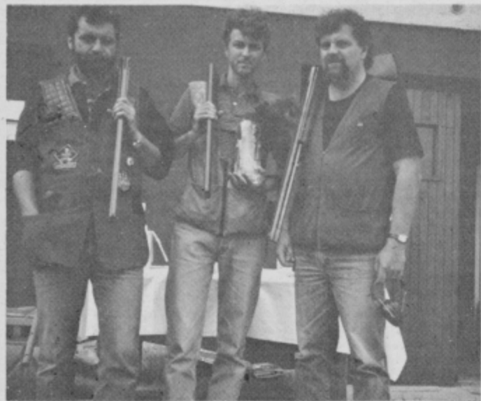
Nepopolna zmagovalna ekipa LD Zec iz Vrtišinca.

Že v soboto, 26. maja, je bilo izvedeno tekmovanje posameznikov — članov lovskih družin iz občine Ormož za pokal krajevne skupnosti Velika Nedelja. Med