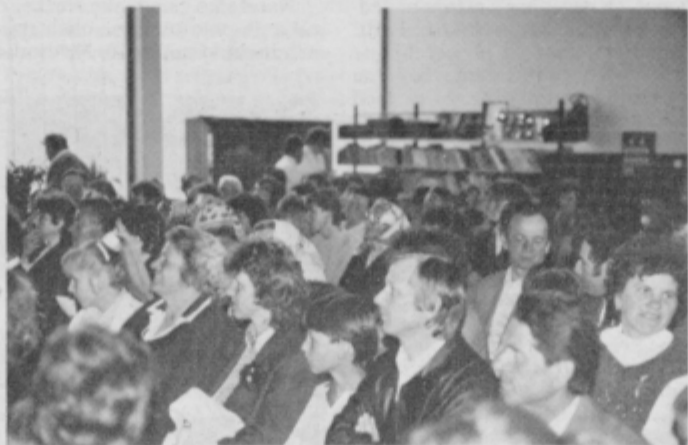
Publika z zanimanjem poslušala ljudske pevce in godce.

med prijavljenimi je nastopilo 15 skupin, od tega enajst iz občine Slovenska Bistrica in štiri iz drugih občin Podravja. Nastopili so ljudski pevci in godci s Šmartna na Pohorju, iz Slovenske Bistrice, Zabovca pri Ptuju, Tinja, z Zgornje Polskave, Gradišča na Kozjaku, iz Kovače vasi, Makol, Impola, Bučkovec, venčeselske ljudske pevke z Zgornje Loznice ter frajhajmska godba na pihala.