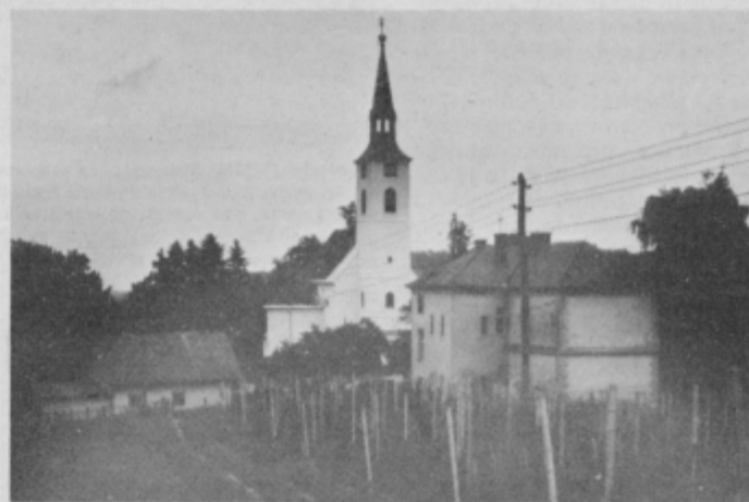
Obnovljena cerkev v Zavrču, v ospredju šola.

skave pitne vode na tem področju kažejo oporečnost v nekaterih obdobjih in da bo napisala posebno poročilo o vodah v Zavrču in okolici, kar naj bi pripomoglo h gradnji vodovoda v okolici te