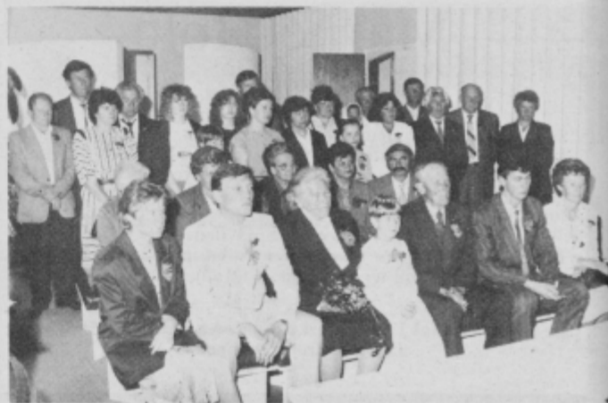
Zlatoporočenca ob slovesnosti v poročni dvorani matičnega urada v Ptujju.