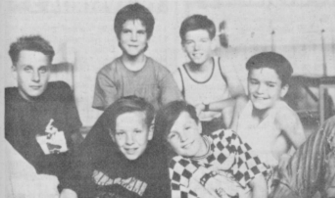
Takole so se fantje postavili pred objektiv.

vaje je bilo dobro. Treniramo trikrat na teden in treningi ni ne delajo težav.«