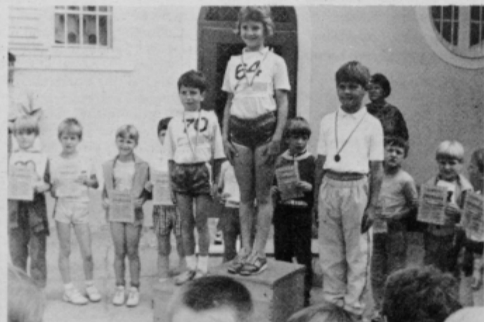
... in najboljši posamezniki, med njimi prvič na najvišjem mestu deklica.

NK Gorišnica prireja 15. in 16. junija 1990 VELIKI NOČNI TURNIR V MALEM NOGOMETU