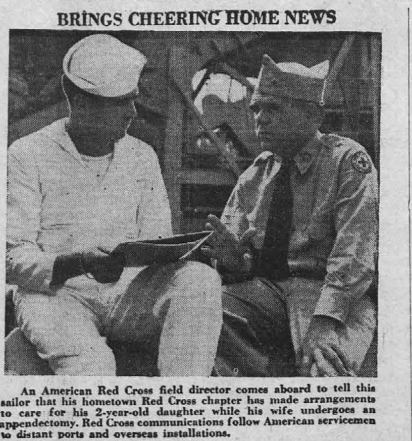
An American Red Cross field director comes aboard to tell this sailor that his hometown Red Cross chapter has made arrangements to care for his 2-year-old daughter while his wife undergoes an appendectomy. Red Cross communications follow American servicemen to distant ports and overseas installations.

Aksinja je dvignila roke z objokanega obraza. — Jaz sem prišla po svet . . .