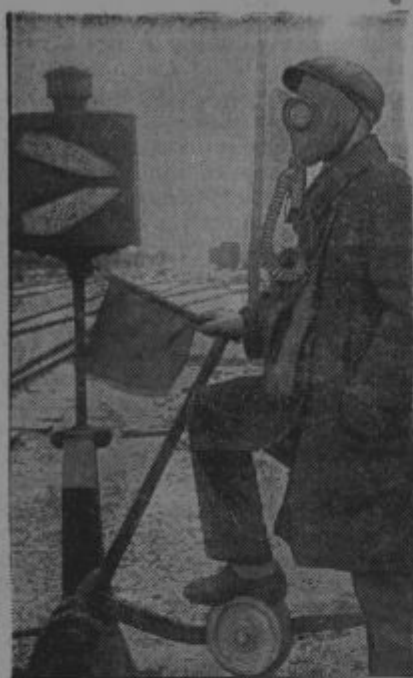
Železničar med plinskim napadom

s poučevanjem, z medsebojnim vzgajanjem pripomoči do večje veljave nad onimi socialno negativnimi, kakor so sebičnost, zavist, hinavščina i. t. d. Pozitivne lastnosti je treba ustvariti, slabe dušiti, kar je tudi pozitivno delo. V splošnem je treba to, kar je človeku in sočloveku v prid, pridobivati s trudom. Vsakdanja izkušnja nas uči, da