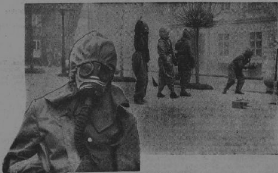
Življenje na ulici po plinskem napadu

Po vseh takih in enakih razmotrivanjih pridemo do zaključka, da je boj nekaj človeku imanentnega in, dokler bo človek, bo tudi boj. Ne tolažimo se, da bo čez milijon let boljše; približno desetisočletna kulturna tradicija nam kaže pot. Vendar do takega pesimisma se ne bomo povzpeli, kakor se je Merežkovski, ki trdi, da bo bodoča vojna zadnja in to zaradi tega, ker bo človeštvo kratkomašo iztrebljeno. Ponovna vojna bo šele mogoča, če bi se na zemlji zopet pojavil človeški rod. Pripoveduje, da bo spričo vseh isnajdb, kakor so kemični strupi, elektromagnetični valovi (smrtni žarki?),