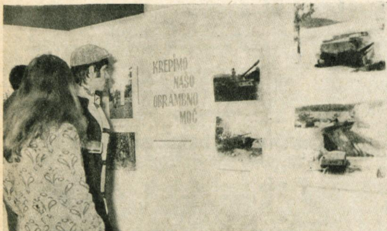
Krepimo našo obrambno moč!