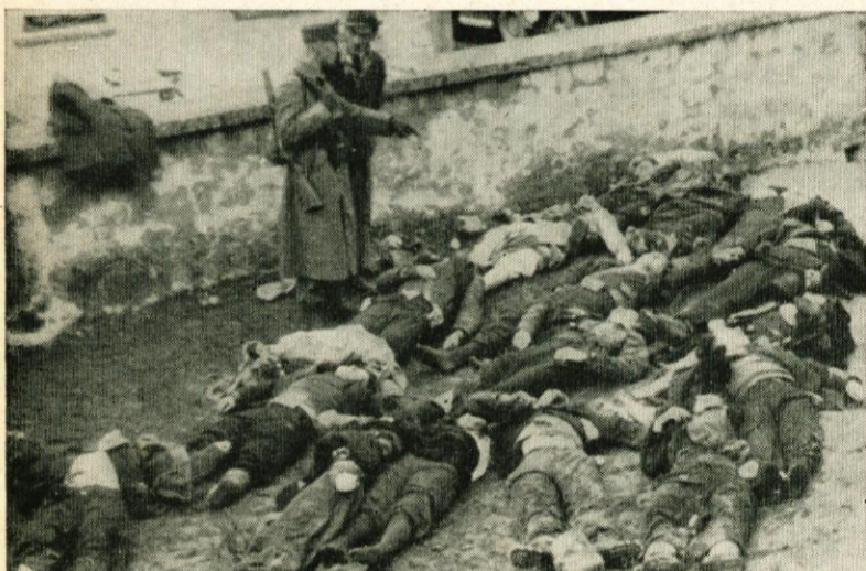
Padli na Kostanjski planini

Tam nobenga krega ni, nobeniga šp'tira, gospod p'r pieklarju leži, nobieden n'č na zbira, naj bo berač al pa bahač, n'č drgač!