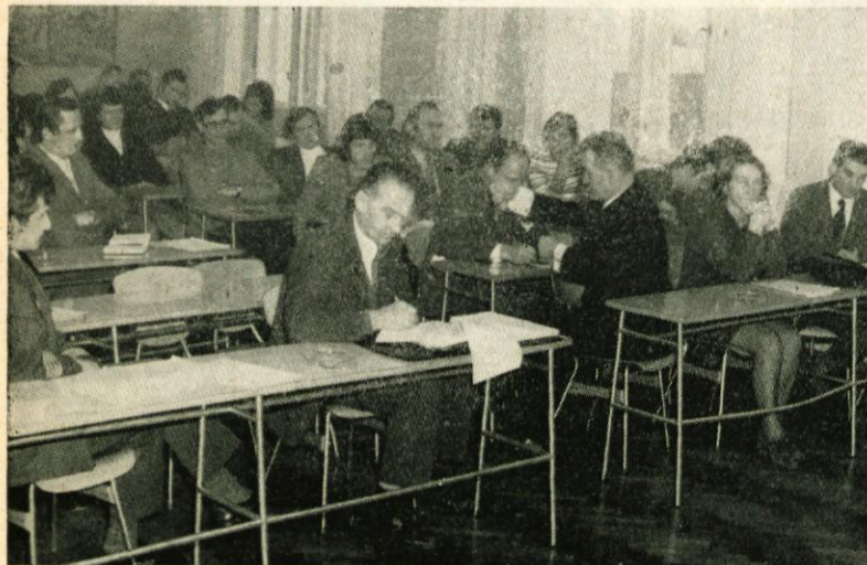
Pogovor z zdomci na skupščini občine Domžale, ki ga je organiziral Občinski sindikalni svet je zelo lepo uspel