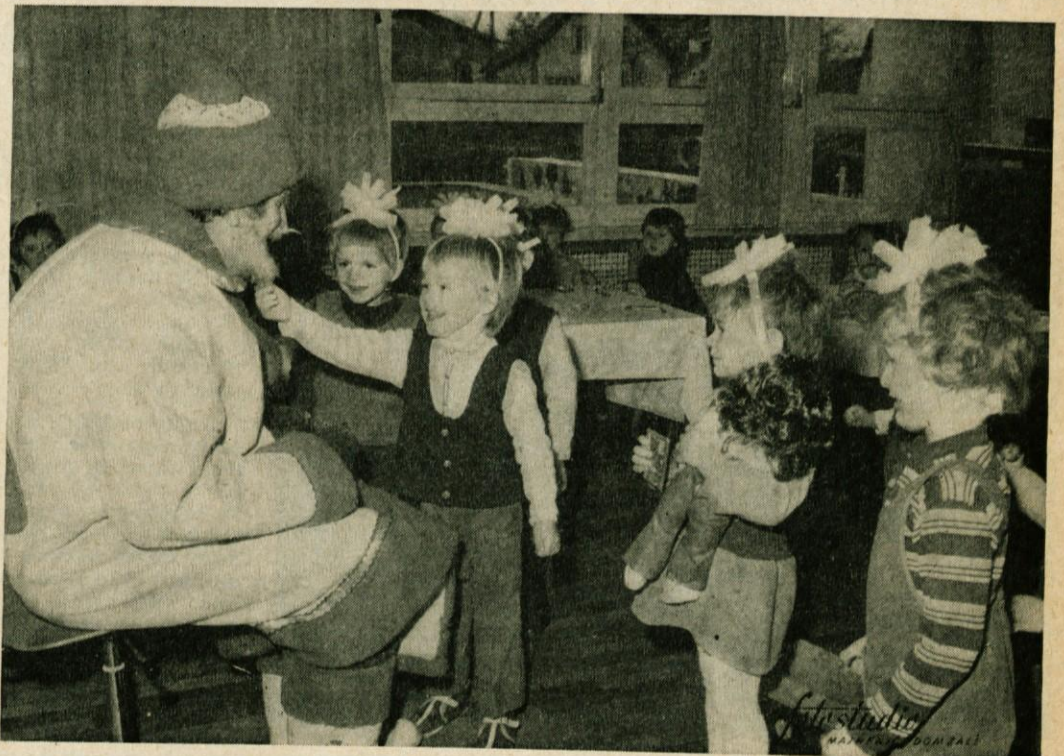
Dedek Mraz v domžalskem vrtcu

Vse občane vabimo na SLOVESNO OTVORITEV OSNOVNE ŠOLE ŠLANDROVE BRIGADE , ki bo na dan slovenskega kulturnega praznika, dne 8. Februarja 1973 ob 10. uri v Domžalah na Bistriški cesti.