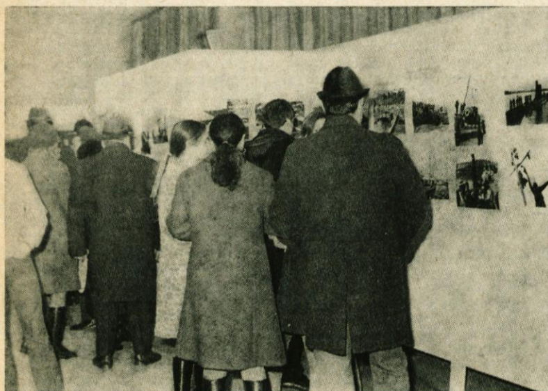
Razstava ob dnevu JLA je vzbudila veliko zanimanje obiskovalcev, posebno pa so se zanimali za slike na katerih je bila prikazana oborožitev naše armade in fotografije z vaje Pšata 72

Pismene prijave vložite do 31. januarja 1973 na Svet I. osnovne šole Domžale.