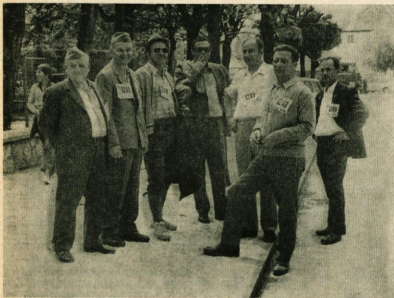
Pohod po poteh spominov in tovarištva v Ljubljani 6. maja 1972