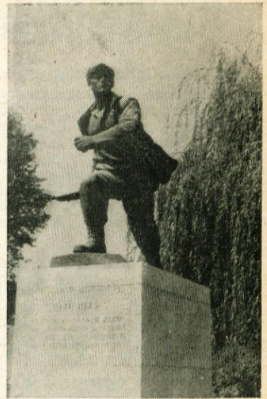
Spomenik NOB na trgu v Moravčah