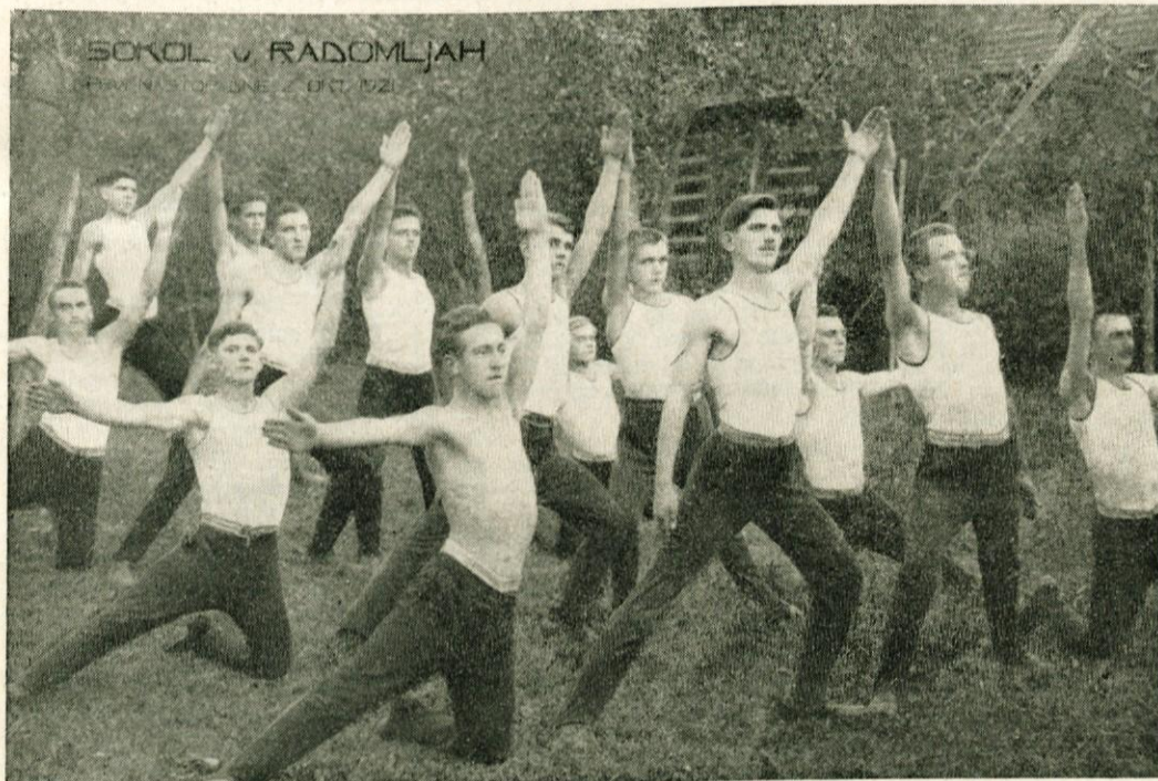
Prvi telovadni nastop v Radomljah, dne 1. oktobra 1921. (ne obstaja verjetnost, da je zgornja slika s tega nastopa)

še občine z letnico ustanovitve: Moravče 17. 7. 1921, Dob 26. 7. 1921, Mengeš 1922, Brdo 14. 8. 1921 (pozneje razpuščen 1927), Krašnja — odsek 1933, Blagovica in Trzin — sokolske čete 1931.