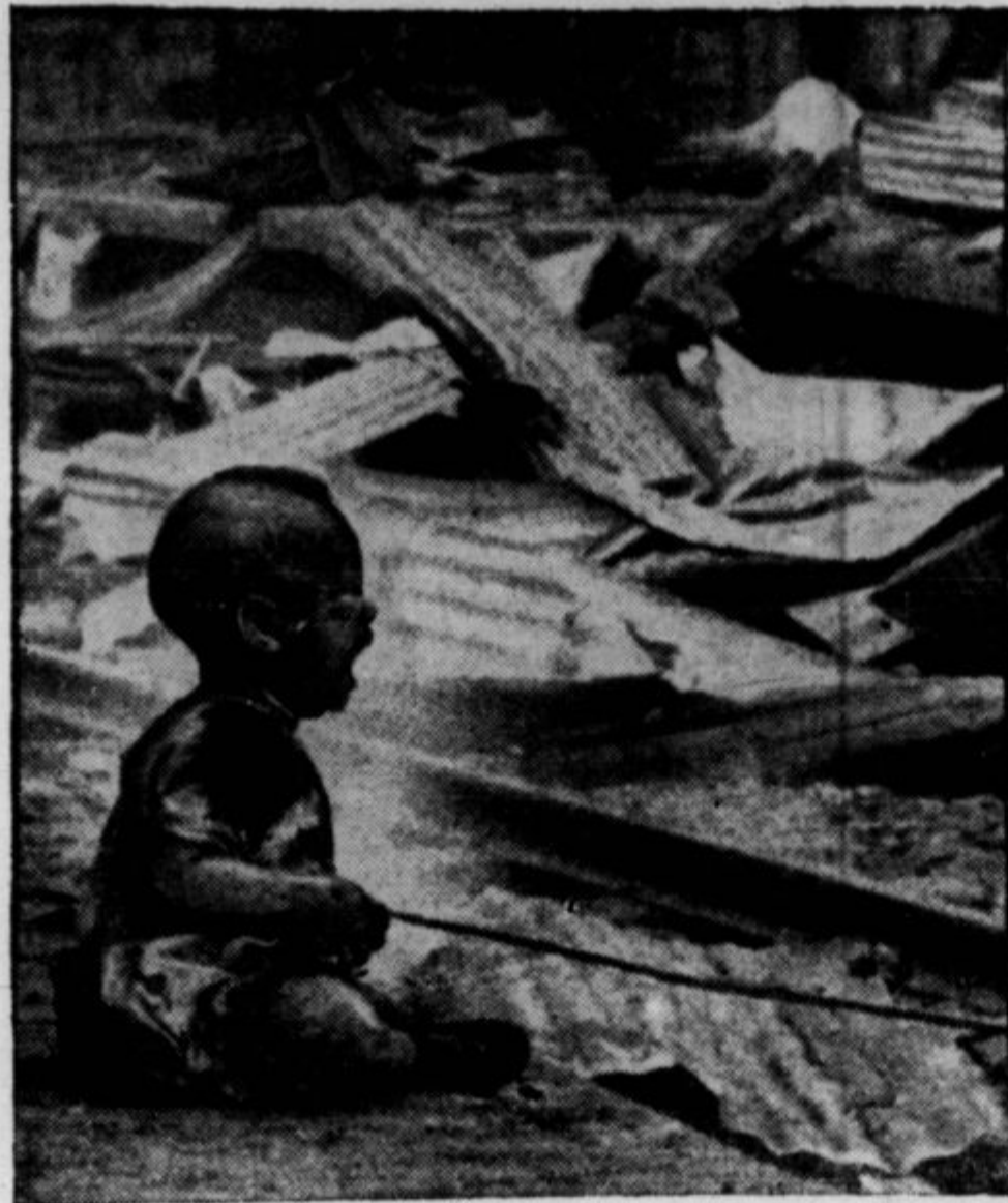
Japonski vojni aeroplani so bombardirali v sedanji "nenapovedani" vojni na Kitajskem že mnogo več pa so jih pobabili, ali pa ranili. Tisec hiš je razdejanih. Na sliki je deček, ki je ostal živ v podrtiji bombardirane hiše v Sanghaju. Starje je ubilo in njegov obupni jok ni prav nič pomagal.