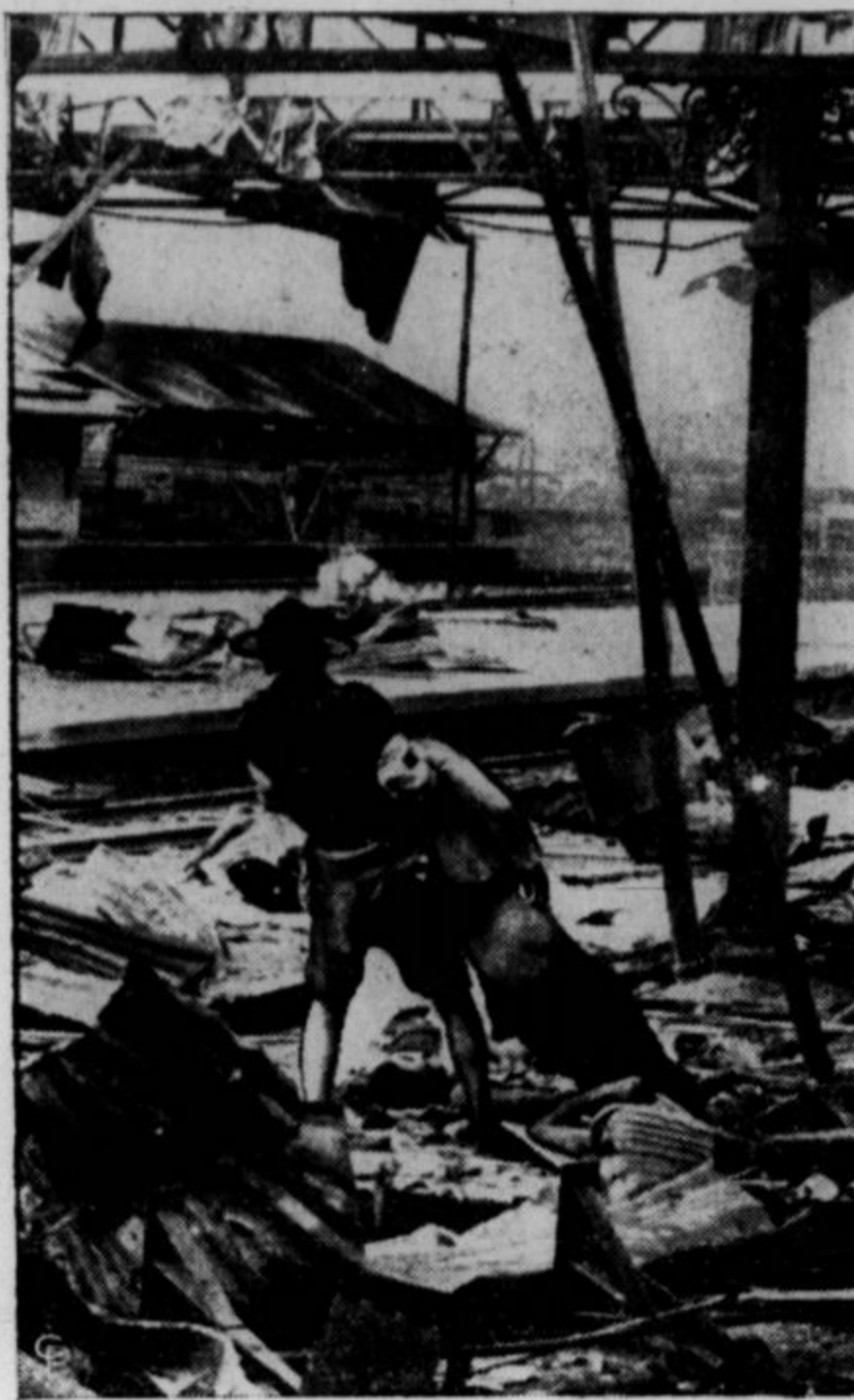
V Sanghaju so japonski vojni letalci z bombami iz aeroplanov porušili nešteto hiš. Na sliki je mlad rešitelj delavcev, ki vlačil mrtvece iz podrtij. Ker mnoga trupla niso bila dolgo pobrana, dalje vsled nezadostne hrane in pokvarjene pitne vode je nastala v Sanghaju tudi epidemija kolere. Zdravniki iz mnogih dežel se z vsemi napori bore, da ustavijo njeno razširjenje.