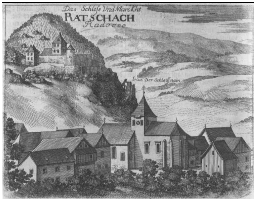
Radeče ob Savi (Valvasor, Janez Weichard: Die Ehre III, XI, str. 464).