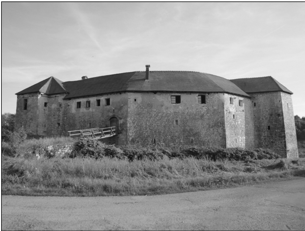
Grad Ribnik jeseni 2011, severna stran.

Štirideset let pred nastankom Karlovca je bila Metlika čez Kolpo najbližje večje mesto in skozi Ribnik je tekla pomembna prometna povezava, po kateri je teklo blago zahodno proti Metliki in naprej na Kranjsko, južno proti Senju in Reki ter severno proti Zagrebu. 48 Gotovo je videl trgovce in njihove tovore, ki so se ob določenih dnevih tudi ustavili v Ribniku ter ponudili svoje blago, ali zgoj potovali mimo, naprej na Metliško oziroma južno proti morju. Mesto Metliko je gotovo videl že kot mladostnik na katerem izmed devetih letnih sejmov, ki jih je mesto imelo, ali ob katerem romanju v tamkajšnji cerkev. Tedaj je bilo v Metliki, še bolj pa njenemu velikemu predmestju, več kot 100 naseljenih hiš, 49 tako da je bila Metlika skoraj trikrat večja od rojstnega Ribnika in bistveno bolj naseljena. Zdi se, da ga je ta obljudenost zaznamovala in spodbudila določeno afilicijo do Metlike, ki jo