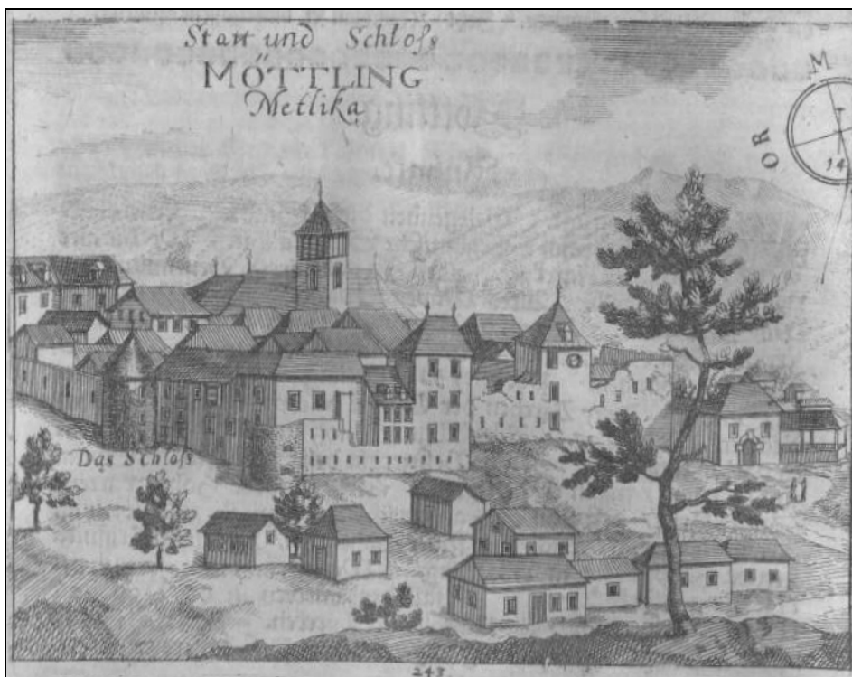
Metlika (Valvasor, Janez Weichard: Die Ehre III, XI, str. 384 ).