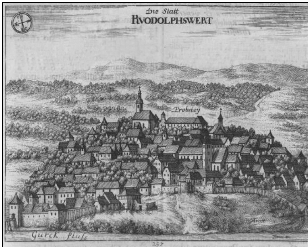
Novo mesto (Valvasor, Janez Weichard: Die Ebre III, XI, str. 481 ).