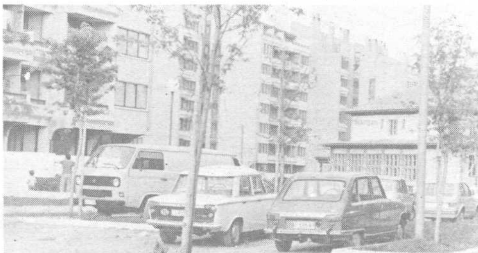
Trnovo raste. Upamo, da bo tako hitro zgrajen tudi vrtec.