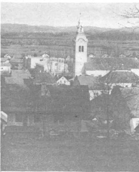
Studenec – Ig