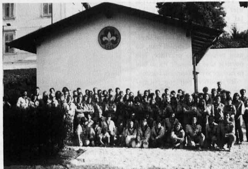
Spominska slika Slovenskih goriških skavtov, pred novim skavtskim sedežem

V okviru Koroških dnevov je na programu tudi srečanje predstavnikov kulturnih in političnih organizacij s Koroške in Primorske.