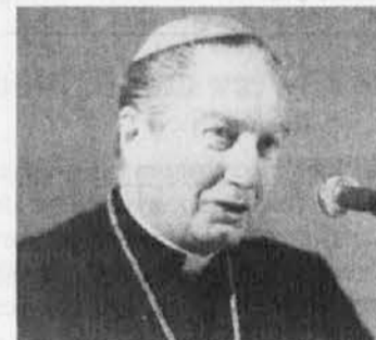
Kardinal C.M. Martini

Milanski kardinal Carlo Maria Martini je postal predmet strankarskih mahinacij. Izdal je namreč pastirsko pismo v zvezi s podkupovanjem ter izsiljevanjem, ki se je vgnezdilo v prakso italijanskih strank. Zavzel je svoje stališče kot dušni pastir in obsodil takšno početje, ki ni v soglasju s moralnim zadržanjem, ki bi moralo veljati tudi za politične ljudi. Nekateri pa so v njegovem pismu videli pristranost, češ da posredno zagovarja KD.