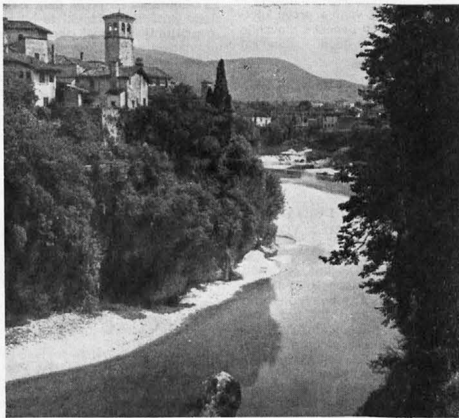
Pogled na Čedad, skozi katerega teče bistra Nadiža, v ozadju pa se dviguje močno Matajur. Največja čedadška privlačnost je longobardski Tempelj

Kakor vemo, zaradi neprestanega izseljevanja v tujino, lokalno gospodarstvo vidno hira in zato je treba prištevati gorske vasi Beneške Slovenije med najbolj revne doline dežele Furlanije-Julijske Benečije. Izdatna pomoč Dežele v raznih sektorjih gospodarstva Nadiške doline in predvsem v turizmu, domačem obrtništvu in kmetijstvu, kakor tudi v industriji, katero bo treba še ustvariti, bi mogla zaustaviti pešanje ekonomije in tudi znatno pripomoči k ekonomski in socialni obnovi ne samo Nadiške doline, ampak vsega ozemlja Beneške Slovenije.