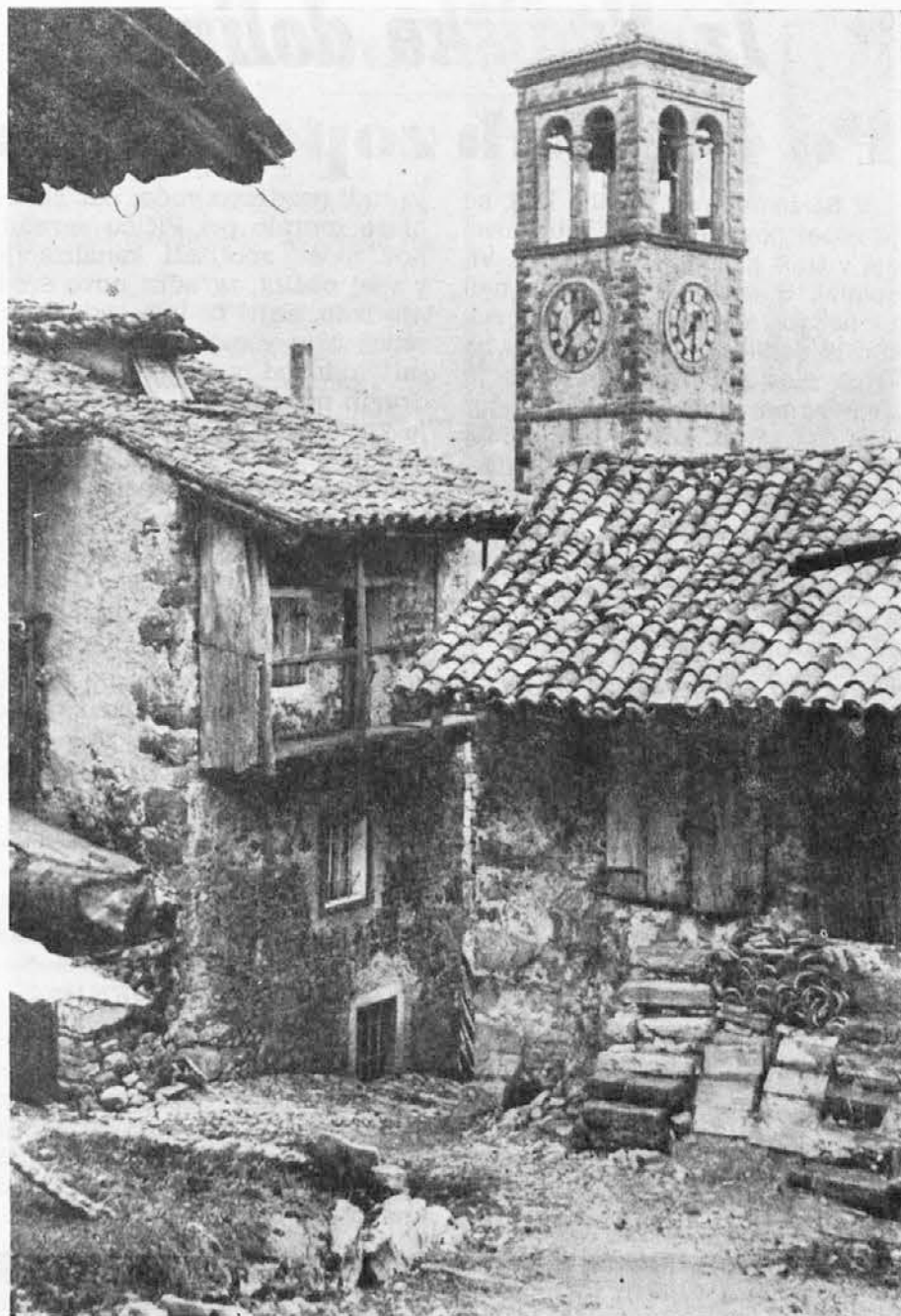
Prosnid v tipanski občini s svojim karakterističnim zvonikom poleg katerega stoji farna cerkev, ki je pa sedaj brez župnika. Vas leži tik ob italijansko-jugoslovanski meji, najbližji prehod čez mejo pa je pri Mostu čez Nadižo