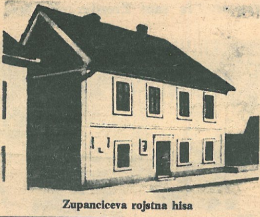
Zupanceva rojstna hisa

Otonu Župancicu je dalo pol stoletja ustvarjanja veljavo slovenskega javnega zivljenja. Posebno kritico je gledal na tedanje kulturno-politicne razmere. Kakor sam pravi, je bil tako poln strelce da so iz njega strlele kot jezu bodice. tudi zenskam ni prizanesel. Takole se je izrazil o zenski pameti: