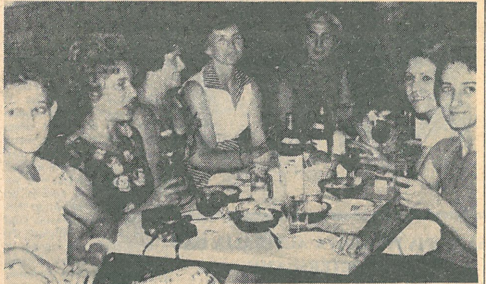
U petak uvece grupa devojaka nasih iseljenika iz Sidneja, odlucila je da izvede svoje majke na veceru. Nasa kamera ih je zatekla u veselom raspolozenju u restoranu "Plaza", koji drzi nas zemljak V. Perovic.