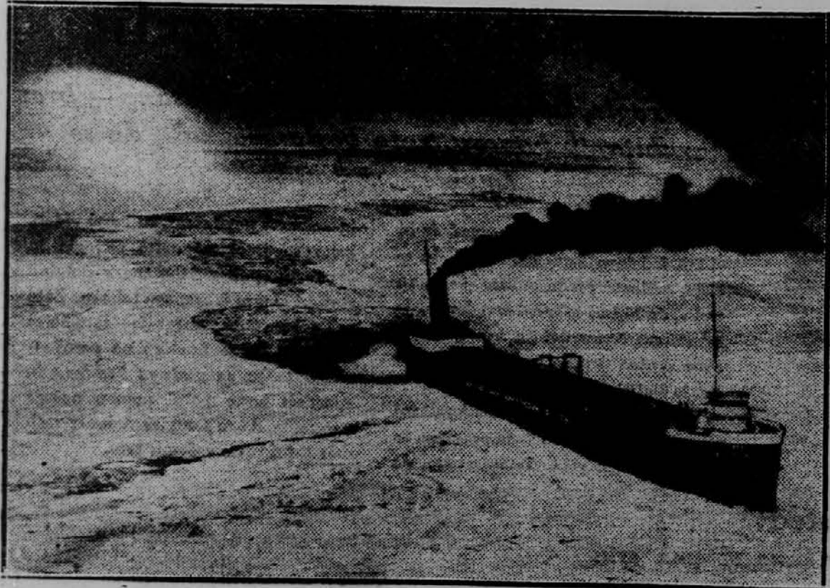
Na vožnji iz Detroita v Cleveland je običal na Erie jezera v ledu tovorni parnik "Crescent City". Po celo noč trajajočih naporih se je trem drugim parnikom posrečilo, da so ga spravili iz neprijetnega položaja.