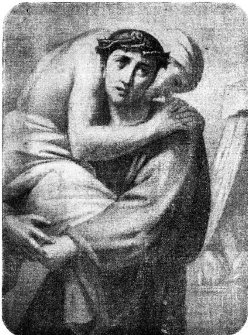
Sv. Janez od Boga (8. marca) — vzor krščanske dobrotelčnosti.

Sv. Ludovik, ponižni kralj francoški, je vsako soboto večjemu številu noge umival, jih brisal in poljubljal. Večkrat je siromakom pri mizi stregel. Vedno so jedli pri njegovi mizi stari revčki, ki jim je sam od svojih jedi delil. Tudi je v Parizu in