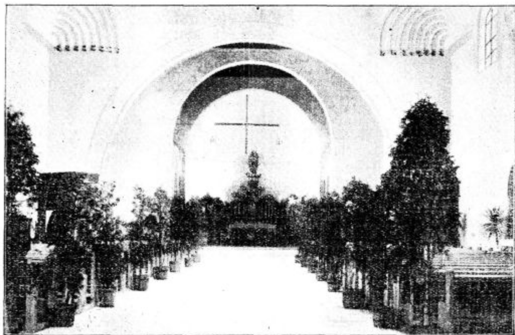
Cerkev sv. Jožefa v Ljubljani na dan posvetitve 19. marca 1922.

soseska ali večja vas eno). Naloga teh je prodajati Misijonski koledar, pobirati članarino za »Misijonsko mašno zvezo« in druge misijonske darove. Odsek je kupil v Jugoslovanski knjigovoznici 5 vezanih zapisnikov (435 K) po 100 listov. Zadostovalo bo vsaj za 20 let. Zapisniki so trdno vezani in imajo ob robu slovensko abecedo. Nabiralka ima v knjigi vse člane, jih lahko po abecedni razdelitvi hitro najde in tu ni treba drugega, kot dobljeni znesek vpisati v predalček za tisto leto. Ta način se je v Predosljih pri »Apostolstvu« sijajno obnesel.