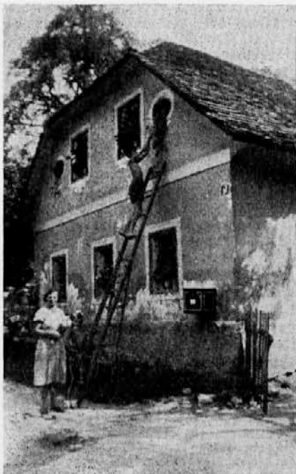
Friendly villagers adorn their humble homes with fragrant flowers.