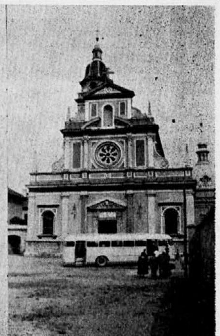
Mary—Help of Christians Church at Brezje—national shrine of Slovenia.