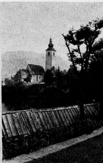
Ancient St. John's Church at Lake Bohinj.