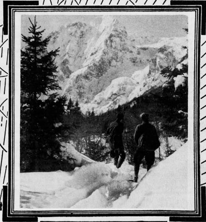
Winter Charm in the Julian Alps, Slovenia