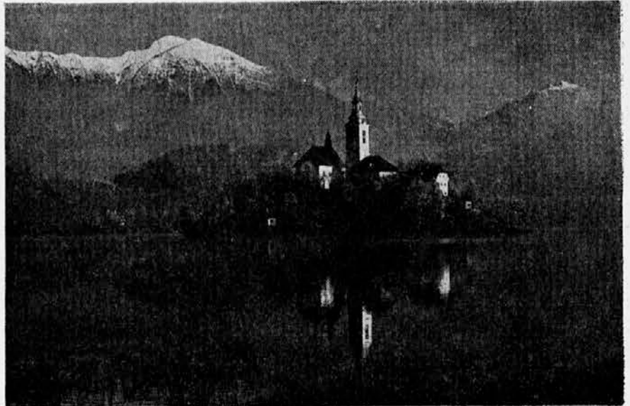
Picturesque island of Lake Bled—health resort and beauty spot of Slovenia.

lieved still to be under surface in Slovenia since history shows heavy Roman existence dwelt between the cities of Emona (Ljubljana) and Claudia Celea (Celje).