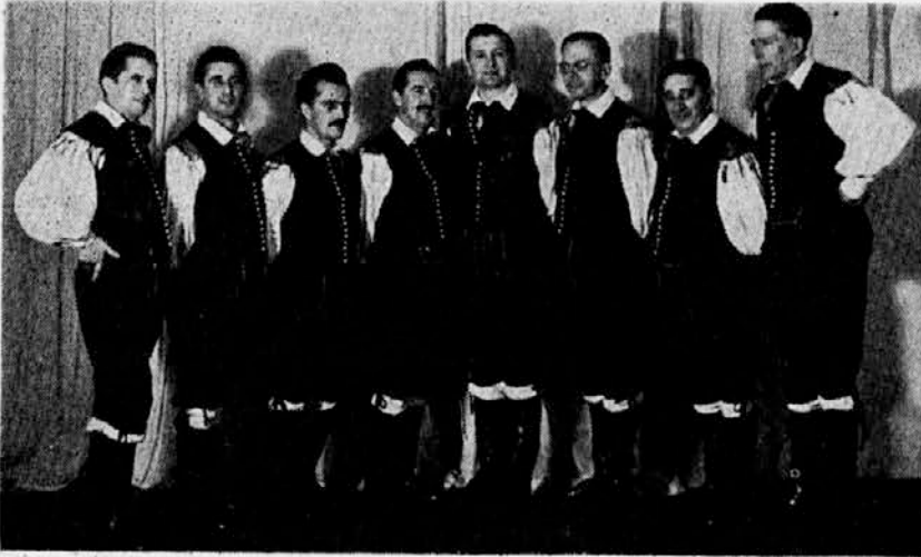
The distinguished Slovenian Male Octet of Ljubljana.

Honoring the visitors was the Slovenian Male Octet. This octet could rightly boast of being the finest of its kind anywhere in Europe. Their individual vocal qualities blended together in perfect oneness as these men interpreted Slovenia's folk songs. Their national songs displayed original harmonious arrangements which held the audience spellbound. The listeners' applause demanded repeated encores from such a rare combination of singers.