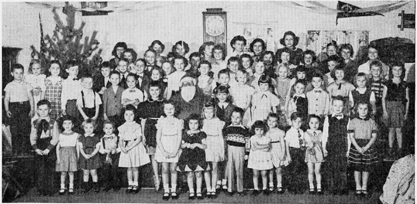
JUNIORS OF FOREST CITY, PENNA., SHOWN AT THEIR CHRISTMAS PARTY, HELD DECEMBER 13th, UNDER THE AUSPICES OF THE BRANCH 7, WHO BOAST 114 YOUNGSTERS! BEST WISHES FOR CONTINUED SUCCESS!