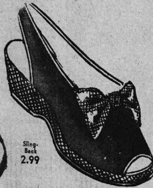
Sling- Back 2.99

Lepa izbira stilov! Izberite sedaj iz naše popolne zaloge