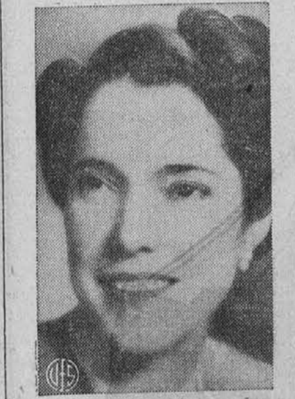
To je najnovejša slika mišne Mrs. Douglas MacArthur, soproge poveljnika ameriških čet v Južnem Pacifiku generala MacArthurja.

Toolmakers Radial Drill Press Turret Lathe operatorji Engine Lathe operatorji Nočno delo Visoka plača od ure in bonus za nočno delo The Yoder Company 5500 Walworth Ave. (2 cesti od Lorain & W. 53. St.) (263)