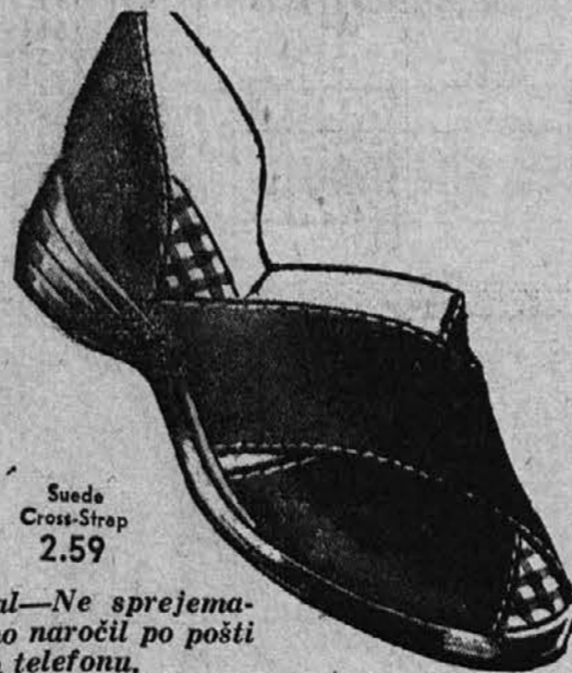
Suede Cross-Strap 2.59

Tudi drugi stili po cenah od 1.99 do 4.95.