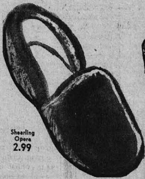
Shearling Opera 2.99