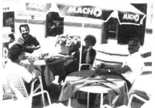
Takole je napetost manjša.