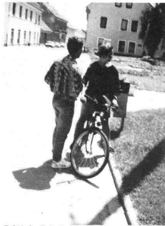
Poletje je, življenje teče dalje.