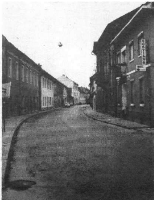
Krško po alarmu

Štab za civilno zaščito občine Krško ocenjuje, da je kljub težavam, s katerimi se srečuje, in kljub razmeram, ki nam vsem skupaj niso naklonjene, uspel (v skladu z možnostmi) dokaj učinkovito organizirati zaščitne ukrepe. Izvajanje zaščitnih ukrepov nas je doletelo v določenem stanju, ki smo ga skupaj pripravljali že dolga leta. Danes se je iz dosežene faze priprav treba nujno prilagoditi dejanskim razmeram in potrebam.