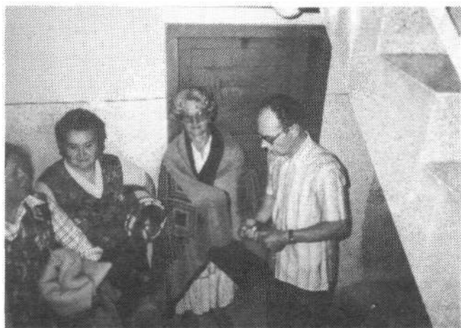
V kleti na Kolodvorski v nedeljo