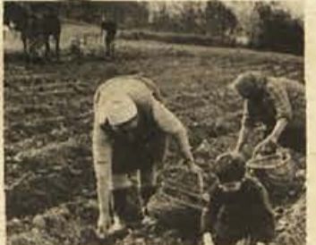
Namesto na dopust