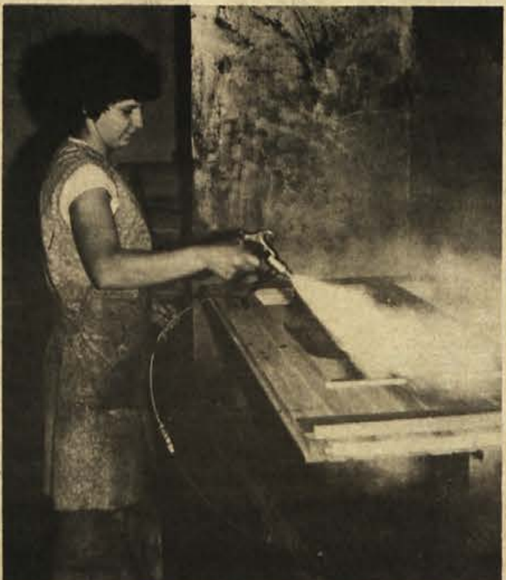
Zaposleni v INLESU se zavedajo, da niso le člani tega delovnega kolektiva, ampak tudi občani krajevne skupnosti, in da so zato dolžni prispevati tudi za reševanje zadev na območju, kjer stanujejo. Na sliki Lakimica INLES v Sodražici.