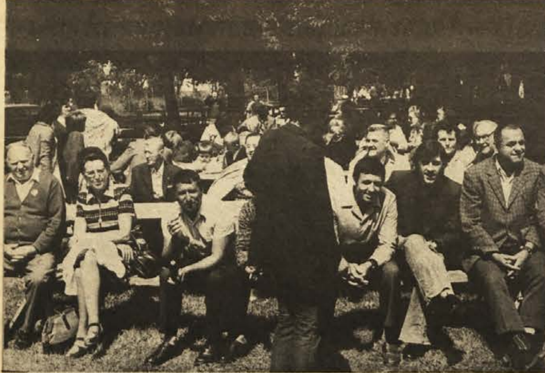
Občani pobratene krajevne skupnosti Poljane-Ljubljana so v Sodražici vedno dobrodošli. Na sliki je srečanje 7. julija letos.