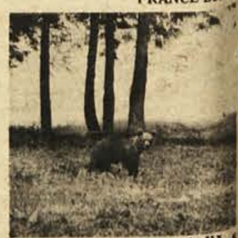
Lanskoletni medvedji mladič, katerim sva pila pivo. S svojimi vragolijami je medvedek zabaval številne obiskovalce kočje pri Jelenovem studencu.

metati kruh, čevapčiče, sadje in druge dobrote. Medvedek jih je pridno pobiral in jedel. Predsednik PD Kočevje Mitar je prinesel kos kruha, namazan z marmelado, in medvedek mu je sledil kot polizan damski kužek vse do avtomobilov. Ko si je kosmatinec napolnil želodec, je verjetno postal žejan. Prišel je k meni, ker sem imel v rokah steklenico piva. S tacami ni mogel prijeto za steklenico, zato sem mu pivo natočil v krožnik. Popil je dve steklenici. Potem je šel za kočjo in malo zaspal. Ko se je prebudil, smo mu dali še celo štruko kruha in kosmatinec je veselo odhlačil v gozd. FRANCE BRUS