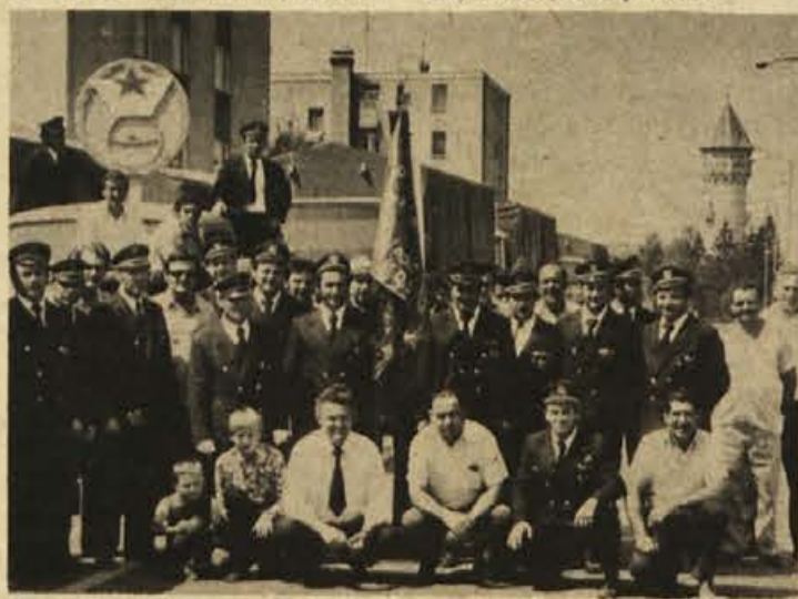
Združenje šoferjev in avtomehaniĉev iz Krškega je slovesno počastilo svoj praznik - 13. julij. Z okrašenimi vozili so člani obvozili Senovo, Krško in Brežice, od koder je tudi tale posnetek.

Plavalci Celulozarja so na tekmovalju za republiški pokal dosegli lepe rezultate. V prvem kolu so bili mlajši pionirji A skupine prvi, C skupina je bila druga, starejši in mlajši iz skupine B pa četrta.