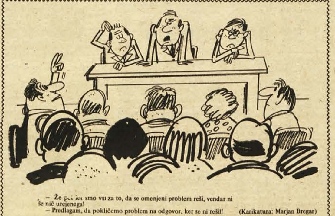
— Ze pa iet smo vsi za to, da se omenjeni problem reši, vendar ni še nič urejenega! — Predlagam, da pokličemo problem na odgovor, ker se ni rešil! (Karikatura: Marjan Bregar)

Zares je nelogično, da zmečemo toliko prepotrebne denarja za najrazličnejše vrste vozil – imamo namreč tudi množico predstavništva in konsignacij – pri tem pa capljamo daleč za Evropo, ker delamo in uvažamo zvečine velike ali srednje avtomobile, majhnih, kakršna sta recimo fiata 126 ali 127, ki sta tudi sorazmerno poceni, pa nimamo.