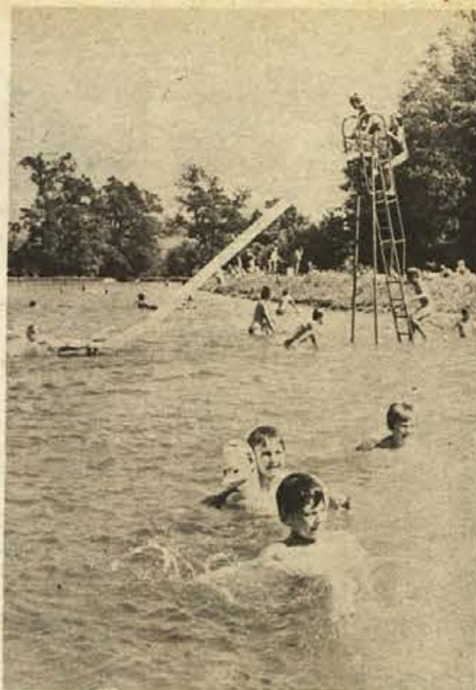
Predvsem ob sobotah in nedeljah je v miremskem bazenu izredno živahno, saj pride ponavadi več kot petsto gostov, ki jih privabita lepa narava in urejeno kopalnišče. Na sliki: stalni gostje miremskega bazena so otroci, ki se v prijetni vodi namakajo po cele ure.