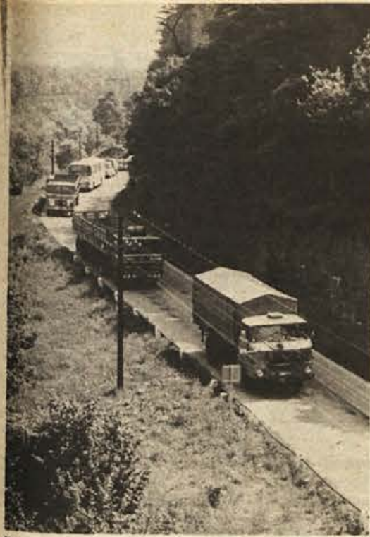
Člani društva šoferjev in avtomobilistikov iz Brežic so v soboto slavili spomin na prvo akcijo partizanskih motoriziranih enot v Sloveniji. Z več kot sto vozili so v koloni krenili iz Brežic proti Krske- mu in nazaj. Popoldne so preživeli na Gorah.