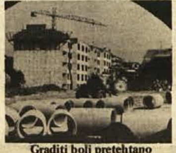
Graditi bolj pretehtano

Videti je, da bomo odslej v organizirani, družbeni gradnji gradili več stanovanj, kot smo jih v zadnjih letih. Gradbinci si želijo v takšni gradnji čim večje površine in čim večje število stanovanj osredotočenih v samostojnih soseskah. To omogoča boljšo organizacijo dela in vpliva tudi na pocenitev stroškov.