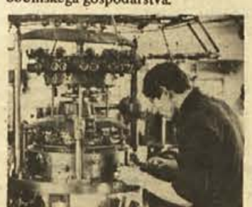
Če je BETI na zeleni veji, se vsej metliški občini pozna

Za osem večjih kolektivov metliške občine je v letošnjem letu značilno to, da imajo za polovico več realizacije kot v tem času lani. In ta uspeh so dosegli z mnogo manjšimi stroški in z boljšo organizacijo dela ter z večjo produktivnostjo. Predvsem velja to za BETI, saj predstavlja ta kolektiv nad polovico vsega občinskega gospodarstva.