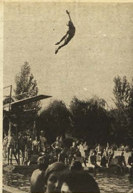
V nedeljo popoldan so se v Dolenjskih Toplicah pomerili slovenski in hrvaški skakalci v vodo za pokal Keber-Hosta. S tem so počastili spomin dveh najboljših slovenskih skakalcev, ki sta se smrtni ponesrečila v prometni nesreči.