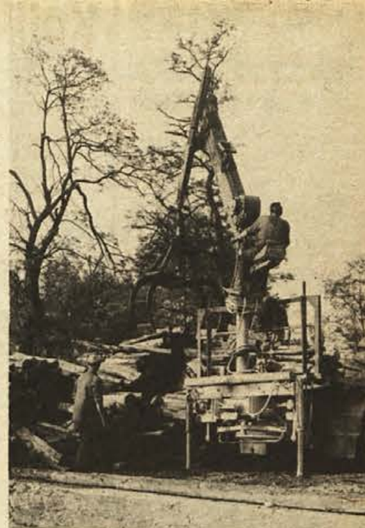
Vreme je kot pripravljeno za kopanje, toda nekateri že mislijo na zimo in skrbijo za drva, ki so se od lani podražila. V skladišču lesa KGP Snežnik v Kočevju naložijo na vagono poleg drugega tudi kakih 60 m 3 drv, ki so v glavnem namenjena izvozu.

VODA V TETRAPAKU Čiste higienske vode še ni na mnogih železniških postajah, bencinskih črpalkah, na športnih igriščih in drugih javnih mestih. To pomanjkljivost je sklenil odpraviti kolektiv lozniške VSKOZE, ki bo začel dati na jugoslovanski trg pristno svežo in zdravo domačo vodo v tetrapaku oziroma v plastičnih ovitkih. Taka voda bo uporabna mesec dni. Pravijo, da bo cena dokaj nizka in voda zajamčeno zdrava.