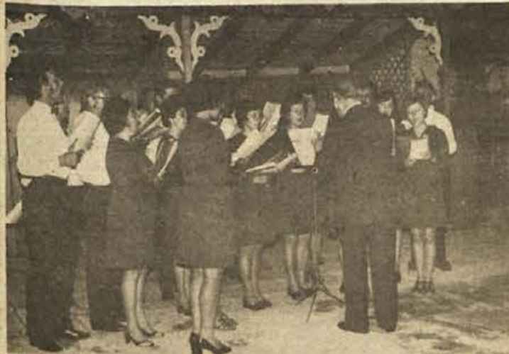
Na sliki: pevci slovenskega pevskega zbora Zvon.