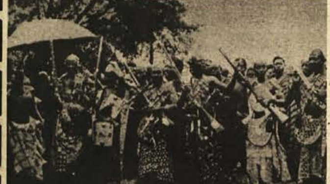
Vtikanje v prastare plemenske običaje ganskih domorodcev pomeni največje bogokletstvo, ki so ga plemena pripravljena kaznovati tudi z orožjem v rokah.

Se bi lahko naštevati razne oblike vraževerstva, kajti plemenski običaji so ponekod v Gani največja svetost. Nihče se ne sme vtikati vanje, ker bi to pomenilo največje bogokletstvo. Vdanost tradiciji in prastarim, pogosto nesmiselnim običajem je tako živa v ljudeh, da se nobena dosežanja vlada v Gani ni upala izvesti kakšne temeljne spremembe na tem področju. Vsi poskusi v tej smeri, tudi reforme sedanje vlade polkovnika Ačemponga, naletijo na velik odpor, predvsem po vaseh, kjer je praznoverje očitno močnejše od razuma.