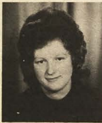
Ob tragični smrti naše ljube hčerke, 17-letne