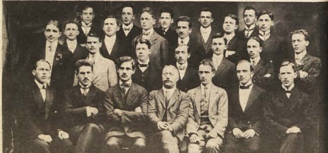
Fotografija, stara 60 let: gimnazijci, ki so 10. julija 1914 maturirali v Novem mestu (v sredini njihov razrednik)