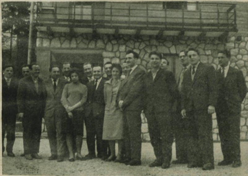
Predsedniki krajevnih organizacij SZDL ob zaključku dvodnevnega seminarja na Kopiščih

Verjetno je, da nikoli ni bilo tako resnih in tako temeljitih priprav za družbeni plan, kot v letu 1962. Namreč, že v lanskem letu in v začetku letošnjega leta se je prestopilo k pripravam plana Občinskega ljudskega odbora z raznimi posvetovanji in razgovori.