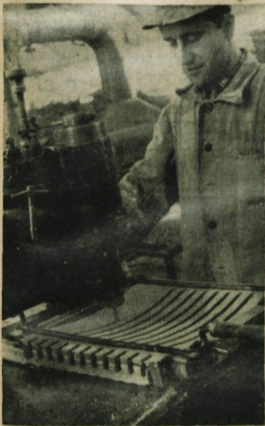
Proizvodnja Rex foteljev, ki so n ajbolj iskan izdelek »Stola« na domačem in tujem tržišču

Verjetno postaja vprašanje, ki so ga načeli člani te sindikalne podružnice na občnem zboru, čedalje bolj aktualno tudi v ostalih delovnih kolektivih. Gre namreč za pojav, ki kaže, da so samoupravni organi in vodstva ekonomskih enot v vse večjem prizadevanju za čimvečji ekonomski bčinek svoje enote ponekod začeli