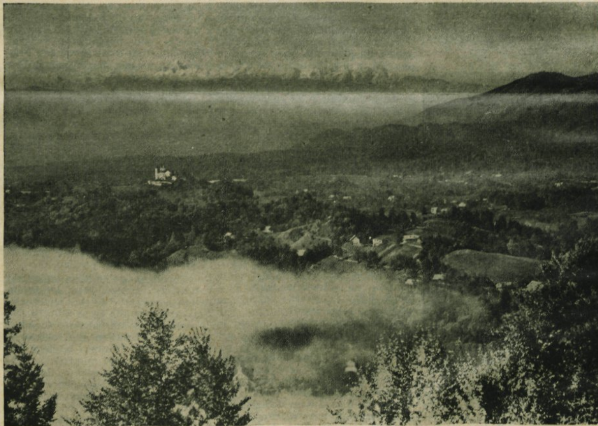
TD Kamnik je izdalo nove razglednice. Na naši: pogled s Starega gradu. V ozadju je Triglav