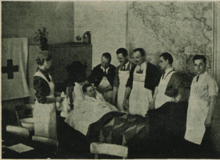
Nega bolnika na domu

ke. Mladince bosta oba kluba sprejemala še v maju.