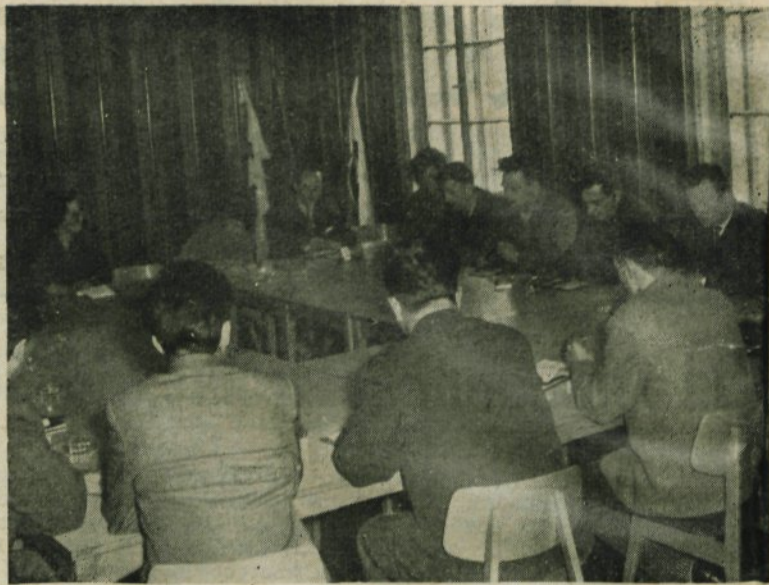
Seja občinskega komiteja ZK 13. in 14. aprila