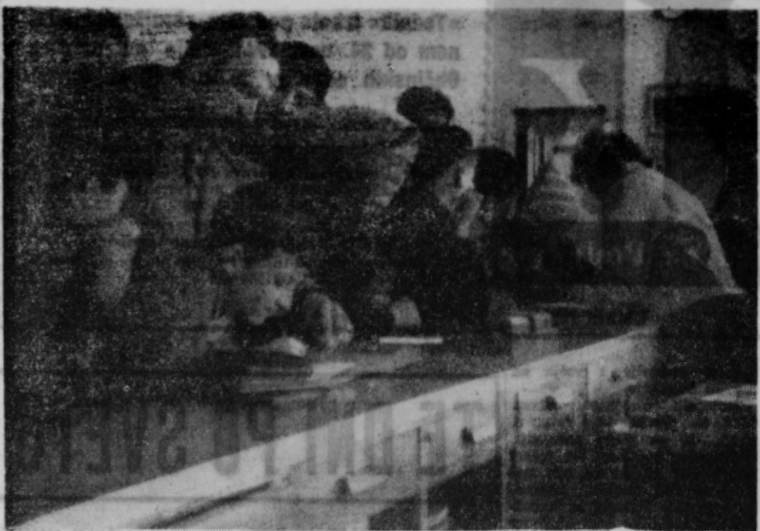
Nagrajeni otroci pri podpisovanju vložnih knjizic pri Komunalni ba nki