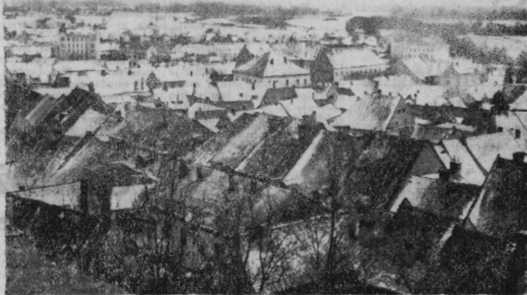
Se en pogled na Ptuj pod nedavno belo odejo, ki se sedaj verjetno ne bo več povrnila

Glede na pomembnost tega vprašanja je izvršni odbor sklenil kadrovske zadeve obravnavati še pred širšim aktivom, na pletumu SZDL.