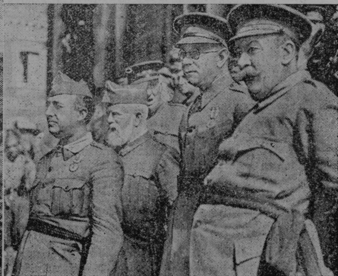
Voditelj nacionalistične španske vlade v Burgosu je postal general Franco. Na sliki vidimo zmagovite generale upornikov (od leve): general Franco, general Cabanellas in general Mola (z naočniki). — Levo: Preostanki zgodovinsko znamenite španske trdnjave Alcazar po razrušenju z dinamitom, katerega so povzročile rdeče čete tik pred umikom.