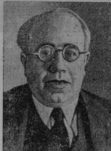
Španski vladni predsednik Azana, ki je na pobegu pred zmagovitimi nacionalisti.