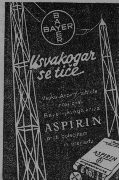
Oglas je registr. pod Št. 1753 od 17. XII. 1935.

Razsvetljava na lendavski pošti. V Lendavi imamo elektriko in mnogi hišni posestniki so si dali napeljati elektriko v svoja stanovanja. Samo poštna uprava v Lendavi uporablja še vedno svetiljke, kar pa nikakor ne odgovarja dobri poštni službi. Na tukajšnji pošti je uslužbenih osem uslužbencev in morajo z vestnostjo vršiti svojo službo. Zato bi bilo v interesu poštne službe, kakor tudi radi zdravja uslužbencev, da poštna uprava stori potrebne korake in da napeljati čim preje elektriko v svoje poslopje. Ker je Lendava precejšnje poštno križišče, saj vozi poštni avtobus iz Sobote, ob enem pa je tudi končna postaja radi bližnje državne meje,