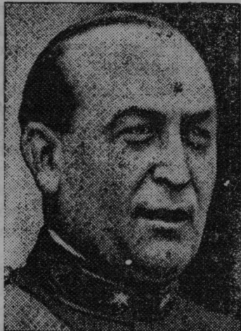
Madžarski ministrski predsednik Julij Gömbös je umrl v starosti 50 let.