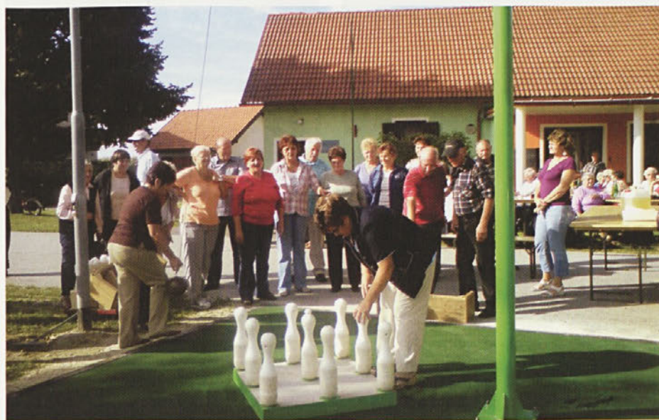
Viseče kegljanje v Zagojičih

besedilo: Bezjak Marija