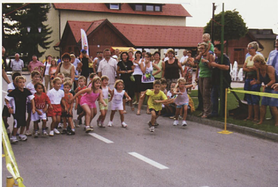
Najmlajši „rekreativci“ se udeležujejo tudi teka ob občinskem prazniku

S pričetkom novega šolskega leta smo tudi najmlajši »telovadci« prišli s svojo rekreacijo, ki poteka že 4. sezono.