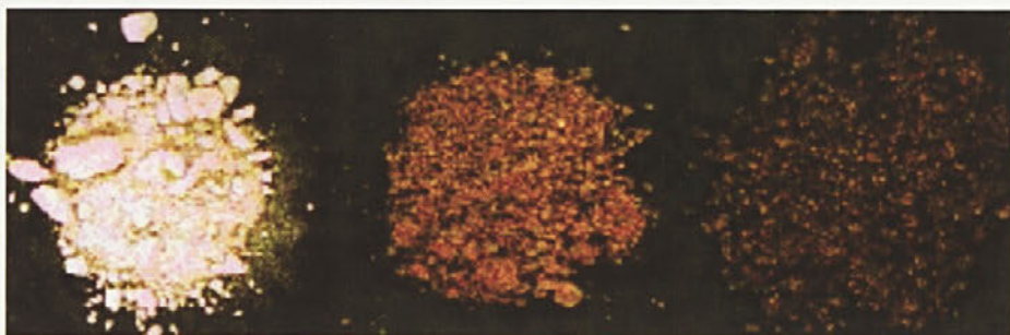
Vzorci heroína v različnih barvah

poveča generacijski prepad med vami in vašim otrokom. Če bo imel otrok občutek, da mu zaupate, se bo s svojimi težavami verjetneje obračal na vas.