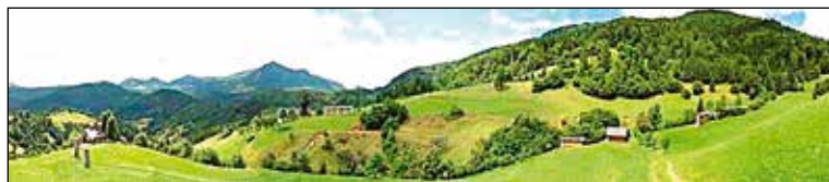
Pobočje nad vasjo Zgornja Sorica.

Terasasta pobočja pod Ratitovcem, posejana z vasmi Zgornja ter Spodnja Sorica, Ravne, Torka, Zabrd, Zgornje ter Spodnje Danje, Prtovč in Zali Log, skrivajo več kot 800 let staro zgodbo, katere začetek je iskati pod špičastimi vrhovi zgornjega dela Pustarške doline (nem. Hochpustertal, ital. Alta Pusteria) na Južnem Tirolskem (nem. Südtirol, ital. Alto Adige). Njihova lega visoko nad dolino je nekaj izjemnega, vendar nikakor ne nenavadnega. Zaradi zgodovinskih ter naravno-geografskih danosti so bile po strategiji prostorskega razvoja Slovenije uvrščene med območja, ki z vidika kulturnega in simbolnega pomena pokrajine veljajo kot prepoznavna območja Slovenije (Kopač, 2004).