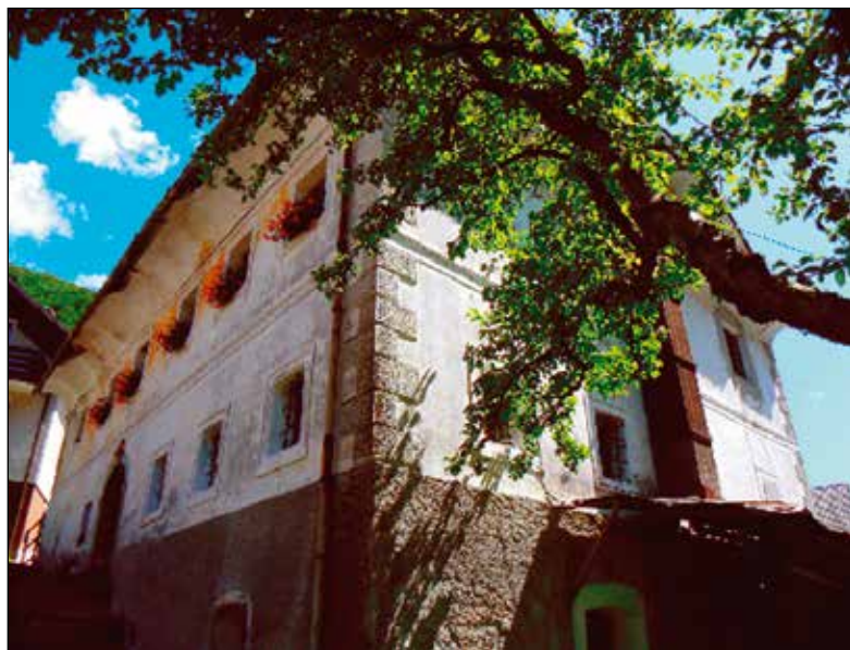
Hiša z meščanskimi elementi na Zalem Logu št. 12.

Treba je razjasniti, da objekta, ki bi ga lahko danes v celoti enačili s tistimi na Južnem Tirolskem, v zgornjem delu Selške doline ni več, saj je v teku sto-