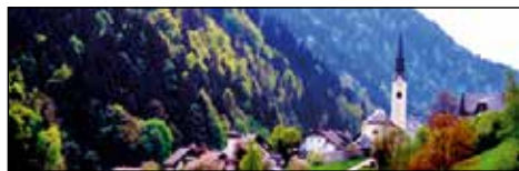
Veduta vasi Zali Log (vzhod-zahod).

Gospodarska dejavnost je temeljila predvsem na samooskrbnem kmetijstvu in na gozdarstvu ter nekaj malega na planšarstvu. Vasi so se le počasi širile in rasle po številu prebivalcev, kar je razvidno iz loških urbarjev, kjer se vidi, da se število objektov v tem delu skozi stoletja ni bistveno povečevalo. Omenjeno dokazuje tudi število hub, ki se od leta 1500 do leta 1825 ni bistveno spremenilo in je ostalo okrog številke 58 (Blaznik, 1928). Naj omenim še, da navkljub burnemu dogajanju ter vzponom in padcem fužinarstva v dolini območje zgornjega dela