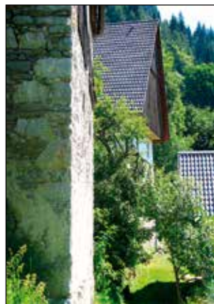
Domačija Zgornjega Trojarja.