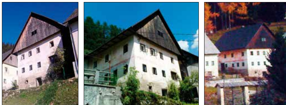
Domačija Gajgar v Zgornjih Danjah.

v Pustarški dolini. Slednja je postavljena na višini približno 1500 metrov nekaj kilometrov od vasi Sexten in 10 kilometrov od mesta Innichen. Osrednja stavba, ki pod eno streho združuje gospodarski in stanovanjski del, je z eno stranico prislonjena ob strmo pobočje, prav tako kot stavba v Zgornjih Danjah. Zgodovinsko gledano je na preučevanih območjih v Selški in Pustarški dolini najprej stala le ena stavba, v kateri so bili združeni tako gospodarski kot stanovanjski prostori. Šele kasneje so na posestvih sezidali še druge pomožne objekte. To nam potrjujejo tudi zgodovinski viri za soriško župo in za vas Zgornje Danje; Blaznik navaja, da je bilo tam leta 1501 vrisanih 4 x ½ hube, to so štiri stanovanjska poslopja, zelo verjetno z enim samim objektom (Blaznik, 1973, 426). Dokaz, da so bila v drugi fazi razvoja na območju Zgornjih Danj vse do leta 1763 le štiri stanovanjska poslopja, nam prikaže tudi jože-finska vojaška karta.