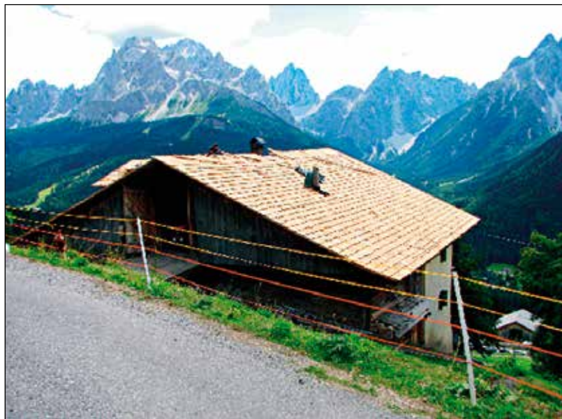
Domačija nad vasjo Sexten.

pobočju "hebel", 11 ki je statično omogočila gradnjo širše hiše. V tem času je bila hiša že delno zidana, imela je kamnite temelje in večje število notranjih prostorov. Še vedno pa ostaja v prednjem, čelnem delu hiše, ki gleda proti dolini, bivalni prostor za ljudi, v zadnjem delu hiše pa prostor za živino (v večini primerov gre le za en prostor). V podstrešnih prostorih se shranjuje seno. Prav tako so pri taki hiši vidni različni vhodi vanjo, saj notranjih stopnic v tem času ni bilo. Najnižji vhod je na prednji čelni strani, ki gleda proti dnu doline in vodi v klet - "keler" ali v kasnejših obdobjih v domačo delavnico. Drugi vhod je s strani in vodi v bivalni del hiše, tretji vhod, ki vodi v zgornji del hiše pa je lahko prav tako s strani ali pa v zadnjem delu hiše s pobočja. Postavitev tega vhoda je bila odvisna od naklona pobočja in od velikosti hiše. Zadnji, četrti vhod na senik - "dah" je vedno v zadnjem delu hiše, vstop vanj pa je mogoč neposredno s pobočja ali pa preko lesenega mosta. Na Zalem Logu, kjer pobočje ni bilo tako strmo, so ljudje seno pod streho nakladali z vilami in ni bilo neposrednega dostopa do senika. Strehe so bile še vedno pokrite s skodlami, vendar jih je v Selški dolini v začetku 18. stoletja začela zamenjevati skrilasta kritina. 12 Za hiše je bil značilen tudi velik zatrep,