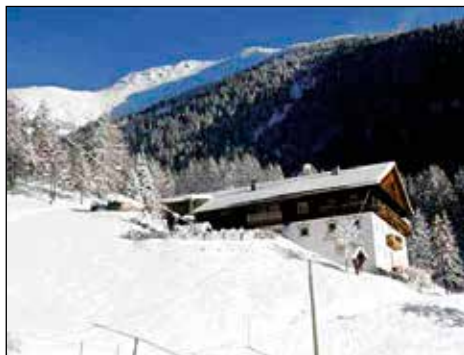
Domačija Tschurtschentaler.