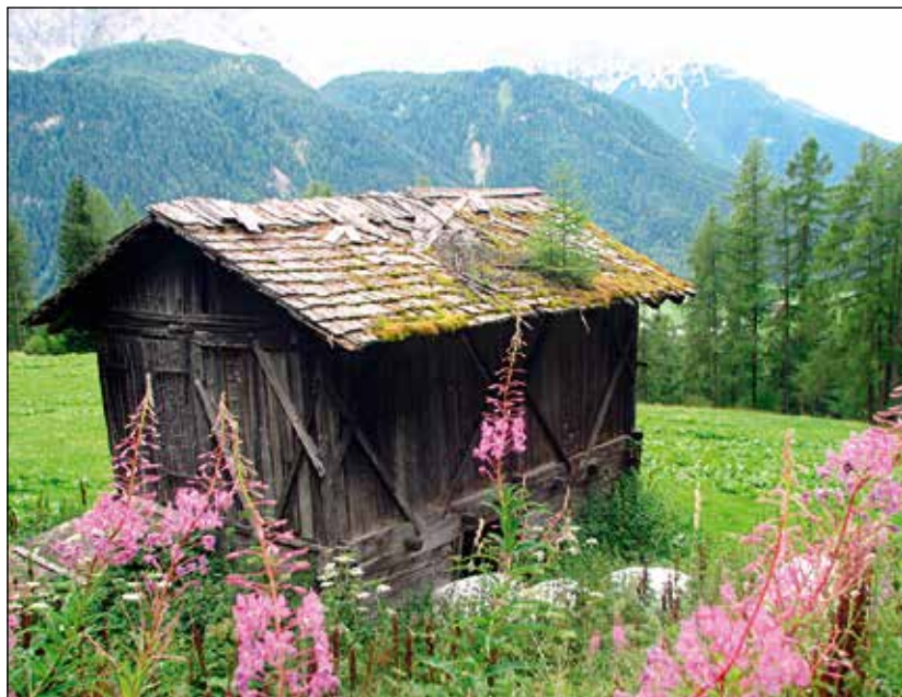
Lesena struktura v zgornjem delu Pustarške doline.

V najzgodnejši fazi, iz katere je ohranjenih le malo virov, 10 je bila hiša preprosta, večcelična zgradba, postavljena v strmo pobočje ali pa na umetno oziroma naravno ustvarjeno teraso v pobočju. Hišo so vedno postavili na prisojno stran hriba, s čelno stranjo obrnjeno proti dnu doline in v celoti zgrajeno iz lesa. V tej fazi kamnitih temeljev najverjetneje še ni bilo. Okna na hiši so bila majhna, kar je bilo pomembno s stališča akumuliranja toplote v prostoru. Hiša je imela ozko in strmo ostrežje, krito s skodlami, da bi