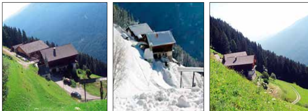
Domačija Gajgar.

Ob primerjavi domačij razlika med stanovanjskima objektoma ni tako očitna, je pa vidna pri gospodarskih in pomožnih gospodarskih objektih. Omenjeno razliko se najprej opazi pri kozolcih, saj so bili ti v zgornjem delu Selške doline zidani in le delno leseni, medtem ko so bili v Pustarški dolini povsem leseni. Gospodarsko poslopje zgornje Selške doline pa prav tako po obliki ne posnema več tistega iz Pustarške doline. Na tem primeru se tako izrazito kaže, da prebivalci zgornjega dela Selške doline niso bili več v tako veliki meri navezani na prvotno domovino, temveč so vedno bolj postajali povezani s svojo bližnjo okolico v Selški dolini in z regionalnim centrom Škofja Loka.