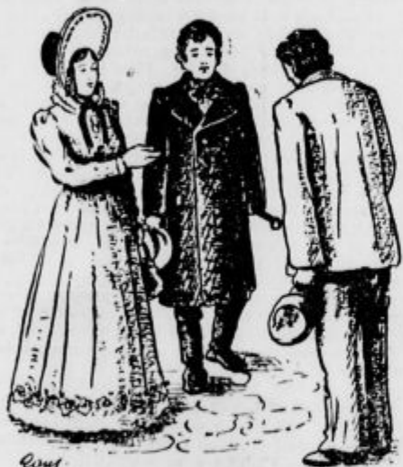
»To je moj brat...«

Vzdihnila je. »Toda morate vsaj pomilovati Francoso,« je rekla in nekoliko zardela, ko je izpregovorila te besede z nekakim tujim, zelo prijaznim naglasom.