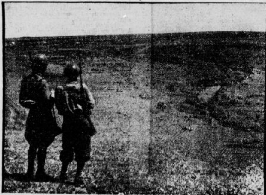
Koncentracijsko taborišče sovjetskih ujetnikov v zaledju ruske fronte pod stražo italijanskih vojakov.

V Revalu je začela izdelovati neka tovarna nov nadomestek za čokolado. Izdelek je sestavljen iz ržene moke, graha, žita in praznega fižola, katerim dodajo rastlinska olja, sladkor in esence, ki imajo isti okus kot čokolada, pa tudi podobne rešilne snovi.