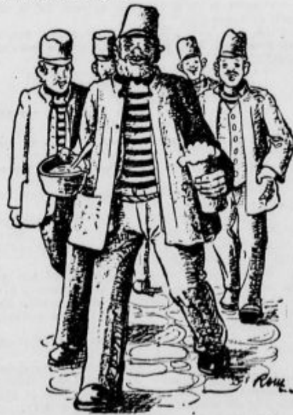
kako se je majal proti meni... (Nadaljevanje prihodnjik.)

Tako se je zgodilo tudi to pot. Toliko da nam je bila jed razdeljena in tolko da sem se umaknil v svoj konec dvorišča, že sem ga videl, kako se je majal proti meni. Pri tem je kazal neko togoto razposajenost. Trop mladih bedakov, ki so ga imeli za velikega šaljivca, mu je sledil s pričakovanja polnimi očmi, in opazil sem, da je mene izbral za predmet svojih neznošnih šal. Prisedel je k meni, si pripravil svojo jedato, mi napiljal s svojim jetnikskim pivom in jel govoriti.