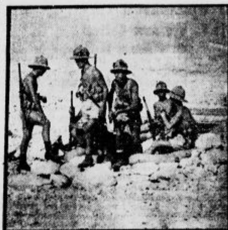
Italijanska sprednja opazovalna straža na egiptskem bojišču.