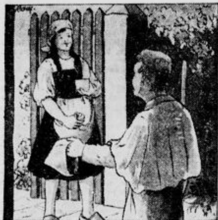
»Dober dan, gospodična.«

Pozdravil je z obrazom žarečim od veselja. Deklica je odprla ograjo, da sta medved in njegov gospodar mogla vstopiti. Ko sta vstopila, se je opogumila in plaho pobožala medveda po gostem kožuhi; medved jo je dobrohotno premeril s pogledom; za nagrado je dobil lep kos polente. In spet se je oglašil slovesni brum, brum, brum.