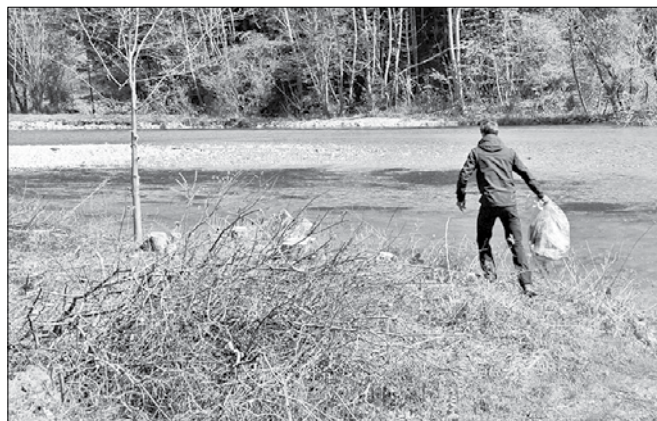
Čeprav je bilo letošnje stanje boljše, se je na očiščevalnih akcijah še vedno nabralo preveč smeti.

Centrih Ocepke predstavljajo biorazgradljivi odpadki le pet odstotkov ločenih frakcij. Del prebivalcev, ki živijo v blokovskih stanovanjih, po njenih besedah še vedno ne ločuje odpadkov, temveč jih, tako bio razgradljive kot embalažo, odvržejo v zabojnike za mešane odpadke. Če bi bili ti odpadki pravilno ločeni, bi se stroški predelave in odlaganja odpadkov znižali.