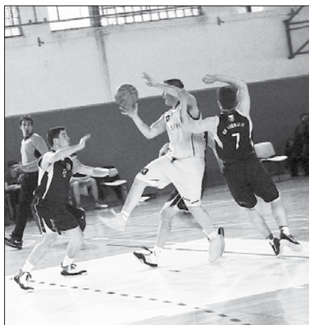
Tekma je postregla z veliko dramo, Nazarčani so dolgo lomili nasprotnika.