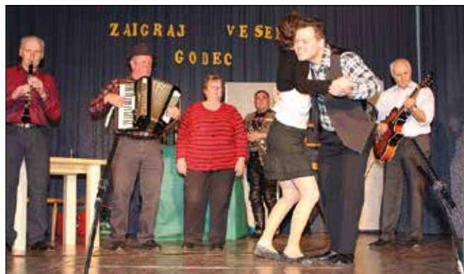
Za učinkovitejše osvajanje dekleta je potrebno pokazati tudi plesno znanje.