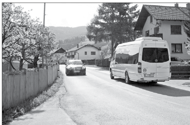
Ob srečevanju avtomobilov na regionalni skozi Radmirje za pešce ne ostaja kaj prida prostora.