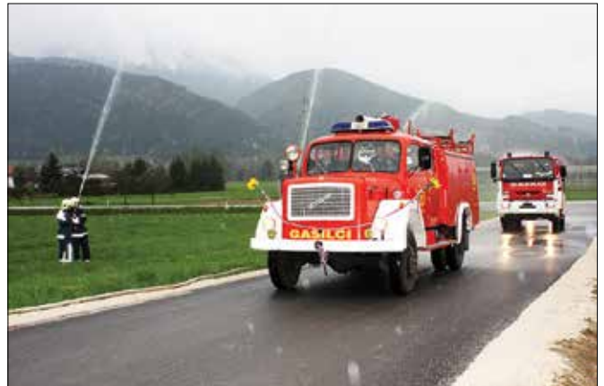
Radmirski gasilci so z vodnim curkom pozdravili prihod svojega vozila.

Vrsničani so do vozila »prišli« na osnovi malega oglasa o prodaji, ki so ga Radmirci objavili v gasilskem vestniku. Po sklenjeni kupčiji so se vezi prijateljstva krepile in ob obiskih pri stanovskih kolegih v Vrsniku so si Radmirci vse pogosteje želeli, da se vozilo vrne nazaj. Ko so Vrsničani vozilo zamenjali z modernejšim, so radmirski gasilci ustanovili odbor in ob pomoči članov in donatorjev zbrali potrebna sredstva za odkup.