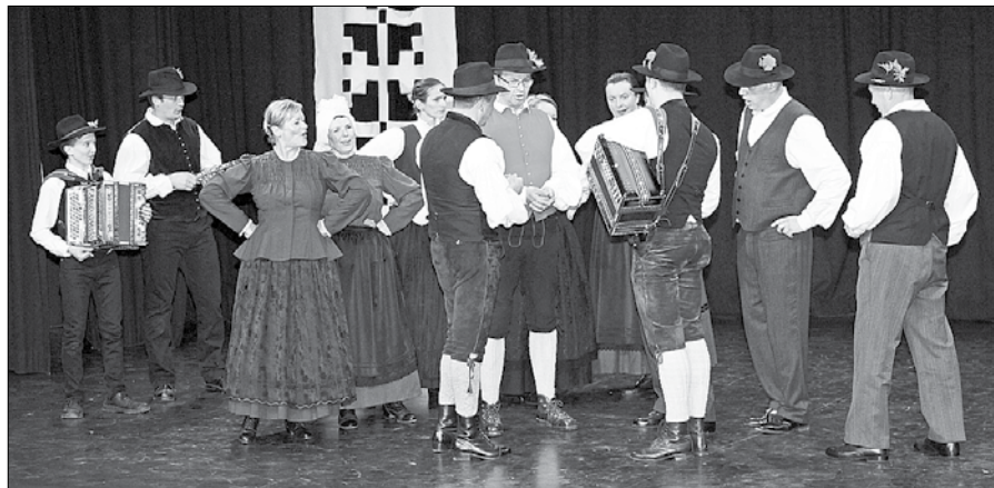
Plesalci folklorne skupine Kulturnega društva Bočna so na odru prikazali splet plesov.