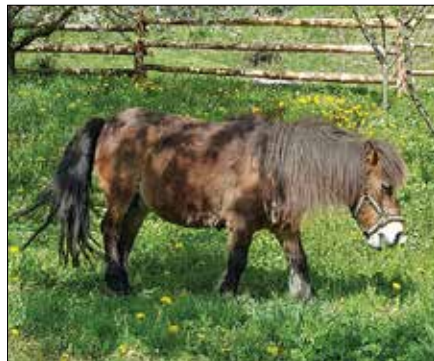
Ponudbo doživljajskega turizma širijo z jahalno cono za otroke, kjer je medtem že našel svoj dom prvi poni.

Če boste v prihodnjih tednih zavili v Prodnikovo gostilno v Juvanju, se boste med zares pestro ponudbo jedi iz špargljev najbrž kar težko odločili. Za začetek vam bodo ponudili špargljevo juho, nato boste lahko izbirali med šparglji na žaru, šparglji s slanino in pikantno omako, ocvrtimi šparglji s tatarsko omako, šparglji z jajcem,