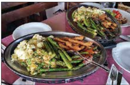
Če želite naenkrat poskusiti čim več različnih jedi iz špargljev, je najbolje, da naročite ploščo.