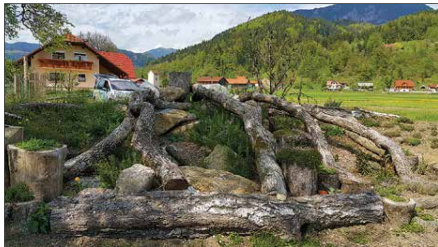
V zeliščnem vrtu pridelujejo zelišča, iz katerih izdelujejo domače čaje, kar predstavlja še korak dlje v njihovem konceptu domače oskrbe.

Na kulinarično razvajanje se naročite na tel. št. 838 10 30 ali 041 752 111 ali 031 752 111 www.prodnik.com