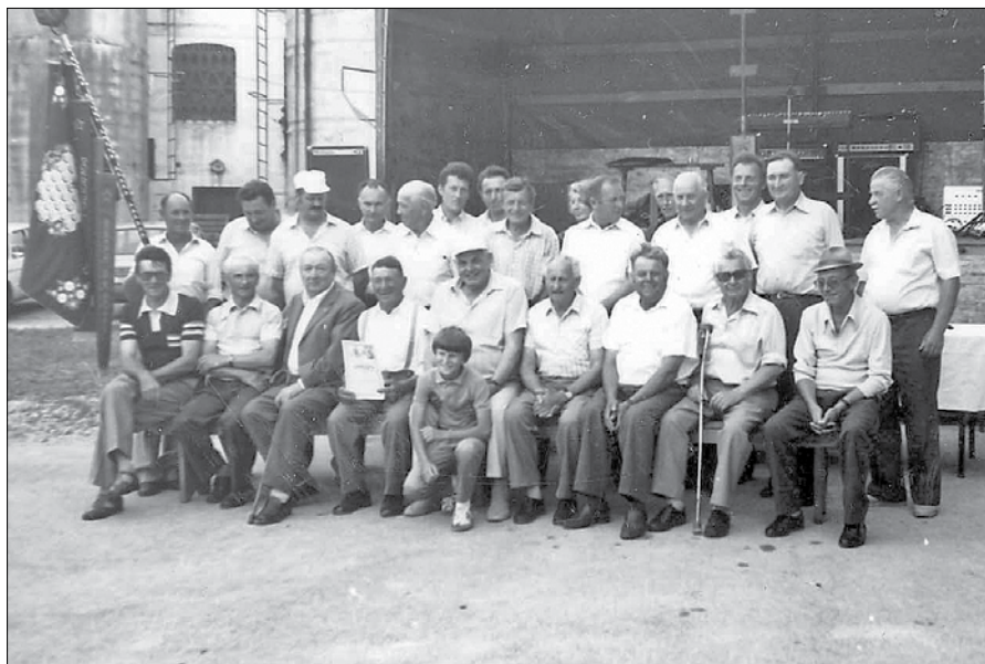
Ob 30-letnici delovanja so člani Čebelarke družine Kokarje razvili nov društveni prapor.