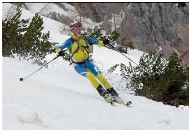
Proga za slovenski pokal v turnem smučanju je bila dolga dobrih deset kilometrov. (Fotodokumentacija celjske postaje GRZS)