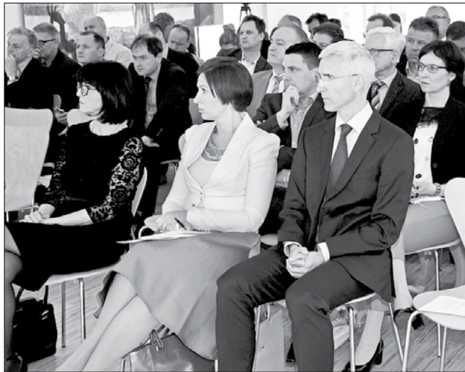
Poleg članov Savinjsko-šaleške gospodarske zbornice in nekaterih županov oziroma predstavnikov lokalne skupnosti so se dogodka udeležili številni predstavniki gospodarstva.