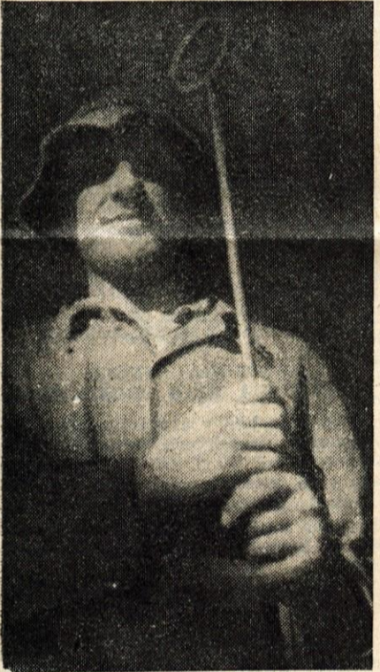
Jeseniški železar pri delu

lavca ter z okrepitevijo osebne odgovornosti. Urediti je treba obstoječi interni zakonodajni sistem v tovarni, ker je postal dokaj nepregleden. Razmejiti je treba pristojnosti posameznih organov upravljanja od pristojnosti poslovno - upravnih organov ter sestaviti ustrezne poslovnik. Delo družbenih organov v tovarni je često suho formalno in ne upošteva dovolj družbeno - ekonomskih ciljev. Rešiti kaže tudi vprašanje, kako bi bilo moč najbolj okrepiti stike med organi samoupravljanja in kolektivom.