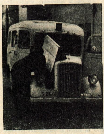
FRANC CIMŽAR POPRAVLJA...

rem storiti. Kaj več o tem bi vam utegnil povedati moj spremljevalec — bolničar.«