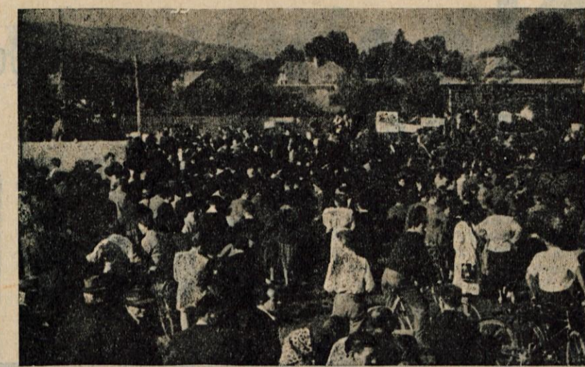
Velika manifestacija gorenjske mladine v Žabnici

Se nekaj je bilo moč opaziti: Ker se približuje Dan mrtvih, so bile na trgu v prodaji svečke za grobove in