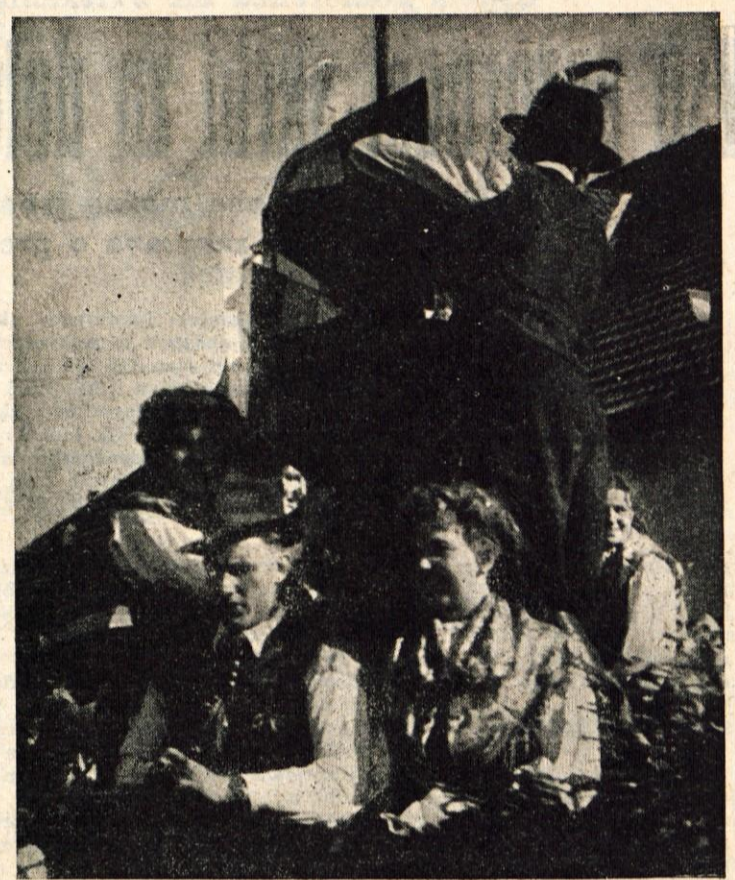
ALI BO NAŠ VOZ NAJLEPŠI? Veliko jih je bilo, ki so se trudili, da bi bil njihov voz najskrbnejše urejen. Njihov trud je bil viden; vendar, nekdo pač mora biti prvi.

TEDEN ZADRUŽNE MLADINE GORENJSKE ZAKLJUČEN