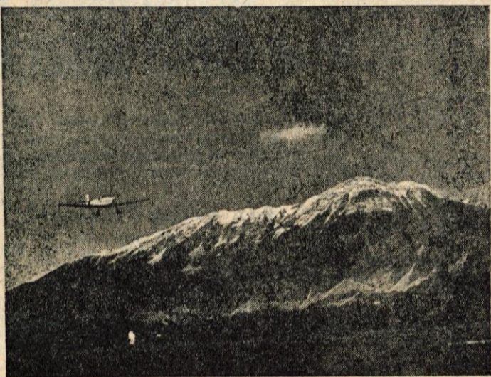
LESCE Sportno letalo Matajur nad etališčem v Lescah