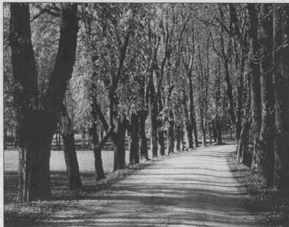
Kostanjev drevored pred gradom.

Drevesa kot nosilci prostornin se pojavljajo v različnih oblikah. Združeni v gruče se pojavljajo v hrastovem logu pri izviri Malega Obrha in proti vasi Šmarata, kot linije v drevoredih (hrastov, lipov, javorjev, slivov) ali kot točke (posamezna drevesa).