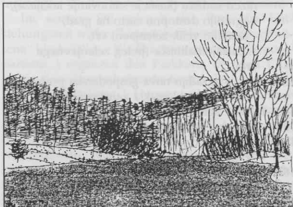
Jez ob žagi, (risba Marko Dobrilovič).

Poleg travnih površin se kot ploskev pojavljajo še vodne površine (potoka Mali Obrh in Brezno z izviro, jezero ob izviri Brezna in pred gradom, zajezitev Malega Obrha pri žagi ter izliv Brezna v Mali Obrh).