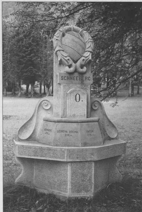
Ničelni kamen, od katerega so bile izmerjene vse ceste na Snežniku.