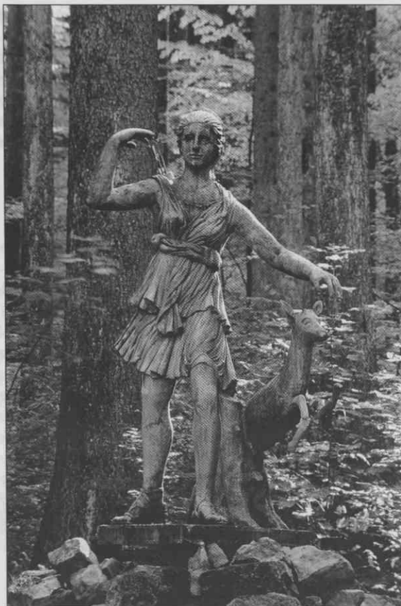
Kip Diane rimske boginje lova.