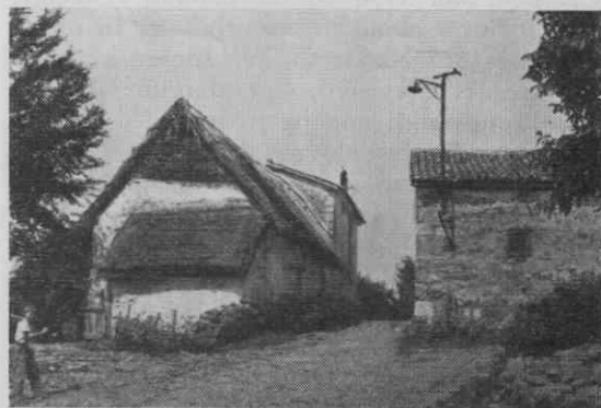
Hrušica, Kosova hiša

Tudi zdaj je tu in tam prišlo do neredov. Leta 1679 je prišlo v Konjicah do nastopa proti cesarskemu predstavniku zaradi prepovedi trgovanja z morsko soljo. 59 Medtem ko namreč vse kaže, da se je dotlej morska sol kljub postrožitvi solne meje v njeno škodo (1648) 60 brez posebnih težav razširjala po Slovenskem Štajerskem, se je kmalu po ukinitvi solnega apalta za morsko sol (1661) začel po vladarjevih uradih krepiti pritisk v prid ausseeski soli, ki ga je bilo čutiti tako na Štajerskem kot na vzhodnem Koroškem. Poskus ustanovitve državnih (erarialnih) skladišč iz 1663/1664 se je sicer 1668 pokazal za neizvedljivega, ker so vozniki in tovarniki še nadalje transportirali sol. Zato so se vladarjevi organi najprej zadovoljili s tem, da so priznali prost promet soli, toda izključili so od njega morsko sol. Da praktično ni bilo mnogo uspeha, pričajo že navedena Valvasorjeva mesta, ki prostodušno govore o tem, kako Kranjci tovorijo sol na Štajersko. 1679 so ponovno uvedli državna skladišča, ki pa niso bila toliko monopolna kot namenjena za borbo proti uvozu morske soli. 61 To je bil torej neposredni povod za nemire v Konjicah. Proti prepovedi uvoza morske soli v celjsko četrt so 1684 združeno nastopili kranjski in štajerski deželni stanovi. 62 Vse kaže, da so vsi državni ukrepi, ki naj bi globlje posegli v starodavne navade pri kupčevanju s soljo, v XVII. stoletju le s težavo in kvečjemu delno uspevali.