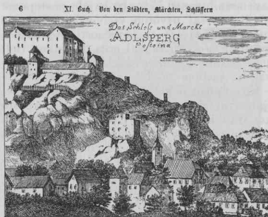
Postojna po Valvasorju