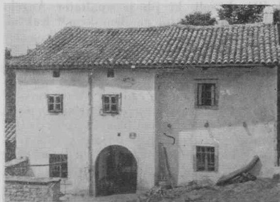
Hrušica, pri Micnih

Morda so kranjski stanovi že tedaj začeli misliti na to, da bi odvrnili nenehni pritisk