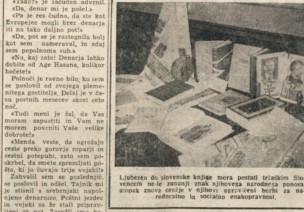
Ljubezen do slovenske knjige mora postati tršaškim Slovencev ne le znanji znak njihovega narodnega ponosa, ampak znova orožje v njihovi uprvični borbi za narodnostno in socialno enopopravnost.

Današnji britanski položaj na področju letalstva tako cilovnega kot vojaškega, je zelo občutljiv. Čeprav so vse najvažnejše uspehe dosegli v Združenih državah, vendar so vse iznajdbe in izboljšanja v praktične namene uporabljali v Angliji. V Ameriki letajo poskušala letala že nad tri tisoč km/h hitrostjo zvoka, a v Vel. Britaniji niso napravili nič za večjo uporabo raketnega pogona in vsaj uradno nobeno angleško letalo na raketi pogon še ni doseglo zvočne hitrosti, četudi lahko sklepamo, da se je v nekaterih letalih tudi brez pomoči raketnih motorjev to doseglo.