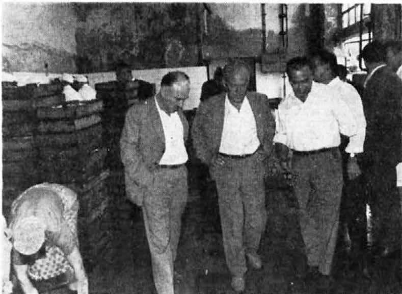
Predsednik skupščine SRS Sergej Kraigher z vodilnimi delavci našega podjetja na obisku v kombinatu