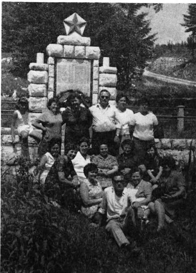
Del udeležencev izleta ZB 4. julija pred spomenikom na Predmeji