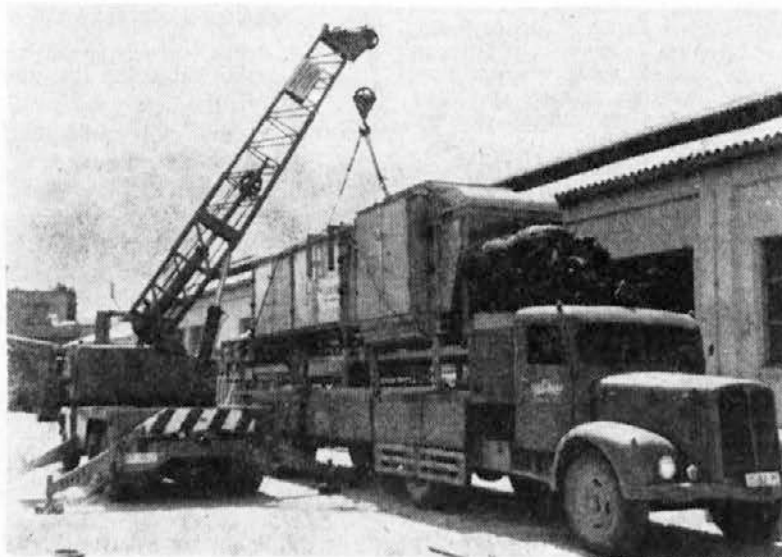
Prihod dveh novih strojev »Jedinstvo« za predelavo svežih rib v obrat Iris Razkladanje velikanov pred oddelkom predelave rib. Stroji so že v pogonu.