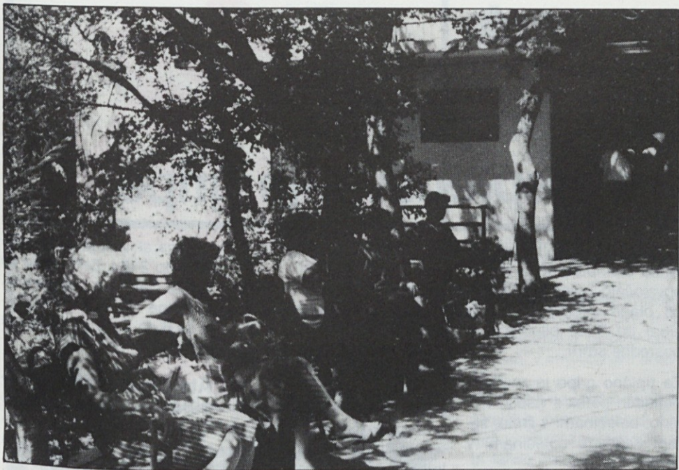
Dramalj, kjer je letovanje zares prijetno, še vedno čaka na ustrezno dolgoročno rešitev... Dom v Bohinju je bil letos premalo izkoriščen.