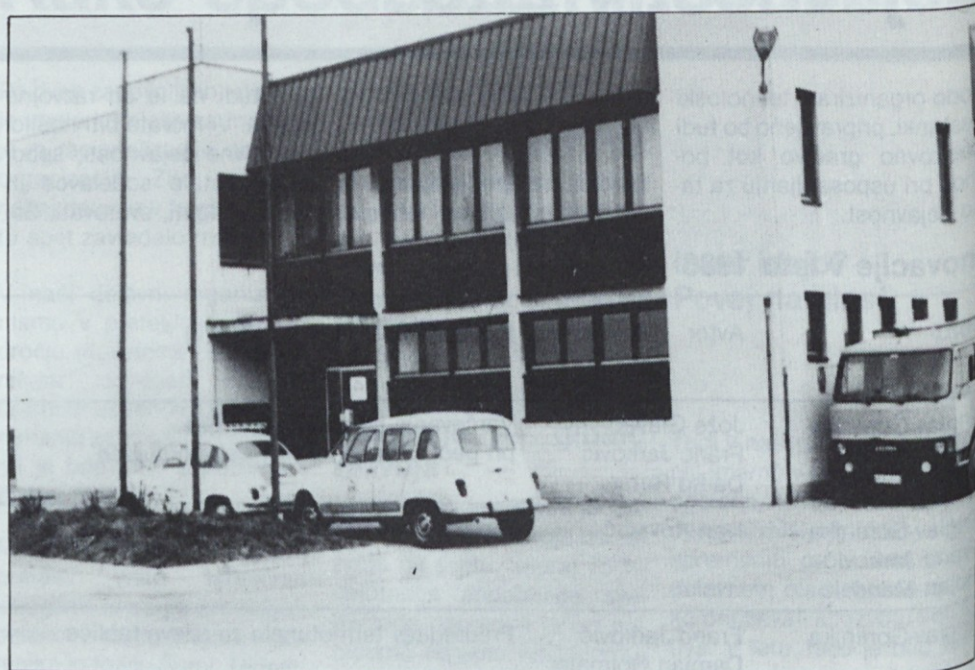
Pekarna v Brežicah, kjer je med drugim slaščičarski oddelek

Letos so začeli v Tozdu Pekarna Krško pripravljati toast. Enkrat ali dvakrat tedensko ga razvažajo po vsem Posavju. S prodajo toasta so zaenkrat v tozdu več kot zadovoljni. Kot kaže, se začenja tudi pri prodaji kruha, zlasti na kmetijskih območjih, obdobje borbe za slehernega kupca. Verjetno ni več daleč čas, ko bodo morale pekarnar in strokovne službe temu vprašanju nameniti veliko več pozornosti kot doslej.