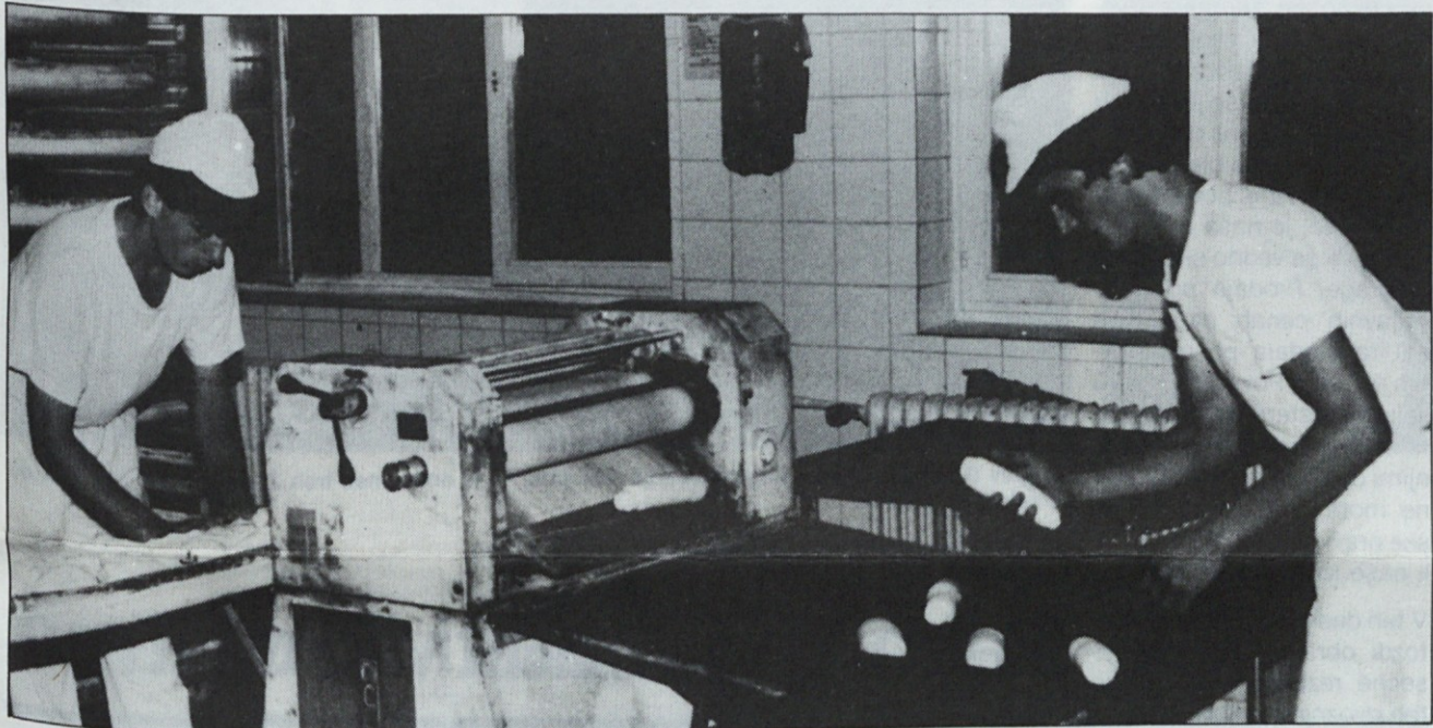
Med dejavnostmi beležijo peki zaenkrat še razmeroma dobre rezultate.

Ob spremljanju rezultatov poslovanja v devetih mesecih letošnjega leta lahko ocenimo, da je treba v preostalem času do konca leta poskušati vsaj omiliti, če že ne odpraviti vzroke, ki poslabšujejo poslovni uspeh. Gre za zmanjšani obseg proizvodnje in prodaje, nedoseganje načrtovanega izvoza, boljši izkoristek delovnega časa z zniževanjem nadurne-