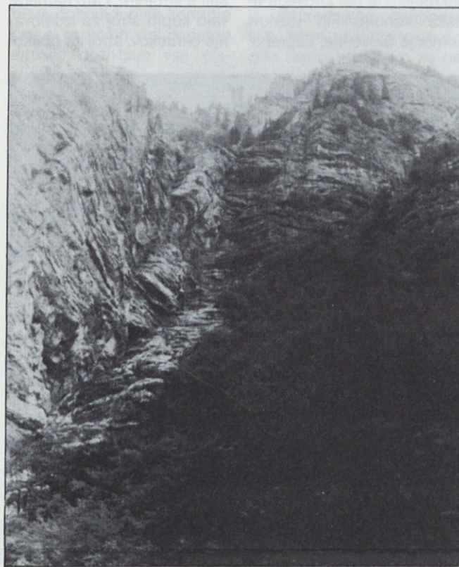
Težka pot je pred nami, da se povzpemo iz brezna težav . . . , pa vendar