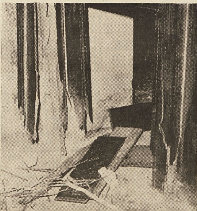
Opustošenje sedeža federacije KPI v Gorici po bombnem atentatu, do katerega je prišlo v noči med 24. in 25. aprilom. Članek o atentatu objavljamo na 6. strani.

Slovenski tovariši smo hvaležni KPI za veliko razumevanje in za konkretno podporo naši borbi. To hvaležnost pa bomo konkretno pokazali zlasti s širjenjem lista v vseh krajih dežele, kjer prebiva naša narodna skup-