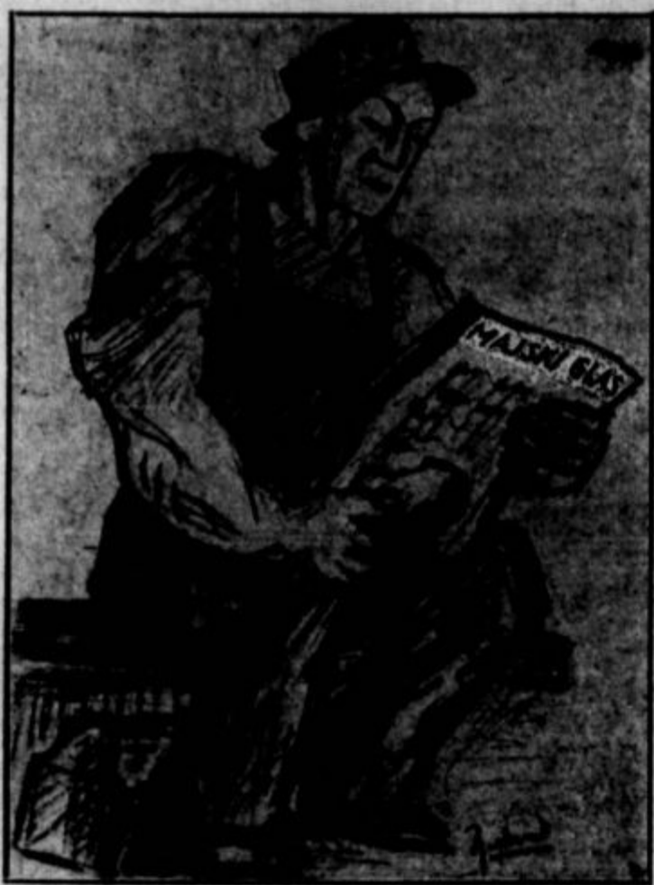
Prvi maj je delavstvu po svetu simbol solidarnosti in vere v nov svet — v socializmu. Mnogokje si ga že gradi in zmaguje vzlic silnim naporom starega reda, da ga prepreči.