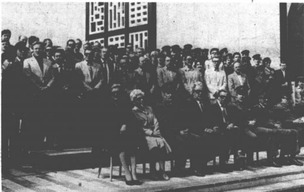
Slavja na velenjskem Titovem trgu so se udeležili tudi številni gostje

sovražnik in teritorialna obramba najmočnejši del notnih jugoslovanskih oboroženih sil. Glede na to, da smo vsi državljani, kadar se z orožjem v roki ali kakorkoli drugače upiramo napadalcu, se naša domovina ob morebitni agresiji dejansko spremeni v ježa s tisočermi bodicami. Mar se ni v