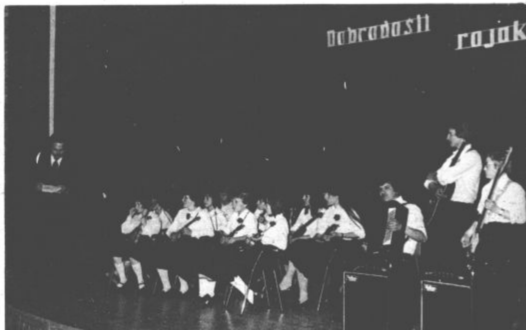
S svojim nastopom so rojaki s Koroške poželi nedeljeno priznanje

Topel sprejem in obenem izrazili svoje veselje, da lahko delček svoje kulturne ustvarjalnosti predstavijo prebivalcem Nazarj in okolice. Obojestranska je bila tudi želja, da bi bilo takšnih in podobnih oblik sodelovanja v bodoče še več.