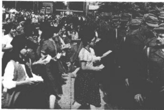
Pripadnikom TO so pionirji izročili zbirko Kajuhovih pesmi

»Oborožene sile so prva in najostrejša ost, ob katero bo trčil