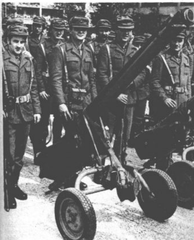
Z nedeljske slovesnosti na Titovem trgu v Velenju: Odločno se bomo uprli vsakemu sovražniku

Menimo, da je akcija, še posebej v tistem delu, kjer smo sodelovali mladinci, to je v kurirski službi, dobro uspeša. Kurirji so naloge opravljali z vso resnostjo, hitro in polnoletno pripravljeni na zborna mesta.