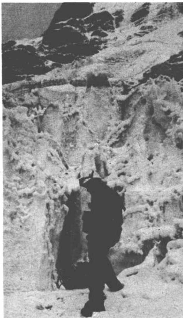
Bo strmina nad nami popustila?

P. S. Zaradi nemogočih vremenskih razmer se odprava že vrača v domovino. Vrh Lhotseja žal niso osvojili, čeprav so ga naskakovali z nadčloveškimi napori.