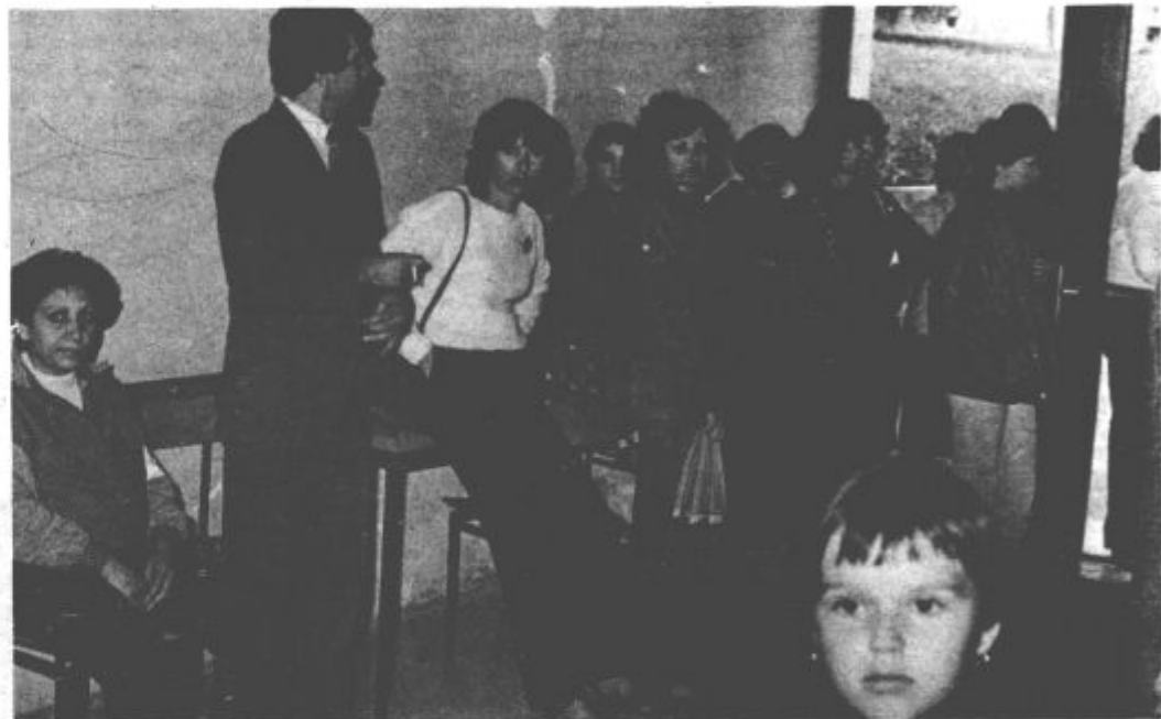
Pripravljeni za nudenje pomoči

V celoti pa so skupaj z zobozdravstvom v najkrajšem času organizirali 17 ekip splošno medicinske pomoči, ki so bile pripravljene, da bi v primeru klincev s trena priskočile na pomoč.