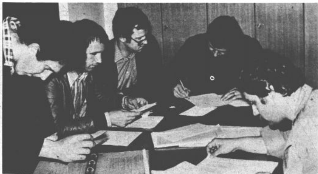
Vodstvo vaje v DO Plastika