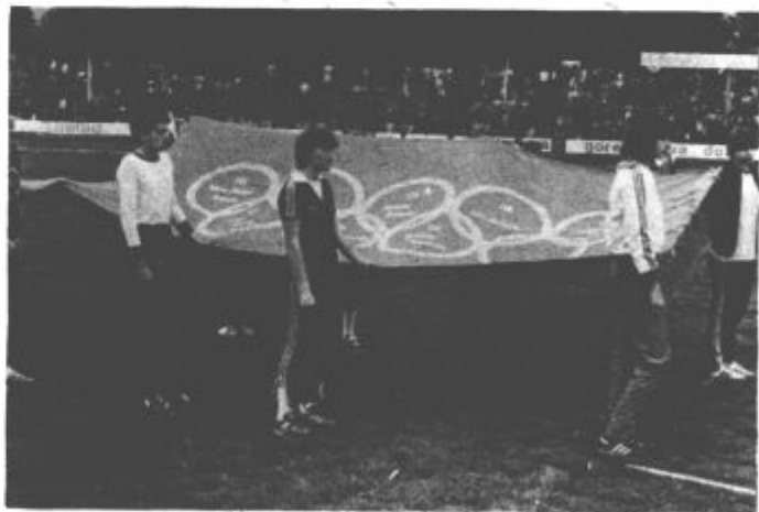
Pionirska olimpijska zastava