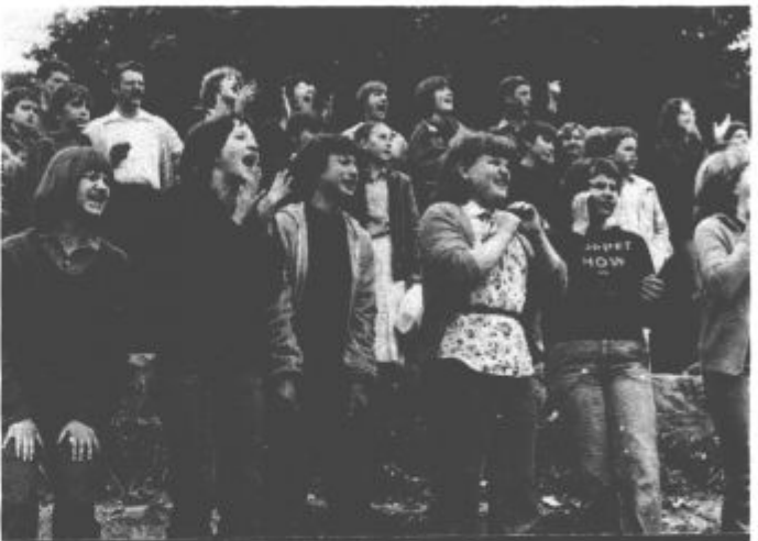
... drugi na tribunah