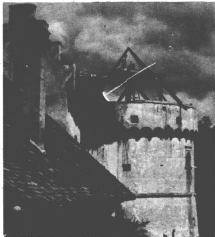
Stolp bo ponovno dobil prvotno podobo

tem poudariti tudi veliko razumevanje kulturne skupnosti Slovenije, ki prispevata levji delež sredstev, ki so za sanacijo velenjskega gradu potrebna.