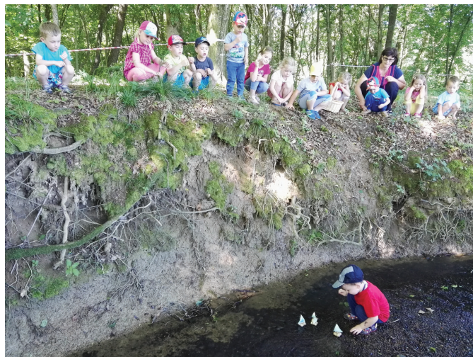
Spuščali smo ladjice po potočku