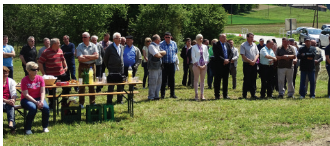
Zbrani krajanje ob otvoritvi