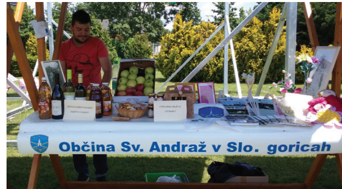
Promocija v Ljubljani

Festivala so se udeležili otroci sodelujočih osnovnih šol iz Slovenije, ki so medtem ko so čakali na razglasitev zma-govalcev in podelitev nagrad v posamezni kategoriji, tek-movali v raznih športnih igrah – mali nogomet na mivki, spretnostni in adrenalinski poligon ter med dvema ogn-jema na mivki.