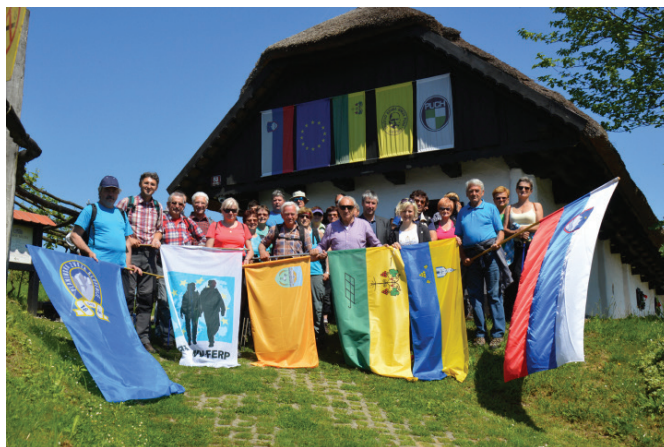
Skupinska fotografija pred Puhovim muzejem

V Juršincih se nam je pridružilo še več pohodnikov iz drugih krajev po Sloveniji, ki so od Puhovega muzeja nadaljevali naprej proti Polensaku, mi smo pa se od muzeja vračali proti domu.