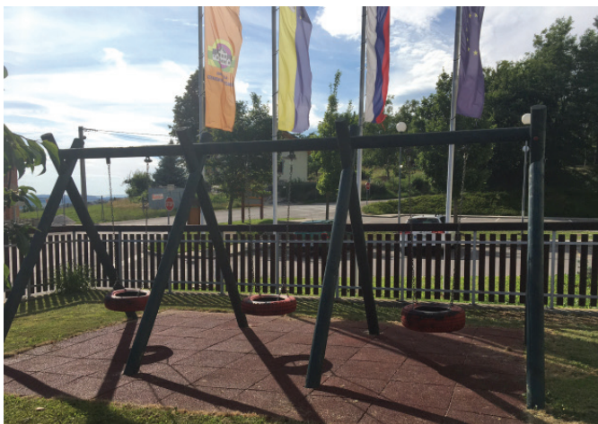
Tlane podloge, ki ublažijo morebiten otrokov padec

V šolskem letu 2016/2017 bodo v Vrtcu Vitomarci organizirani trije oddelki vrtca. Dva polna oddelka in eden polovični. Trenutno so za naslednje šolsko leto zapolnjena vsa mesta v vrtcu in nihče od otrok ni ostal brez mesta, kar nas veseli.