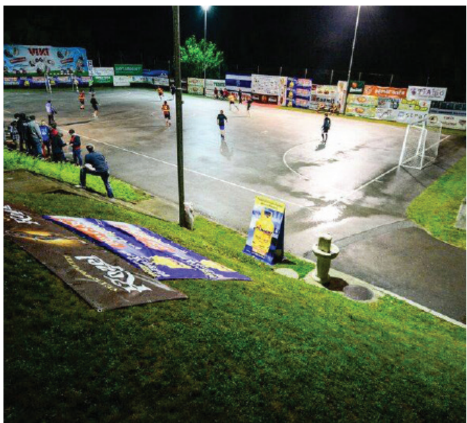
Tudi letos je zagodel dež, kar turnirja nikakor ne ustavi

Veterani 50 plus; (2 ekipe): Slovenke gorice/Selce : Vitomarci 2:1