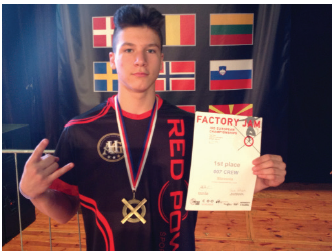
Bor že četrto leto zapored osvojil naslov mladinskega evropskega prvaka

Oktober Bor-a čaka naslednji izziv, svetovno prvenstvo, ki se bo odvijalo v Graz-u, kjer bo branil naziv svetovnega prvaka 2014/2015.