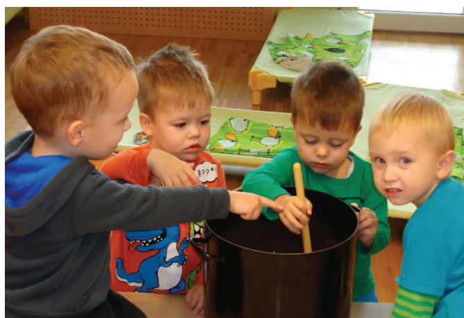
Učimo se kuhati