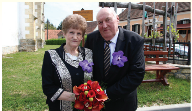
V teh mesecih smo bili priča številnim porokam