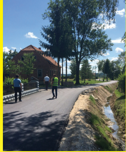
Obnova vodovodnega cevovoda v Vitomarški vasi