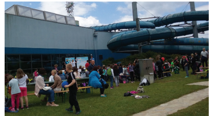
Festival je potekal v ljubljanskem BTC-ju