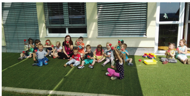
V vročih dneh smo se hladili ob jagodnem in bananinem sladoledu, ki smo ga pripravili sami v vrtcu