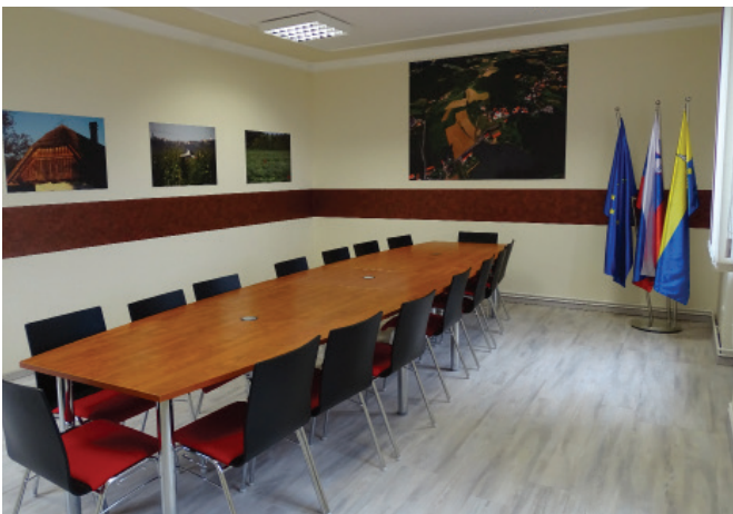
Nova sejna soba