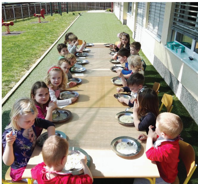
Privoščili smo si kosilo na terasi vrtca