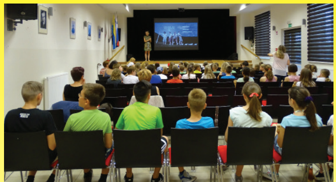
Občina je za POŠ Vitomarci in mini maturante ob koncu šolskega leta organizirala ogled filma