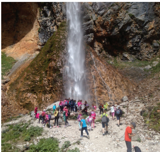
Pri slapu Rinka, 1.b, 2.b, 3.b, 5.b