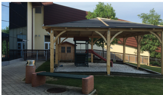
Nov nadstrešek nad peskovnikom