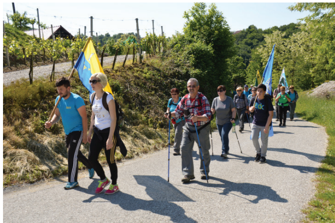
Na pohodu plapolale tudi zastave občin, skozi katere poteka pot

Pohod je od trga pred cerkvijo do Puhovega muzeja v Juršincih trajal 2 uri in pol, pot je bila pa v eno smer dolga približno 8 km. Vreme je bilo kot naročeno, saj ni bilo premrzlo niti prevroče, pač pa prijetno sončno.