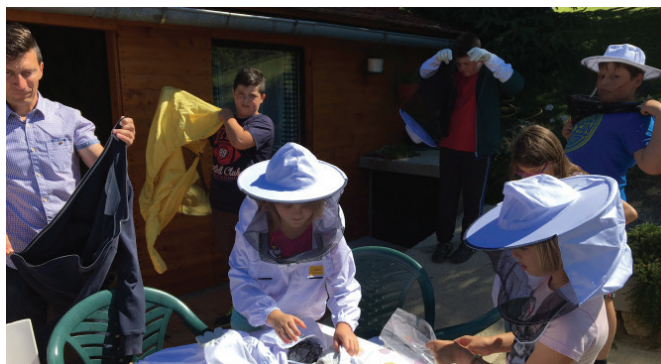
Otroci so si naredili zaščitne obleke