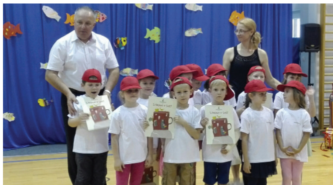
Slovo vrtcu in pozdrav šoli