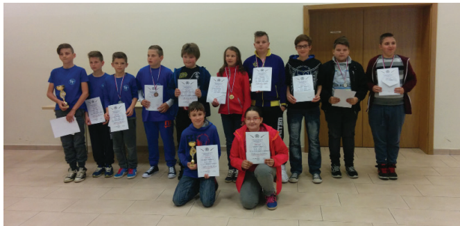
Mladi udeleženci turnira