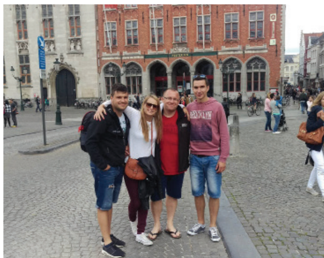
V mestu Brugge v Belgiji

Čeprav ponavadi nastopamo z našimi komedijami, moramo priznati, da so tudi tokrat naši gostitelji bili navdušeni nad našim petjem, igranjem in branjem poezije.