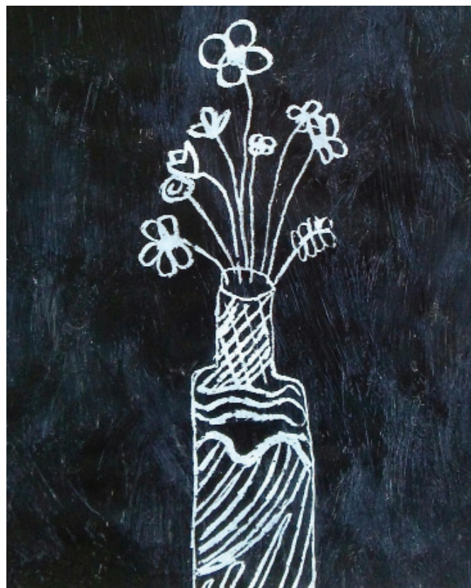
Vaza s cvetjem (praskanka), Nika Kuri, 2. b