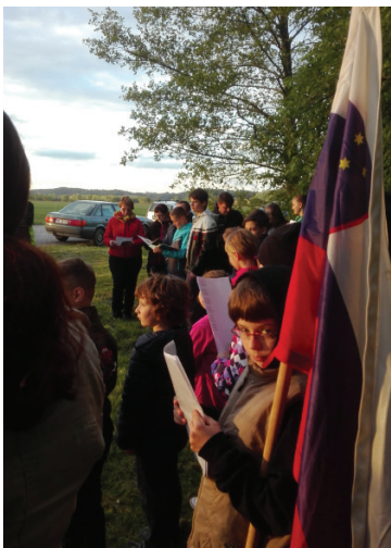
Proslave ob Dnevu upora proti okupatorju se udeležuje vedno več nastopajočih in gledalcev

Po izvedbi več aktivnosti v začetku leta, smo v našem društvu nadaljevali s pripravami, vajami in nastopi tudi čez celo pomlad. V aprilu smo organizirali pohod v Pesniško dolino in proslavo ob Dnevu upora proti okupatorju (včasih Dan OF), ki je bila pri pomniku v Trnovski vasi. Prepevali in prebiralimo pesmi, ki so povezane z obdobjem druge svetovne vojne. Nastopili smo člani Recitatorske sekcije in Mešanega pevskega zbora, pridružile pa so se nam Ljudske pevke Društva gospodinj in pevci Kvarteta Društva upokojencev. Nikakor ni zamenljivo dejstvo, da se nas je na letošnji prireditvi, tako nastopajočih kot obiskovalcev, zbralo kar nekaj več, kakor v preteklih dveh letih, ko smo pripravili podobni prosla-