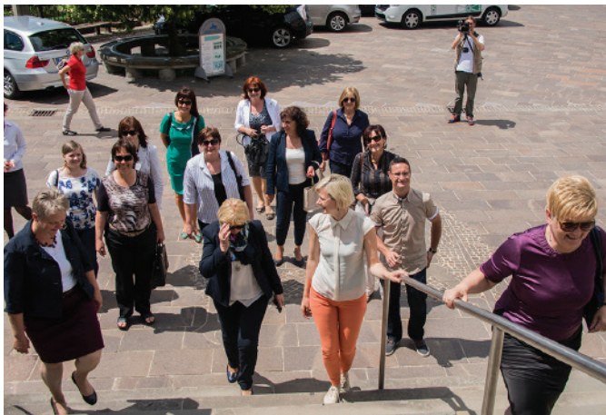
Slovenske županje tokrat v Majšperku