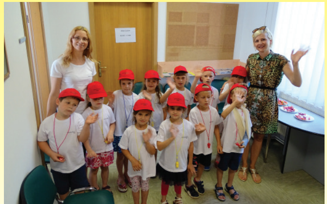
Minimaturantje obiskali županjo in občinsko upravo