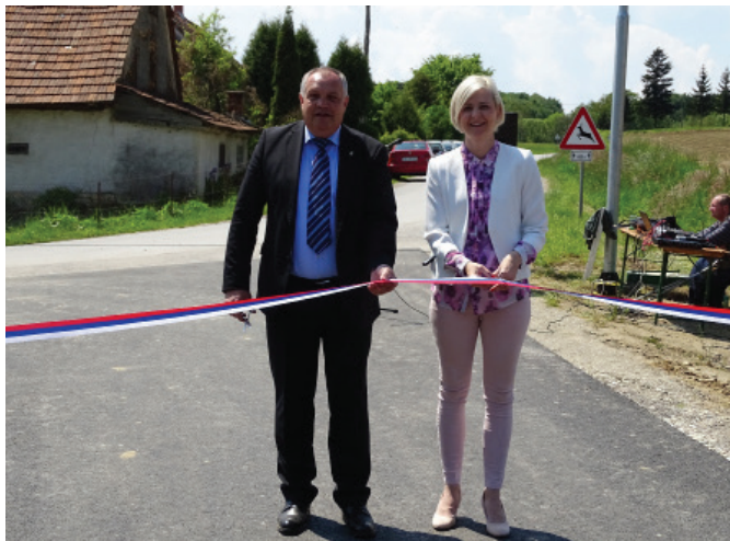
Prerez traku opravila župana Občine Sv. Andraž v Slov. goricah in Občine Cerkevjak