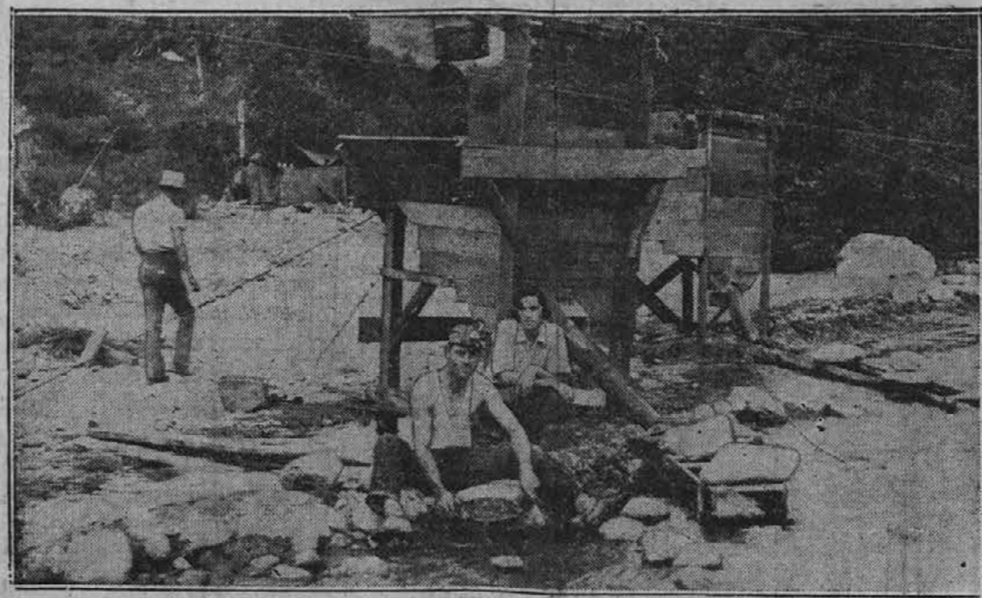
Ker pač nimajo drugega dela, so se kalifornijski brezposelni spravili na iskanje zlata. Kraj, ki ga vidimo zgoraj na sliki, leži v dolini San Gabriel Canyon, 40 milj od Los Angelesa, kjer se je kakih 500 brezposelnih naselilo z družinami vred. Dnevno najde vsak mož zlata povprečno za eden do dva dolarja.