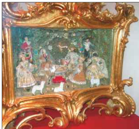
Omarične jaslice iz 18. stoletja, samostan benediktink v Velesovem.