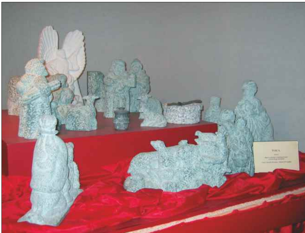
Jaslice iz Švice, cararski marmor.