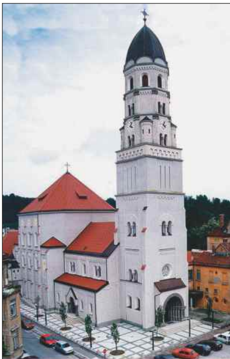
Cerkev sv. Jožefa v Ljubljani.

obiskali. V njem tako verujoči kot neverujoči na nek način ponovno odkrivajo staro deželo, v kateri se je pred dva tisoč leti rodil Jezus. Tu so naleteli na zakladnico različnih verskih pričevanj in duhovnosti, ki se združujejo z mojstrovinami umetnosti, po kateri zavzenijo v sozvočju vsa zgodovinska izkustva krščanstva v svetu. Namen potujoče razstave jaslic je ponesti sporočilo miru in bratstva med vse narode sveta, poleg tega pa razvijati zavest o umetnosti in ustvarjalnosti jasličarstva.