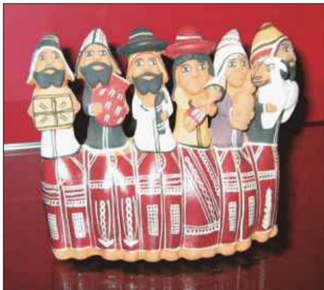
Jaslice iz Peruja, glina.

Borut Pahor , predsednik Državnega zbora RS: "Nikomur ni ostalo prikrito, da smo ljudje različnih nazorskih orientacij, in zdi se mi izredno pomembno, da je ob tej priložnosti mogoče tudi sporočilo o strpnosti in naši pripravljenosti, da živimo skupaj, se opogumljamo in smo solidarni. Slovenija jutri vstopa v Evropsko unijo, prostor, ki je zgrajen v različnosti in je hkrati sposoben med različnostmi spoznati tiste podrobnosti, ki nas združujejo in ta prostor gradijo kot enovit in močan steber miru."