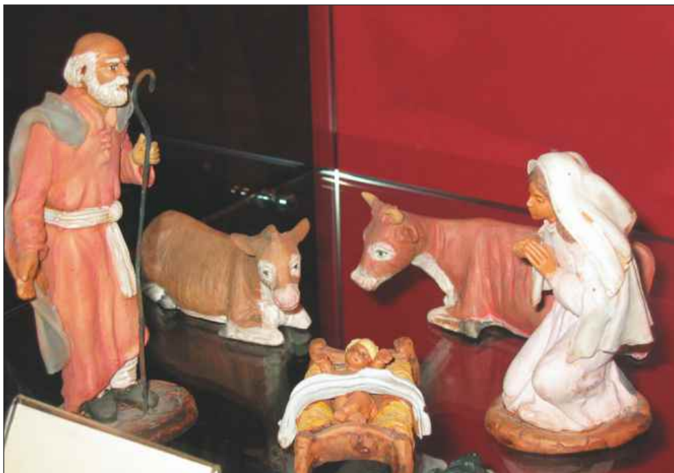
Jaslice iz Španije, glina.

projekta. Z navdušenjem je bila sprejeta cerkev sv. Jožefa v Ljubljani na Poljanah, kjer imajo jezuiti svoje duhovno središče. Izdelali so načrte za postavitev ter nas seznanili z našimi nalogami in zadolžitvami.