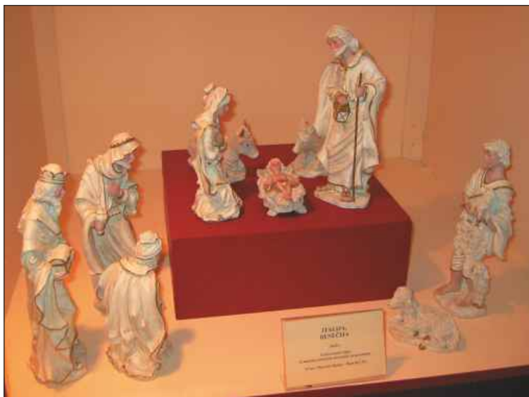
Jaslvice iz Italije, Lombardija, glina.