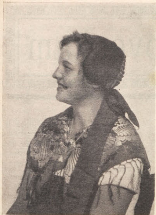
Dokler človeški rod biva na zemlji tod, bode slovelo slovensko deklet!