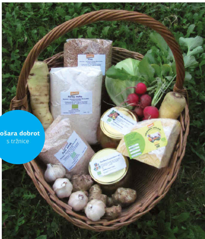
Košara dobrot s tržnice