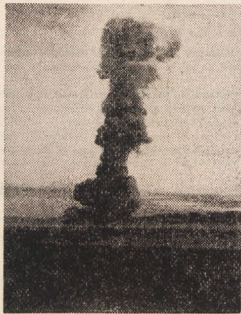
V Nevadi so v navzočnosti več tisoč mož ameriških čet izvedli nedavno eksplozijo atomske granate, ki je vsebovala razstrelilno moč 15.000 ton dinamita. (AND/INP)

V Nevadi je šlo za eksplozije novega atomskega orožja, katerega podrobnosti so strogo zaupne. Druge poizkuse, brez prisostvovanja ljudi so in baje bodo še nadaljevali.