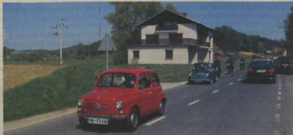
Preteklost in sodobnost vozita vsaka v svojo smer.