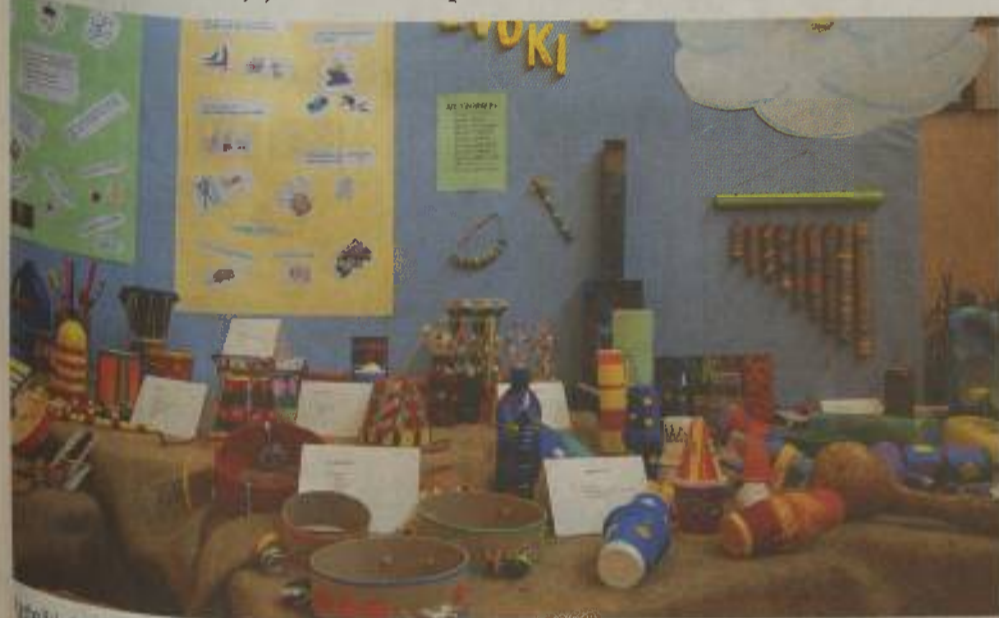
Učenci delavnice Zvok okrog nas - vse manj je petja, poslušanja narave. Pri izdelovanju pisali so jim pomagali tudi dedki, instrumente pa so izdelovali iz preprostih in dosegljivih materialov.