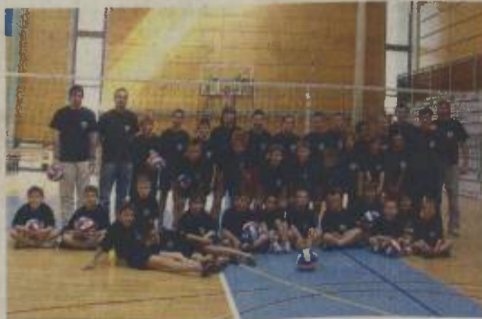
Skupinski posnetek mladih s starejšimi vzorniki.

smo bili presenečeni nad velikim odzivom. To se nam bo gotovo obrestovalo v prihodnje, ko se bomo še bolj opri na kakovostne mlade odbojkarje. Tudi poletni nameravamo organizirati odbojgarsko šolo za mlajše selekcije. Med šolskimi počitnicami bomo pripravili enotedenski tabor, ki bo omogočal igranje odbojke na pesku, izvajanje raznih interesnih dejavnosti in druženje.« M. Jerše