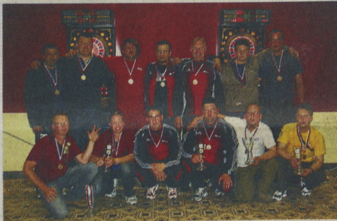
Med najboljšimi so tudi Pomurci.

V Rdeči dvorani v Velenju je bilo državno prvenstvo, ki ga je odlično organiziral PK Strela. Naslov ekipnega državnega prvaka v A-ligi 501 DO je že tretjič zapored pripadel ekipi Astro iz Nove Gorice. V finalu so rutinirano premagali ekipo Top Gun z Grlave. V tako v zadnjih treh letih zmagalo v finalu morala priznati ekipi Pri morcevc. Tretja pa je nekoliko presenetljivo ekipa Stara in Adelj od Dravi.