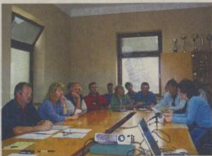
Udeleženci okrogle mize o športni vzgoji.