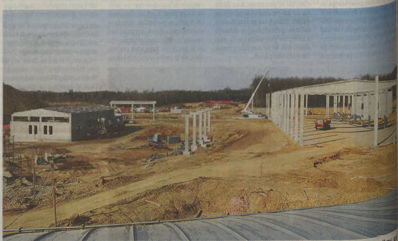
Ogromna površina novega centra, na kateri bodo različne hale, največja, v kateri bo mehanska obdelava odpadkov, meri kar 4500 kvadratnih metrov.

Moravska in puconška občina želita pred otvoritvijo CERO Puconci zagotoviti da bo na cesti Murska Sobota-Hodoš zagotovljena prometna varnost