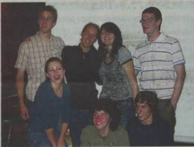
V muzikal Hair je bilo vložena veliko dela, vseh ur niti prešteti ne morejo, so pa zato toliko bolj veseli uspeha in povabil.