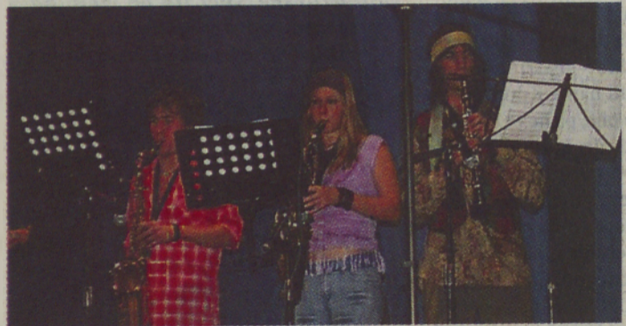
Soboški gimnazijci se bodo na enem največjih glasbenih festivalov v Ameriki predstavili s filmsko glasbeno uspešnico Hair. Odpotovali bodo konec julija.