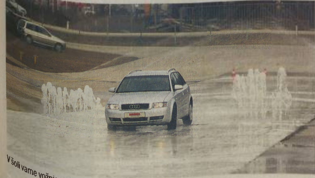
V šoli varne vožnje se urimo v izogibanju oviram, zaviranju v sili in obvladovanju vozila.