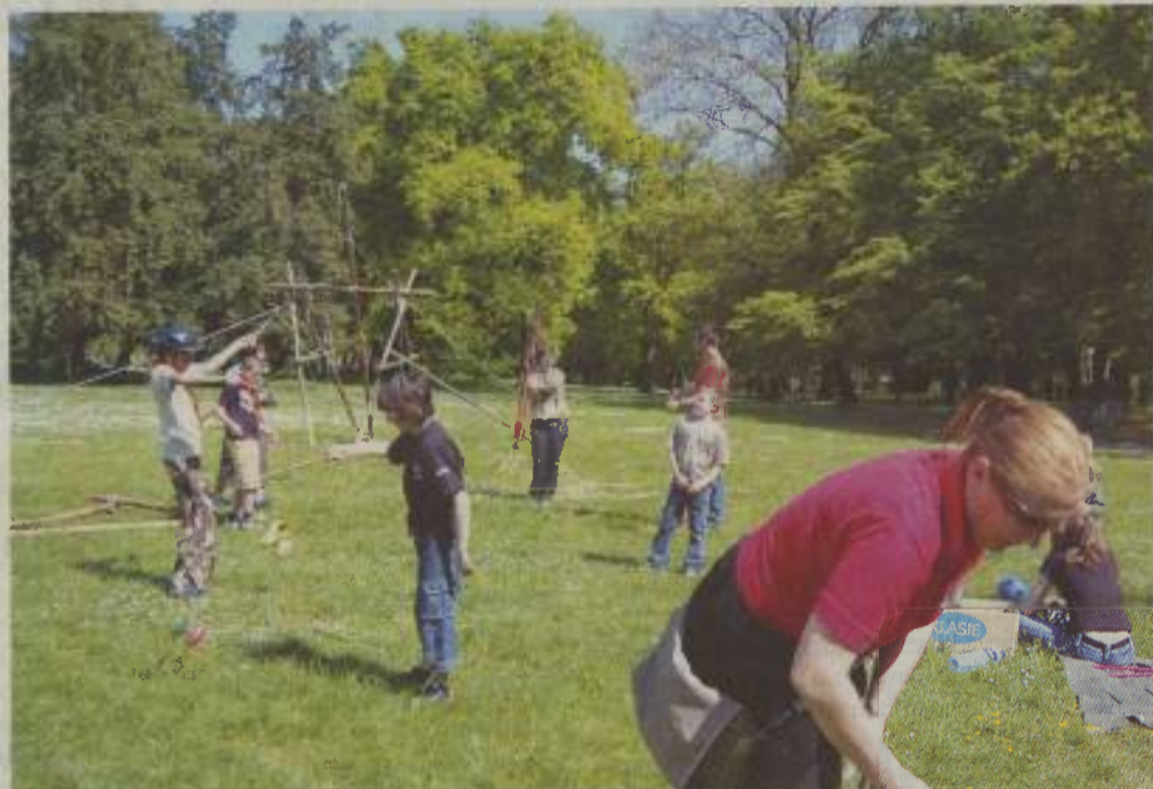
Taborništvo je za raziskovalne, ustvarjalne, vesele in samozavestne.