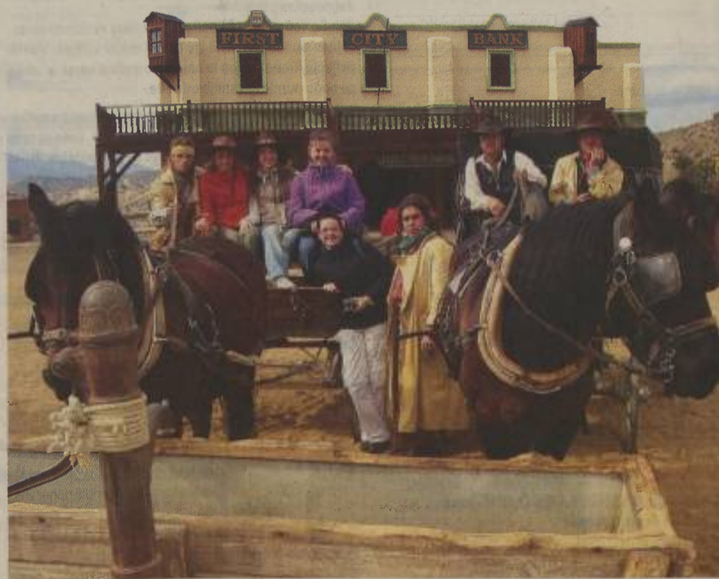
Del pokrajine v Almeriji je podoben puščavi. To je tudi kraj, kjer so Evropejci snemali svoje vesterne.

»Španci sploh ne poznajo stresa. Pri njih se psihologi in psihiatri zaposlujejo kot natakariji, ker nimajo dela. Pozna pa se tudi vpliv morja, saj je ta del popolnoma na jugu. Netočnost je zagotovo njihova vrлина. Na primer avtobus lahko čakaš eno uro ali celo več, ampak njih to nič ne moti.«