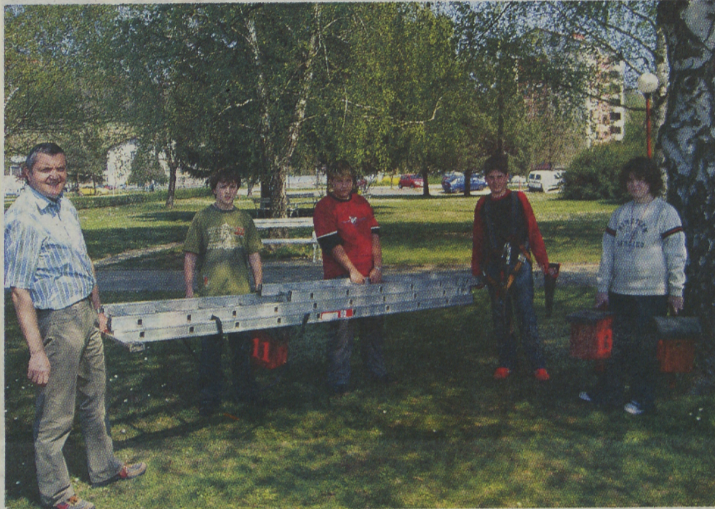
Šolarji so skupaj s članom Doppsa gnezdilnice postavili na drevesa tudi pri hotelu Lipa.

primerna za posamezne vrste ptic glede na premer lukenj. Ponavadi jih zasedajo ptice duplarji, torej ptice, ki sicer gnezdi v drevesnih duplih. To so sinice, brglez, škorci in podobno, pričakujejo pa, da bo največ sinic. Gnezdišča so izdelana iz smrekovega lesa z luknjo na čelni strani, zaščiteni pred vlago in dežjem, za ptice pa dejansko