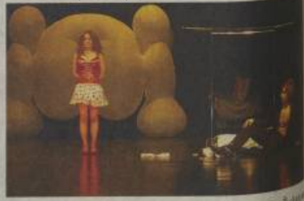
MLADI gledališčniki iz Lendave so se uspešno spopadli z igranjem podeželskih plejbojev.