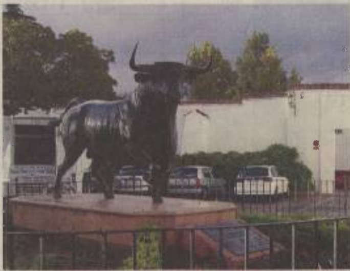
Za Španijo so značilne bikoborbe. Ob odkrivanju njenih lepote se je Tončka ustavila tudi v Malagi in v fotografski objektiv takole ujela kip bika pred bikoborsko areno.

»Če bi morala oceniti svoje znanje španščine danes od ena do pet, bi rekla, da je znanje tako za štiri, recimo.«