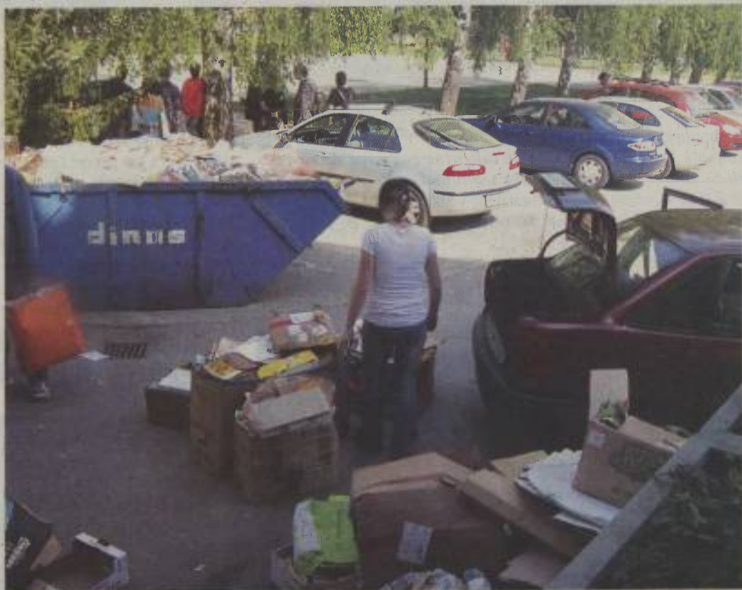
Mladi so se rešili nepotrebne navlake.

Skrb dijakov SŠGT Radenci je tudi čisto okolje. Na letošnjem pomladnem ekodnevu, na katerem so zbrali nad 4268 kilogramov starega papirja, tem zaznamovali tudi 22. dan Zemlje.