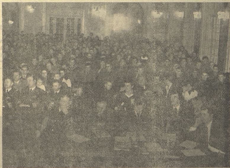
Vojaki in mornarji so se množično udeležili kviza Armada zmage — Armada svobode

Konferenca mladih delavcev OZD Steklarna Hrastnik