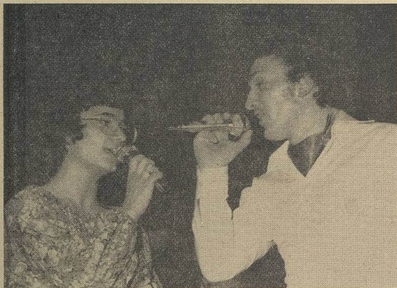
V bogatem kulturnozabavnem programu tekmovanja Armada zmage — Armada Svobode, so sodelovali tudi mladi iz OK ZSMH Pula.