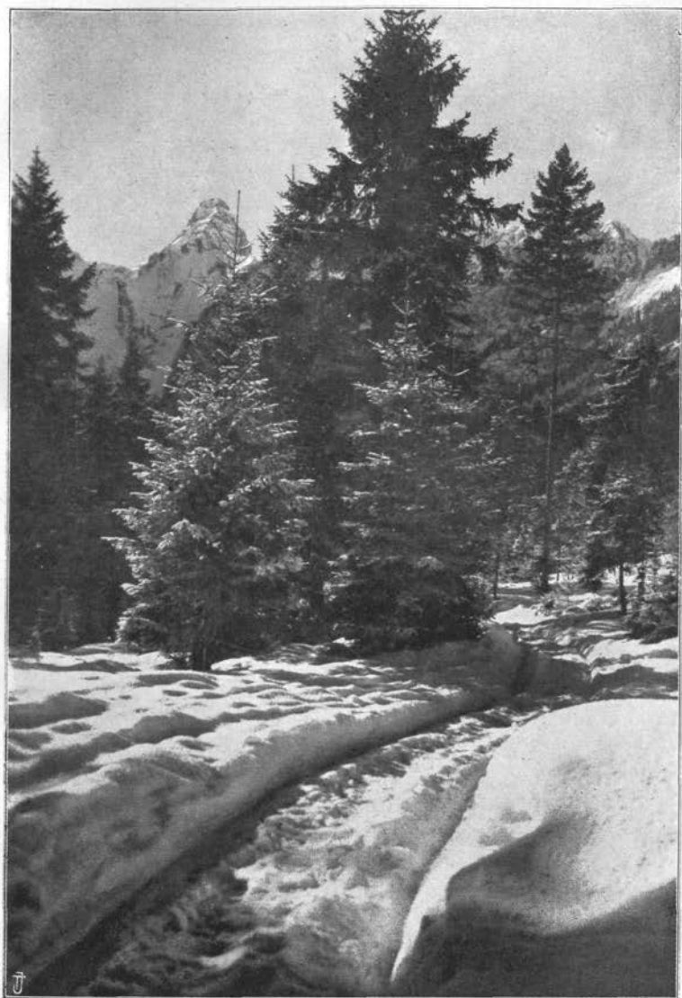
Zimski motiv iz Kota