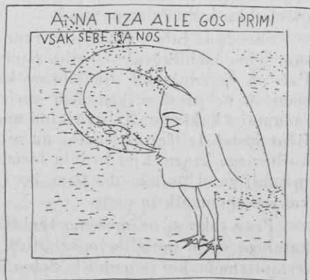
Skica ptice na stropu v Martinjaku. Pike pomenijo slabo ohranjena mesta.