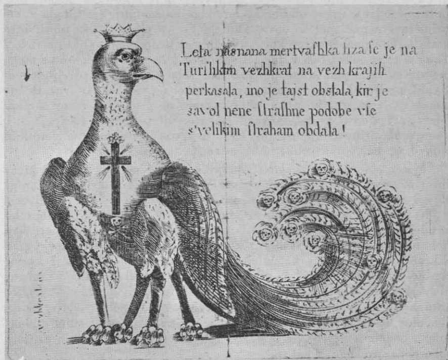
Bakrorez »mrtvaške ptice« iz Gabrove zbirke.

Na zelenem tlu pred belim ozadjem stoji velika ptica s štirimi nogami; čez bedra se menda prevešata dve manjši krili, dve večji peruti pa sta razpeti ob strani. Rep je dolg, košat in v loku zasukan navzgor. Z »orlovske« glavo, ki jo krasí rogljata krona, se ptica ozira na svojo levo. Temeljna barva trupa, peruti in repa je zelena, prsni del je rjav,