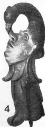
4. Glava sani s Tirolskega; Dunaj, Museum für Volkskunde (po L. Schmidtu). 5. Končnica z »mrtvaško ptico«, Etnografski muzej v Ljubljani