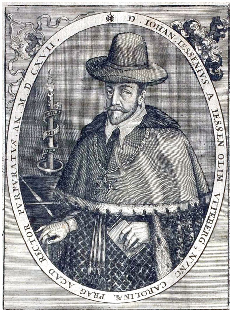
Ján Jesenský (Johann Philipp Abelinus, Theatrum Europaeum, Oder Außführliche und Wahrhaftige Beschreibung aller und jeder denckwürdiger Geschichten , 1635)