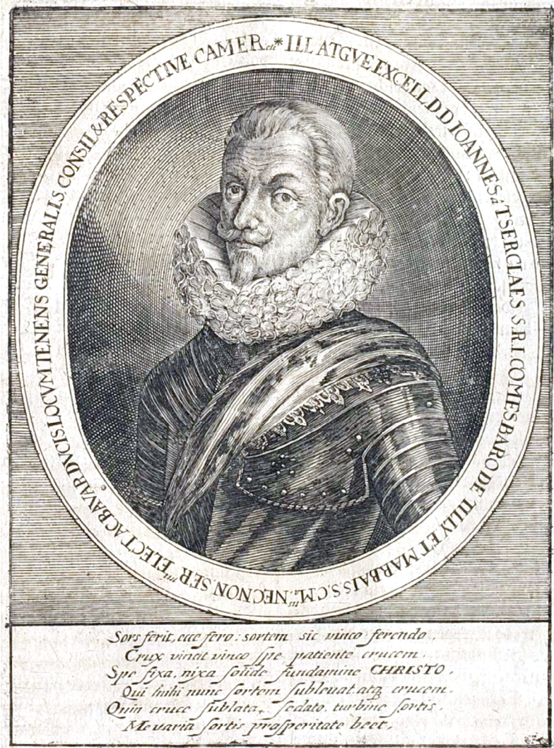
Johannes Tserclaes Tilly (Johann Philipp Abelinus, Theatrum Europaeum, Oder Außführliche und Wahrhaftige Beschreibung aller und jeder denckwürdiger Geschichten , 1635)