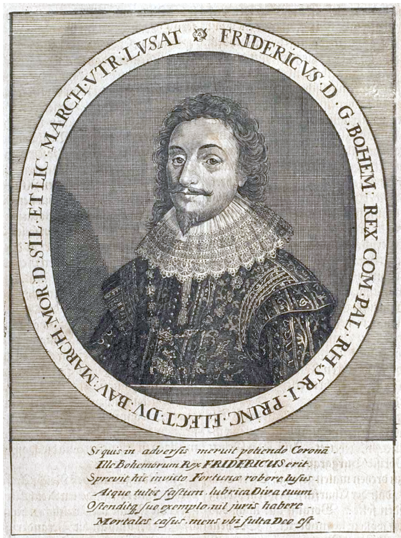
Friderik V. (Johann Philipp Abelinus, Theatrum Europaeum, Oder Außführliche und Wahrhaftige Beschreibung aller und jeder denckwürdiger Geschichten , 1635)