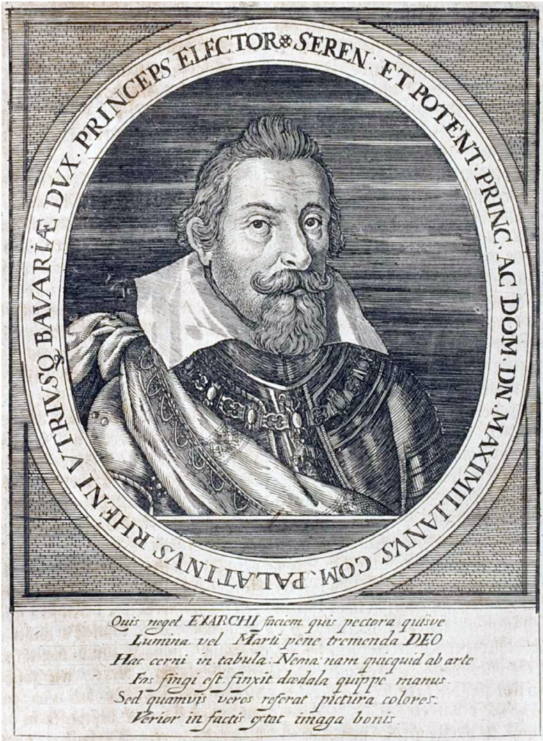
Maksimilijan Bavarski (Johann Philipp Abelinus, Theatrum Europaeum, Oder Außführliche und Wahrhaftige Beschreibung aller und jeder denckwürdiger Geschichten , 1635)