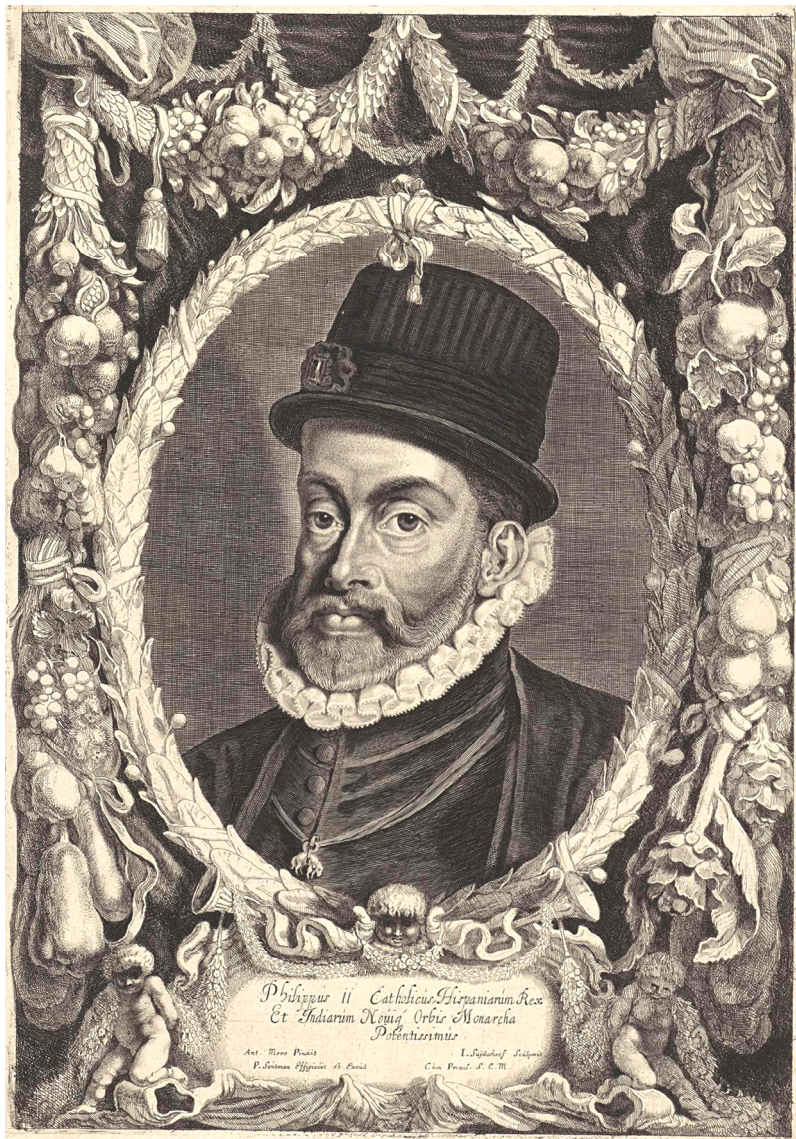
Pieter Soutman, Anthonis Mor, Filip II. Španski , bakrorez, 1644–1650