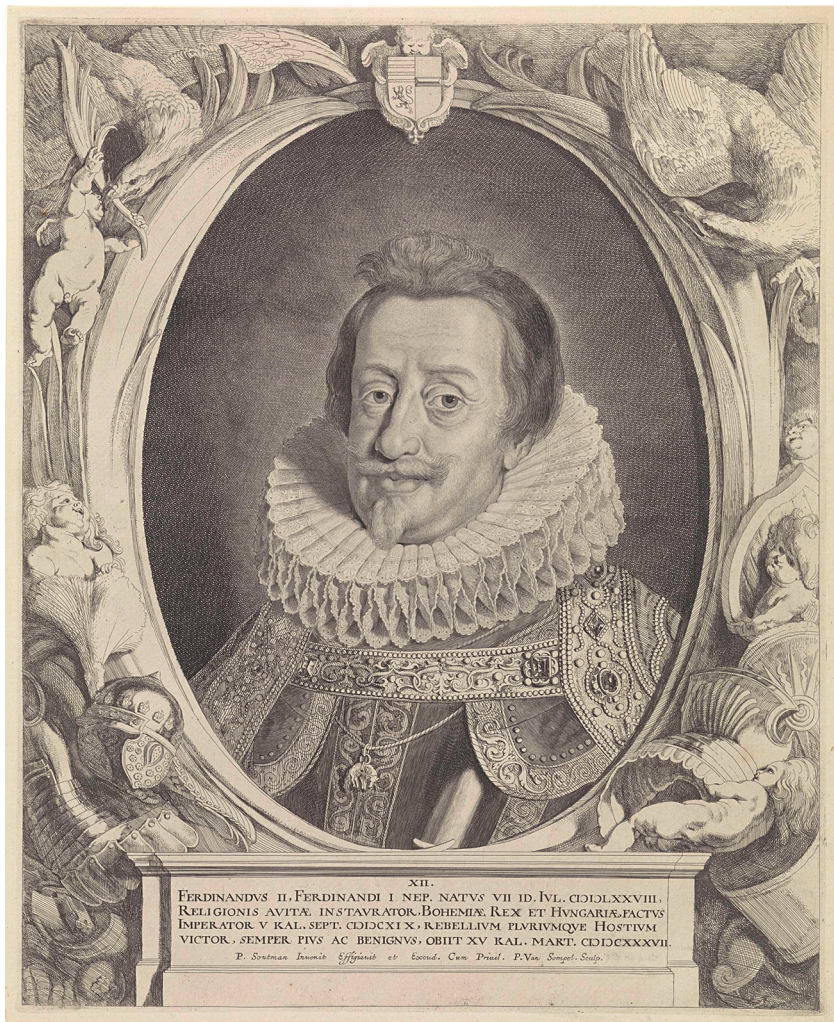
Pieter Soutman, Ferdinand II. , bakrorez, 1644–1650