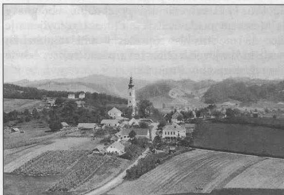
Sveta Barbara v Halozah (Cirkulane) okoli leta 1900.

V boju za preživetje se je znašla tudi tista maloštevilna, pretežno podeželska delovna sila, ki ji je uspelo najti delo v skromni industriji. Odvisna od samovolje delodajalcev je zaradi majhnega zaslужka zahajala v oportunistem. Od moči strokovne organizacije je bil odvisen uspeh mezdnih gibanj, ki so v tridesetih letih predvsem zasledovala izvajanje kolektivnih pogodb. Iz boja za uveljavitev delavske zakonodaje povzemamo značilnosti posameznih gibanj.