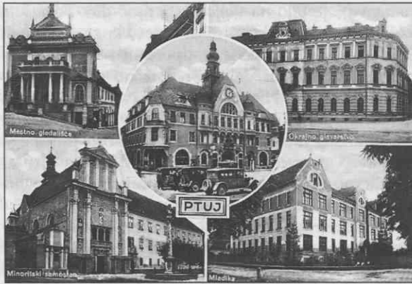
Ptuj leta 1936.

svoje pridelke pod ceno. Potrošnika so bremenile cene na drobno. Ptujski trgovci, peki in mesarji so se okoriščali z visokimi maržami. Od januarja do junija 1929 so se cene moke znižale za ok. 75 par, tako da je bila cena pšenične moke tretje vrste od 3,50 do 3,75 din, cena kruha je ostala nespremenjena; za kg črnega kruha je bilo potrebno odšteti 4,50 din. Po posredovanju sreskega načelnika so se morale cene kruha v ptujskem okolišu znižati za 50 par. Ko pa je leta 1930 "Društvo državnih nameščencev in upokojencev v Ptuj" zahtevalo znižanje cen mesa in kruha, so občinski organi menili, da te niso visoke. Cena mesa je bila npr. v neskladju z nakupno ceno živine: kg govedine je npr. veljal 16 do 18 din, živa teža krave se je gibala od 3,25 do 6 din za kg. 38 Mestni magistrat se je sicer lotil protidraginjskih ukrepov že leta 1931 in tudi izvolil aprovizacijski (prehrambeni) odbor, toda cenovna neskladnja so ostala. Družbenogospodarska nasprotja so se poglobljala.