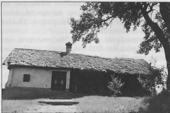
V slabem stanju ohranjena viničarska hiša na Gorci v Halozah. Kot etnološki muzej naj bi poznarjala življenje viničarjev.