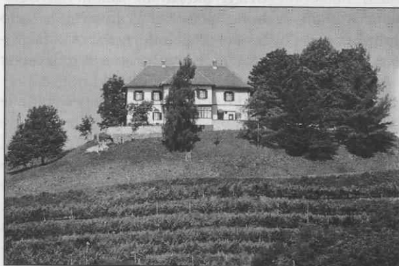
Posamezni vinogradniški hrami v Halozah še pričajo o udobju njihovih lastnikov. Na posnetku Ornigova vila na Gorci nad Podlehnikom.

Novo razburjenje je prinesel vladni osnutek o državnih nameščencih in železničarjih, s katerim so kršili priborjene pravice o dopustu, delavniku in socialnem zavarovanju. Zato sta se 2. avgusta 1923 povezali strokovna organizacija železničarjev in društva nameščencev ter razglasili 24-urno protestno stavko.