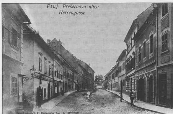
Osrednja Prešernova ulica v Ptujju leta 1921. Nemški napisi v mestu še niso bili odstranjeni.

Nenaklonjenost krajevnih oblasti do zahtev trgovskih nastavljenecv se je pokazala že avgusta 1919, ko so ti predložili osnutek kolektivne pogodbe o čezurnem delu, obiskovanju trgovske šole, draginjskih in družinskih dokladah, plačevanju vajencev od 50 do 100 kron na mesec in plačilu trgovskih pomočnikov v razponu od 300 do 500 kron. Mestni urad je zavrnil predloge, češ da nima "ingerence" urejati status članov. Urad bo poskušal urediti stanje pri trgovskem gremiju.