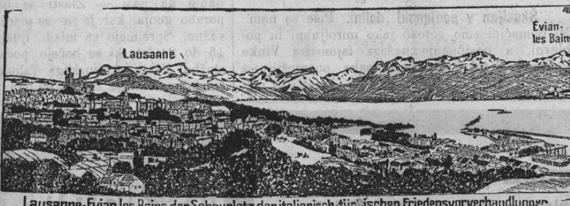
Lausanne-Evian les Bains, der Schauplatz der italienisch-türkischen Friedensverhandlungen

Mir? Turško-italijansko vojska traja takoj tako dolgo, da sta obe strani že iz go- spodarskih ozirov prisljeni želeli mir. V švicarskem mestu Lausanne ob Genferskem jezero se vršijo baje zdaj tudi že mirna pogajanja, ki so seveda doslej strogo tajna. Zastopniki Turčije stanujejo v so- sednjem mestu Evianu, zastopniki Italije pa v Lausannu; naprave se vršijo enkrat v tem, potem zopet v drugem