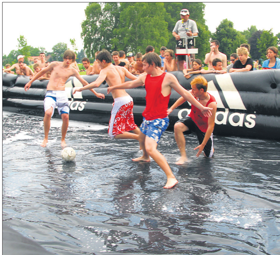
Nogomet na milnici je že tradicionalna igra Bazenov energije, brez katere ne gre.