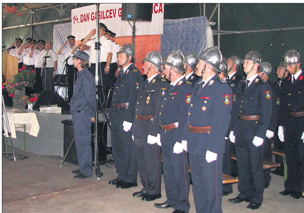
Goriški gasilci so v nedeljo obeležili 14. dan gasilcev GZ Gorišnica in 105 let gasilske tradicije v občini.