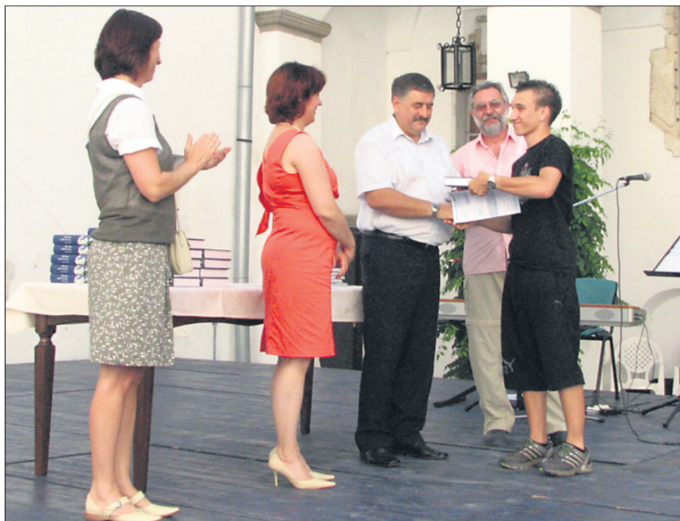
Uspešnim maturantom so svečano predali maturitetna spričevala na grajskem dvorišču.