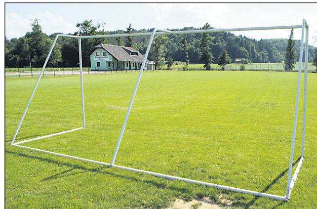
Športni park Grajena bodo kmalu povečali, za nakup zemljišča za ureditev pomožnega igrišča je že vse pripravljeno.