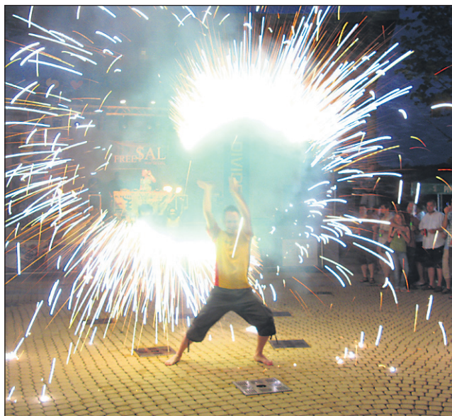
V večernih urah se je dogajanje preselilo v amfiteater ptujskih term.

V poznih popoldanskih urah so organizatorji zabeležili več kot 3000 obiskovalcev, njihovo število pa se je v večernih urah, ko je bila na vrsti zabava v amfiteatru, še povečalo. Po 21. uri so namreč nastopili