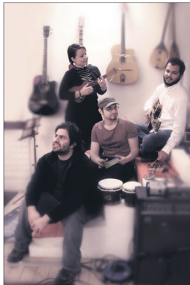
Otvoritev festivala TerasaFest bo zaznamovala mlada mednarodna zasedba Ólala.