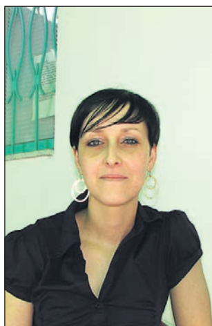
Magdalencova je odslej na čelu ekipe Petv.

Naslednji večji projekt jih čaka že čez nekaj dni. So na-