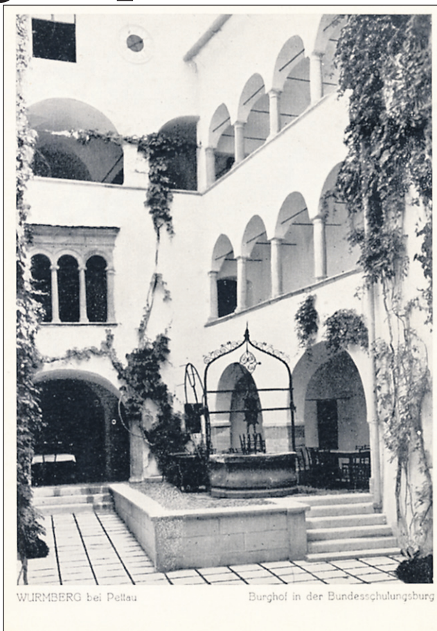
WURMBERG bei Peltau Burghof in der Bundesschulungsburg