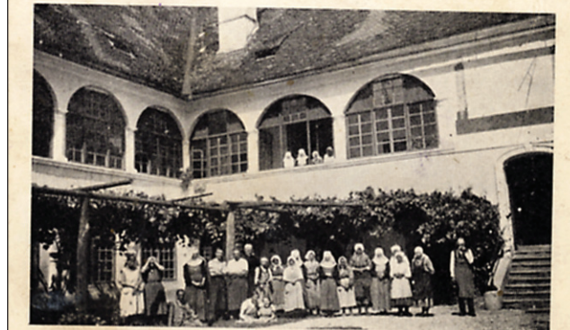
Zavetišče za onemogle (hiralce) križniškega reda v Muretincih niže Ptuja

Lastniki graščine v Muretincih so bili do leta 1945 velikonedeljski križniki, ki so tam leta 1927 ustanovili hiralnico za varstvo in nego starejših ljudi.