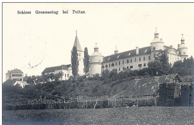
Schloss Grossontag bei Peltau.

Lastniki graščine v Muretincih so bili do leta 1945 velikonedeljski križniki, ki so tam leta 1927 ustanovili hiralnico za varstvo in nego starejših ljudi.