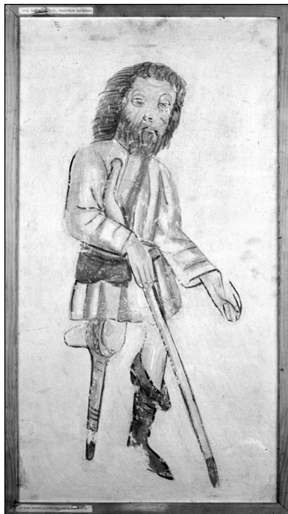
Janez iz Kastva, Noša berača, kopija detajla freske iz cerkve sv. Trojice v Hrastovljah, okoli 1490 (Mestni muzej Ljubljana).

Glede na vse obrambne in represivne ukrepe, ki so jih posamezne skupnosti sprejemale, da bi se ubranili množice beračev, so morali biti le-ti res številčni. Prav v tem času so napovedali vojno t. i. "poklicnim" beračem, ki so se premikali iz kraja v kraj, odvisno od bližnjih in daljnih dogodkov, cerkvenih praznikov itn., kjer so lahko pričakovali miloščino. Drastično spremembo v dojemanju revščine je pomenilo sedemnajsto stoletje. Reveže, klateže, postopače so začeli enačiti s kriminalci.