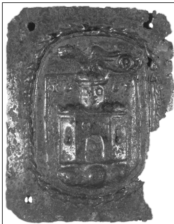
Beraška značka 1677 (Mestni muzej Ljubljana).

Ljubljanska beraška značka iz leta 1667, ki jo je prvi opisal dr. Otorepec, je medeninasta ploščica, velika približno 5 krat 4 centimetre. V sredini v ščitu je vtisnjen grb mesta Ljubljane, na treh stiliziranih hribočkah je grajsko obzidje s stolpom, ki ga zaključujejo cine. Nad grajskim stolpom je v desno obrnjen zmaj z iztegnjenim dolgim jezikom, dvignjenimi krili in enkrat zavitim repom. V zgornjem delu grbovnega polja so vtisnjene številke 16–67, kar je, najverjetneje, pomenilo leto izdaje značk.