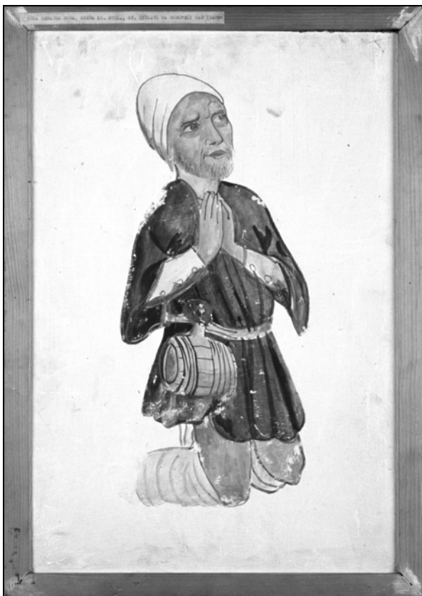
Učenec mojstra Bolfanga, Moška beraška noša, kopija detajla freske iz cerkve sv. Miklavža v Goropeči, po letu 1470 (Mestni muzej Ljubljana).

Ob tem dogodku, prvem znanem podeljevanju mestnega znaka ali beraške značke, se je mesto "odkupilo" nezaželenim beračem z delitvijo kruha. 29 Izplačana vsota denarja za žito za peko prepečenca (ali gre morda za suh kruh), s katerim so odpravili nezaželene tuje berače iz mesta, je bila visoka, kar morda lahko kaže na množico beračev v mestu ali pa, da so se prav zaradi tega dogodka natepli v mesto. Za peko kruha so porabili cel star žita, t. j. okoli 106 litrov pšenice ali rži oziroma do 118 litrov ovsa (v Ljubljani je bil v veljavi ljubljanski star). 30 V letu 1622 so v Ljubljani s tem ukrepom zaključili z izdajanjem pomoči za to leto.