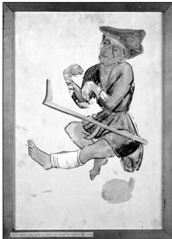
Učenec mojstra Bolfanga, Moška beraška noša, kopija detajla freske iz cerkve sv. Miklavža v Goropeči, po letu 1470 (Mestni muzej Ljubljana).

V Gradcu so leta 1647 razdelili 300 mestnih značk. Očitno je bila situacija podobna kot v Ljubljani. Leta 1679 so v Gradcu popisali tristo triindvajset beračev, glavnino so predstavljale stare in nepreskrbljene ženske. Za leto 1680 pa so bili narejeni izračuni, ki trdijo, da je bilo v mestu kar 10% beračev. 46